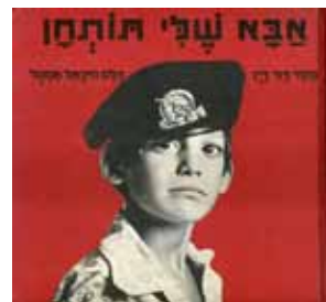
עומר בן ה-6 בשער הספר אבא שלי תותחן פורסם 1974

במקביל לעבודתו העיתונאית כתב דיין קרוב ל-20 ספרים בנושאי צבא וביטחון וגם ספרי ילדים. לאחד מספריו יש קשר לעיר רעננה. "לאחר מלחמת יום הכיפורים פניתי להוצאת 'עם עובד' והצעתי להם סדרת ספרים מנקודת מבטם של ילדים שאבותיהם אינם נמצאים בבית עקב שירותם הצבאי. הצעתי התקבלה