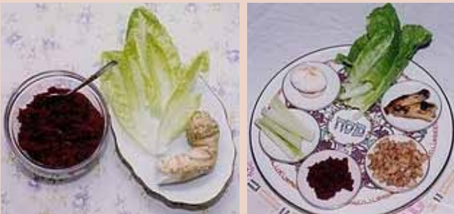
שלושה סוגי מרור (מימין לשמאל): שורש חזרת, עלה חסה, ו"חריין" (חזרת מגורדת עם סלק מבושל).

במרכזו של שולחן ליל סדר פסח מונחת קערה ולה שמות שונים: קערת ליל הסדר, קערת הסדר, או קערת הפסח. הקערה יכולה להיות צלחת מסורתית פשוטה עד קערה אומנותית עם סמלים יהודיים ידועים עשויה ממתכת, מעץ או מקרמיקה, שטוחה או בקומות. בקערה זו מוצגים שישה מאכלים המייצגים רעיונות הקשורים לסדר הפסח וליציאת מצרים. כל אחד מששת המאכלים נאכל או מוצג במהלך קריאת הגדת הפסח. מוצגים אלה מטרתם לעורר את סקרנותם של הילדים ולגרותם לשאול שאלות, וכן להמחיש את סיפור ההגדה. על קערת ליל הסדר מניחים בדרך כלל את המאכלים הבאים: