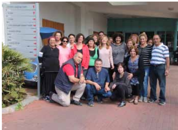
צוות עובדי מרכז היום

אלו שינויים ותוספות היית רוצה לבצע? "היעד שאלי אני מכוונת הוא להתערות בחיי הקהילה בעיר, ליצור שיתופי פעולה עם גורמים וולונטריים ועסקיים על מנת להעשיר את הפעילות במרכז ולפתח אותה."