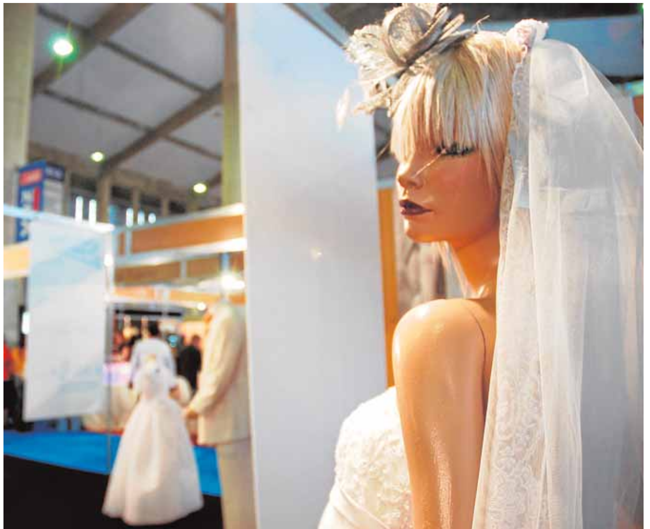
Un maniquí con un traje de novia, uno de los artículos en los que más se puede ahorrar en una boda. :: LA VOZ

En el traje de los novios también se va un buen pellizco. El vestido de las novias se mueve en una horquilla de entre 525 y 1.650 euros (sin contar con los inevitables complementos, zapatos, maquillaje, peinado y ramo, que encarecen la cuenta entre 300 y 700 euros). En el caso del novio, el gasto total oscila entre los 375 y los 780 euros. Un truco para ahorrar es el alquiler del traje, una opción por la que secretamente apuestan muchas parejas, ya que los alquileres ronda los 300-700 euros en el caso de las mujeres y los 90 en el de los hombres.