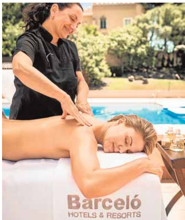
Una clienta recibe un masaje cerca de la piscina.

La gran novedad con la que quiere sorprender Montecastillo es con sus 'Healthy Weddings', en la que se incluyen menús saludables, bajos en grasas y azúcares, y con altas dosis de elementos antioxidantes, vitaminas y minerales, pero igualmente deliciosos y propios de la alta cocina, además de aptos para alérgicos e invitados con intolerancias a determinados alimentos. Unas propuestas que se extienden tanto a aperitivos y platos principales como a la barra libre y a los dulces. Y es que el hotel pone a disposición de los contrayentes su 'Candy Bar', con propuestas como las fuentes de chocolate negro con un 70% de cacao y bajo en azúcar y deliciosas brochetas de frutas en su punto óptimo o bombones de chocolate orgánico aptos para intolerantes a la lactosa o al gluten. Además, los que