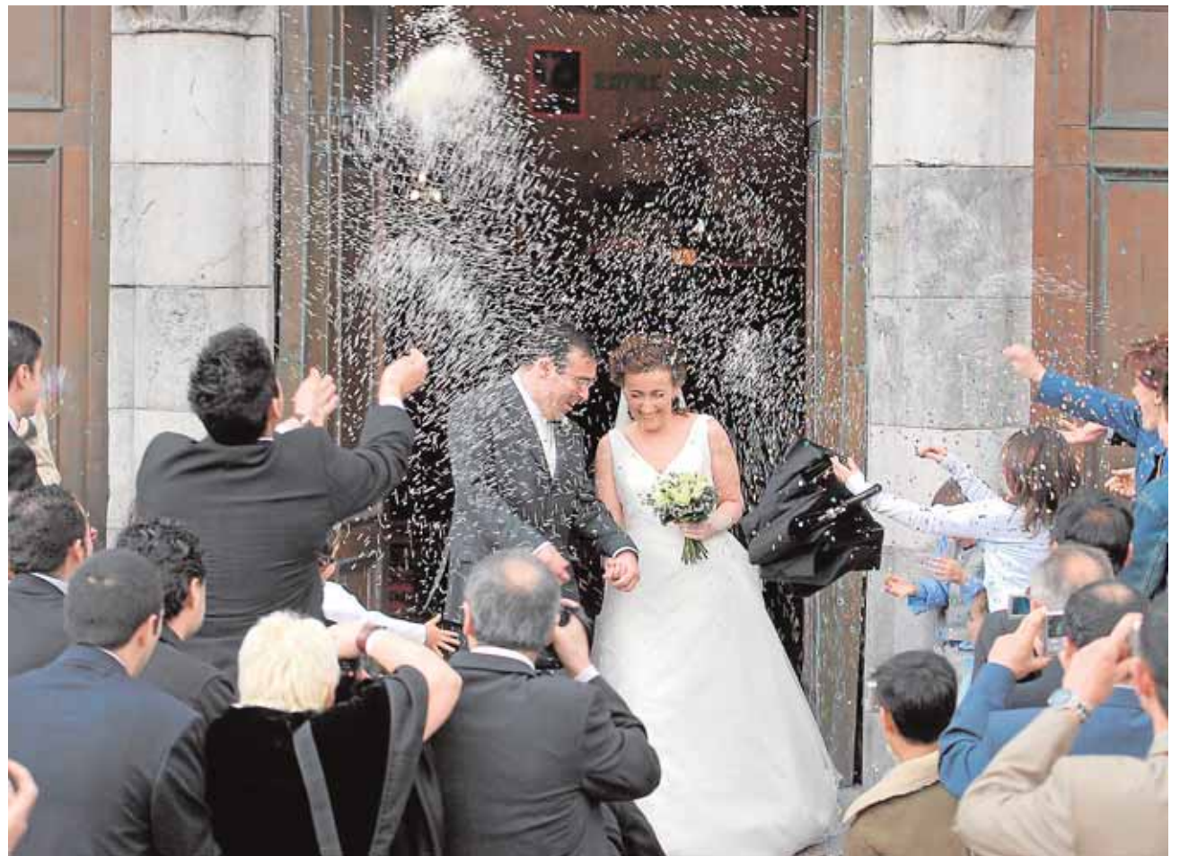
Una pareja sale de la iglesia después de haber celebrado su boda.

Revisando las estadísticas también se descubre cuál es la edad que eligen los gaditanos para casarse (o, mejor dicho, cuando se unen el querer y el poder). Y hay diferencias entre los hombres y las mujeres. Mientras que la edad más frecuente (la moda, sería el término exacto