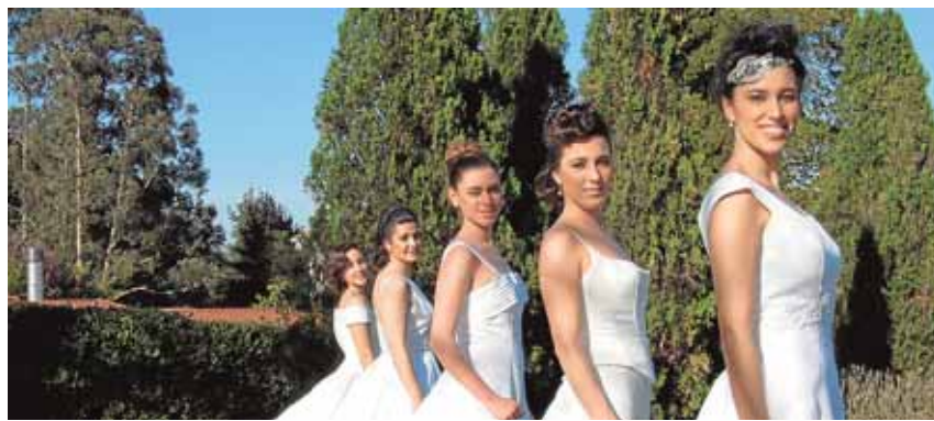
Presentación de peinados para bodas de una cadena de peluquerías.

'Looks' más informales y juveniles se imponen en los últimos años sobre el clasicismo