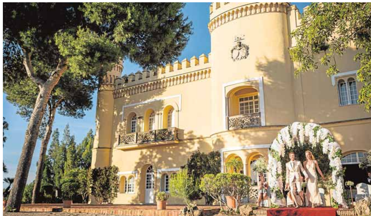
El entorno del Hotel Barceló Montecastillo es ideal para una boda al aire libre. :: LA VOZ

Para acabar, dos propuestas de Barceló Montecastillo para antes y después de la boda. Los novios pueden recibir clases particulares de baile en el hotel por si quieren sorprender a sus invitados con una coreografía. Y para el día después, el hotel ofrece para los novios y sus más allegados una sesión de 'bootcamp', el divertido ejercicio grupal que simula el entrenamiento de los marines.