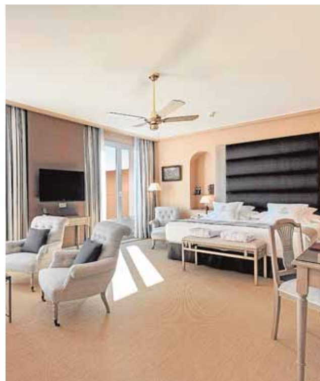
Espectacular interior de la categoría superior. :: LA VOZ

no tomen alcohol, podrán disfrutar de una barra libre plagada de 'smoothies', cócteles elaborados en el momento a base de zumos naturales de sandía, maracuyá, fresa o mango, o licores bajos en calorías sin alcohol.