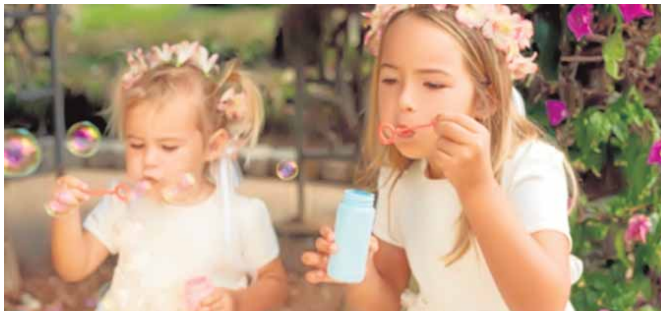
Dos niñas juegan en una boda a hacer pompas de jabón.