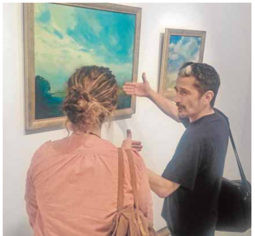
Desde mañana y hasta el próximo día 13 podrá visitarse la muestra