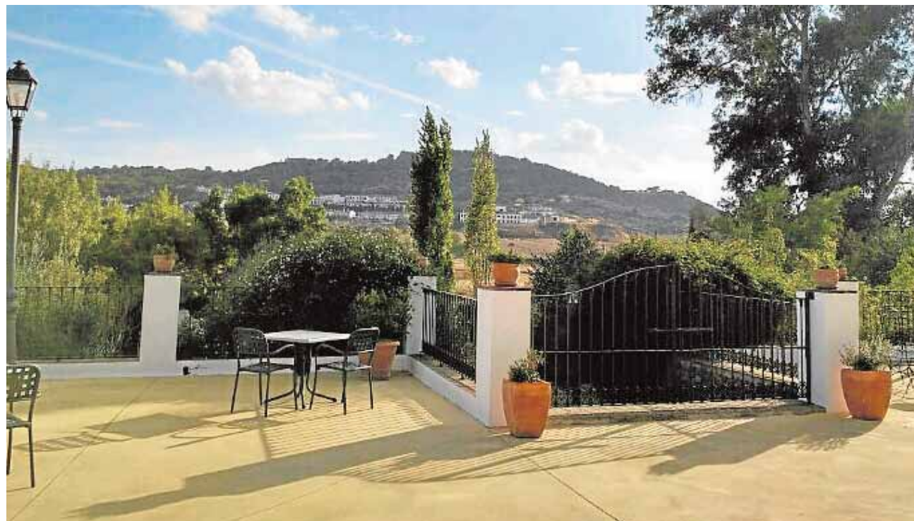
El restaurante Cortijo Vistalegre tiene vistas a los jardines y a las montañas del municipio

Los clientes de Vistalegre proceden sobre todo de los pueblos de la comarca, pero en primavera se revierte la situación y vienen de otros pueblos de Sevilla, de Córdoba y de Extremadura.