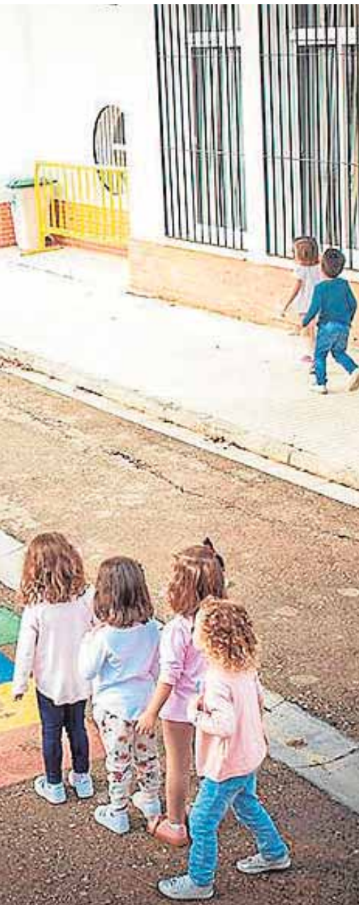
Los niños en el atardecer

«Al final todo educa, incluso la falta sistemática de proyectos de educación», afirma el docente, quien cree que los alumnos han de ser ante todo felices. «Si detectamos felicidad, motivación y autoestima vamos por el buen camino», apostilla.