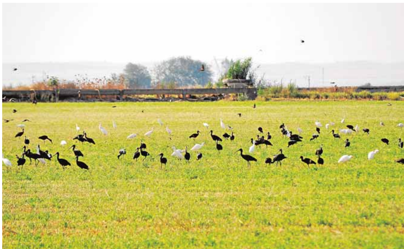
La introducción de los cultivos forrajeros en la comarca ha provocado la llegada de nuevas aves

material escolar de más de cincuenta niños pertenecientes a familias de la localidad con pocos recursos económicos. Dicha cuantía procede de la aportación que reciben como ediles en el Ayuntamiento palaciego. F.R.M.