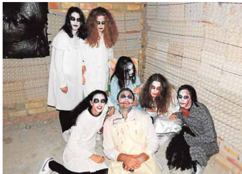
Los vecinos decoran una casa del barrio alto con motivos terroríficos