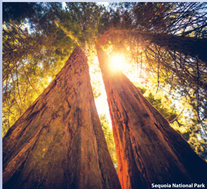
Sequoia National Park