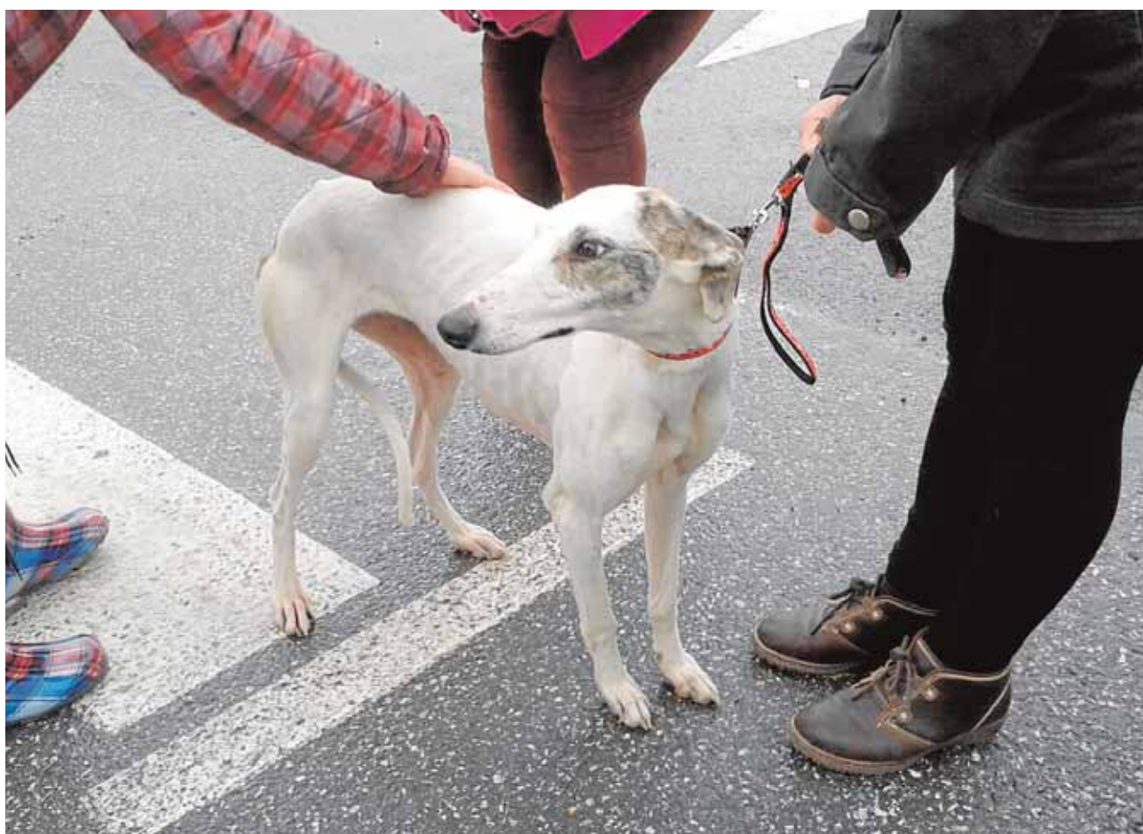
Margarita es una de las perras abandonadas de las que se ha hecho cargo la asociación 4 Patas El Pedroso G.J.L.

Municipal de Deportes. Todos aquellos equipos que deseen participar deberán realizar una inscripción previa. El plazo se inició ayer y está abierto hasta el 28 de junio. El equipo ganador recibirá 600 euros, el segundo 300 y el tercero 100. G.J.L.