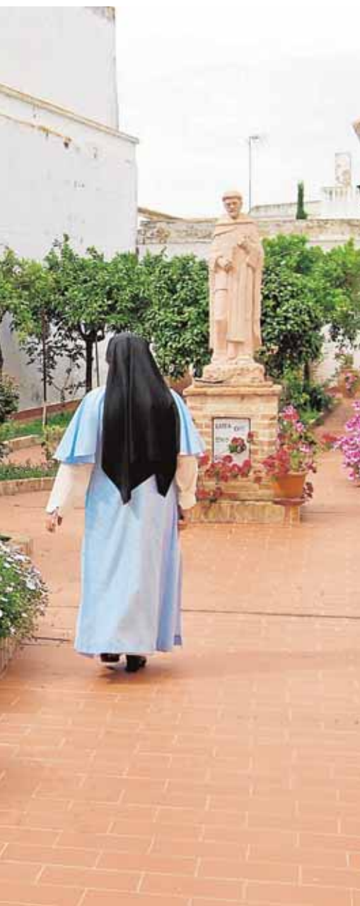
ue ahora se abre a los visitantes

puzano, ya tiene cubiertas más de la mitad de las inscripciones, según informa la organización. El encuentro aglutinará a más de 200 participantes de todo el territorio nacional en una Lan Party que ofrecerá regalos y conexión de 10 Gb.