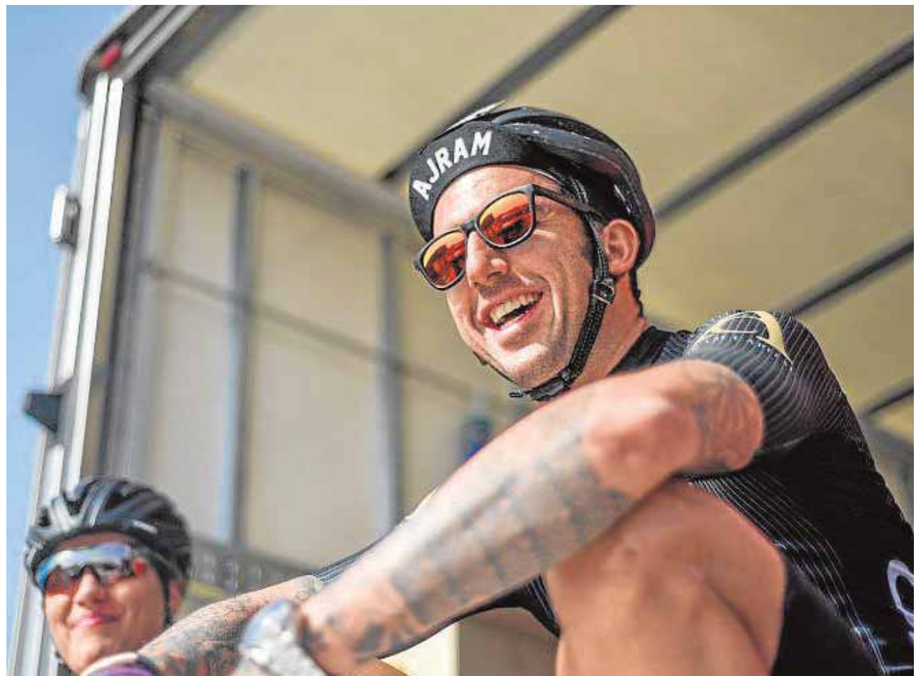
El deportista Josef Ajram atraviesa desde hoy la península por la Ruta de la Plata hasta el próximo sábado

Ajram ha escrito cinco libros sobre cuestiones diversas ligadas a su actividad. Desde superación personal y métodos para alcanzar objetivos, a recetas para superar la crisis económica y para obtener beneficios con la inversión bursátil, o sobre los límites a la hora de afrontar como deportista retos y desafíos extremos. «Vivimos unas circunstancias únicas y debemos aprovechar cada oportunidad para evolucionar y mejorar, adaptándonos a esta nueva realidad y superándonos día a día para mantenernos a la vanguardia de la tecnología y todas las ventajas que ofrece», detalla el deportista, que asegura que ya acostumbraba a realizar pagos sin metálico, por lo que asumió este reto sin mayor reticencia.