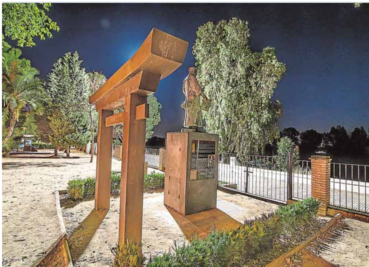
Estatua frente al río Guadalquivir de Hasekura Tsunenaga en honor al pasado nipón de la localidad

prueba es un evento de carácter solidario. Todo lo recaudado en el evento se destinará al grupo de investigación de enfermedades raras del colectivo de mujeres de la localidad, para proporcionar una mejora en las condiciones de vida de estas vecinas.