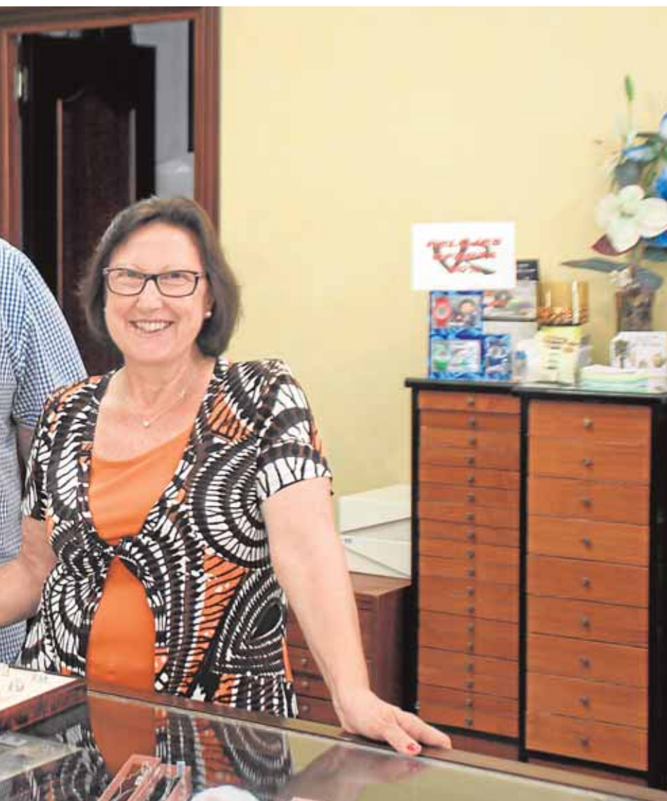
les, su mujer, en la primera joyería que abrieron en Castilleja de la Cuesta

ten a escasos metros, dado el comienzo del aumento de temperaturas durante el período estival. De esta forma se intenta evitar el incidente acontecido hace un año, en el que la maleza que había en el solar prendió y ocasionó un importante incendio.