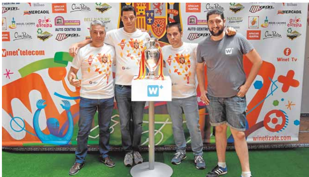
Los primeros estepeños disfrutaron ayer del debut de la Roja desde la pantalla de un cine

puedan divertirse y aprender durante los meses de verano. Ambas actividades se celebrarán desde el 27 de junio hasta el 19 de agosto, e incluyen juegos, actividades para reciclar y cuidar del medio ambiente o natación entre otras cosas. B.M.