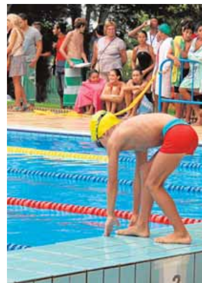
Piscina de Sanlúcar la Mayor

La piscina más económica del Aljarafe es la de Carrión de los Céspedes,