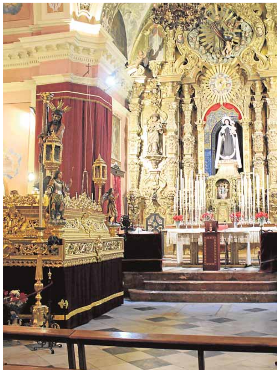
Los pasos de la hermandad preparados para la salida del Jueves Santo

Fue cuando la última orden religiosa, la de las Hermanas Franciscanas del rebaño de María. Aun así, «la hermandad ha continuado, dentro de sus posibilidades, con la labor social que hoy desempeña». Y no es poca esa labor: entre sus acciones sociales se encuentran la colaboración con Cáritas en las parroquias, becas universitarias (dotando 3.000 euros a jóvenes de Arahál que no puedan permitirse una educación en Sevilla), clases particulares para quienes no puedan pagar apoyo y refuerzo, colaboración con Manos Unidas, recogida de alimentos y ayu-