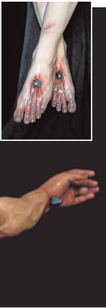
Oratorio de un cortijo de Castilblanco

La Madrugá termina en la Sierra Norte con la salida de Nuestro Padre Jesús Nazareno y la Virgen de la Amargura en Guadalcanal, a las que todos los guadalcanalenses acompañan, pese a las bajas temperaturas en esta época. Además, es la única procesión que sube al barrio del Espíritu Santo, el más alto del municipio.