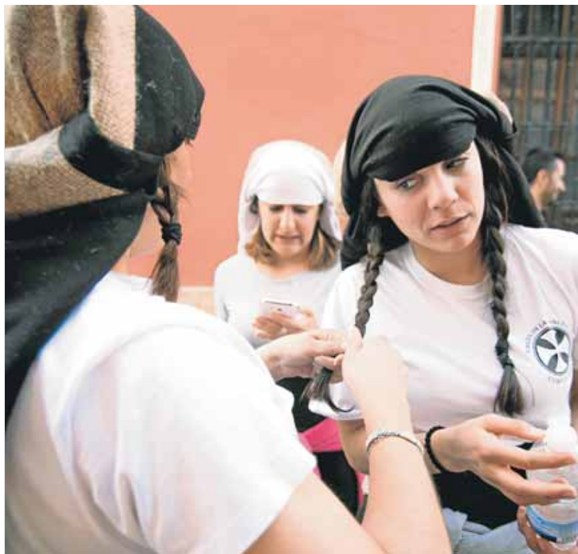
Costaleras de las Angustias de Morón, durante un ensayo

Como Eva, ella ha estado desde hace nueve años. Esta costalera recuerda aquellos días en los que tenía «nerviosismo y algo de miedo», pero todo se combatía con mucha ilusión. La que ponen todas las de la cuadrilla, que está formada por hombres y mujeres, pero que en total es «una gran familia. Hay un gran ambiente en la cuadrilla». La apuesta fue arriesgada por parte de la hermandad, pero ha