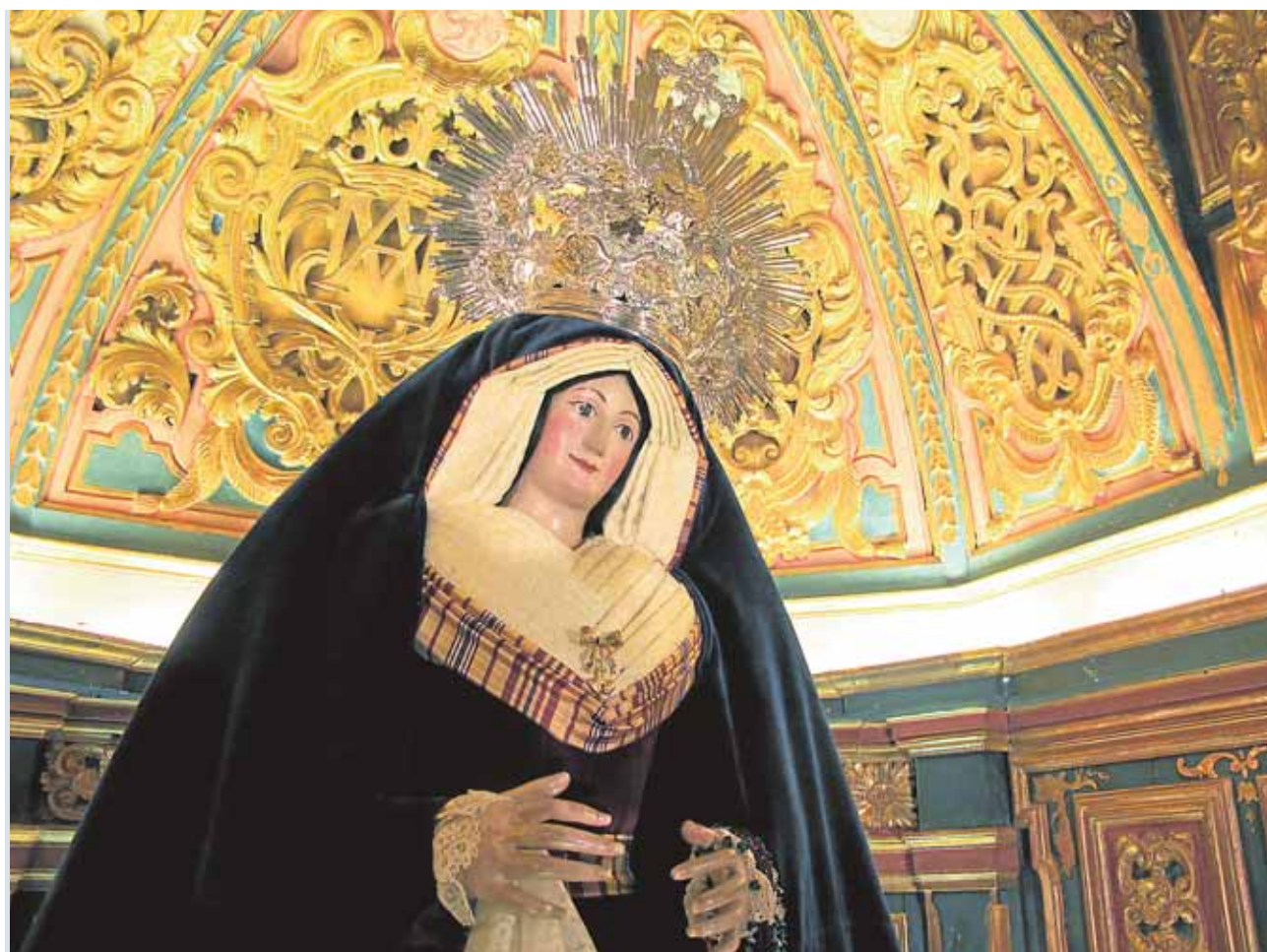
Nuestra Señora del Castillo vestida de hebrea pero con corona, otra de sus peculiaridades