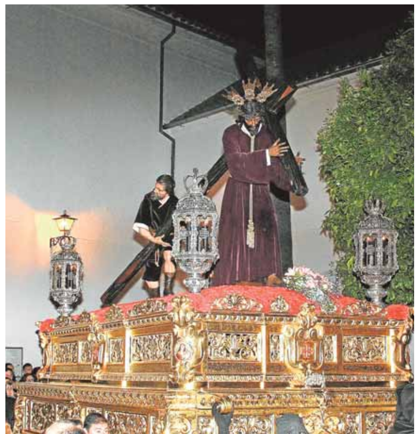
Nuestro Padre Jesús Nazareno de Constantina durante la salida

La Hermandad de la Vera Cruz de La Puebla también pone en la calle durante la Madrugá a Nuestro Padre Jesús Nazareno, que en silencio reco-