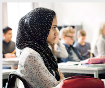
ILL. FOTO KATRINE LUNKE