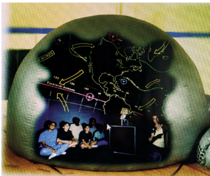
På innsida av det mobile planetariet kan elevane studere stjernehimmelen.

I Telemark ein gong på 1990-talet sa elevane at «dette var den kjekaste o-fagstimen dei hadde hatt!». Læraren deira reiste prompte til USA og kjøpte heim eit pent brukt stjernetelt med utstyr. Og slik har det dei 25 åra stjerneteltet mitt har vore i bruk, kome til ti-femten, kanskje over tjue stjernetelt til Noreg, spreidd utover landet både i nord og i sør. Men det er behov for fleire!