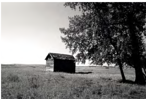
Berthe Haugens enkle hus på prærien med utsikt til Sheyenne River står fortsatt. Berthe plantet treet vi ser, og 599 andre trær.