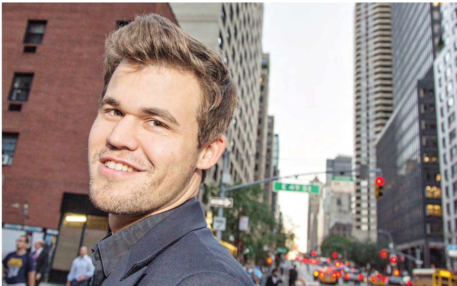
«Sjakken eller livet» har neppe vært et dilemma for Magnus Carlsen. Det er vanskelig å tenke seg det ene uten det andre. Her i New York, der han skal spille om VM-tittelen i november.

– For to år siden ble du intervjuet i Utdanning i spalten «Frisonen» . Du ble bedt om å anbefale en sjakkbok, og du svarte umiddelbart André Bjerkes «Spillet i mitt liv». Har din bok noen fellestrekk med Bjerkes bok?