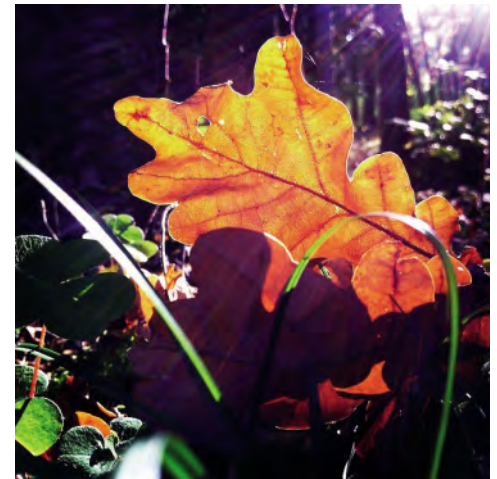
ILL.FOTO INGER STENVOLL