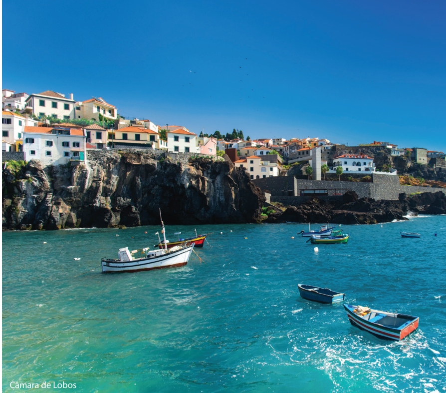
Câmara de Lobos