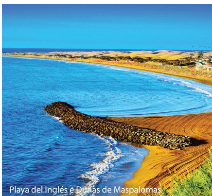
Playa del Inglés e Dunas de Maspalomas

Praias: A deslumbrante ilha de Gran Canária possui 230 km de costa e algumas das mais belas praias da Europa. Grandes ou pequenas, de areia ou de seixos, oferecem o cenário perfeito para umas férias ao sol repletas de diversão. As principais praias são: del Inglés, Maspalomas, Canteras, Amadores, Meloneras, San Agustín e Puerto Rico.