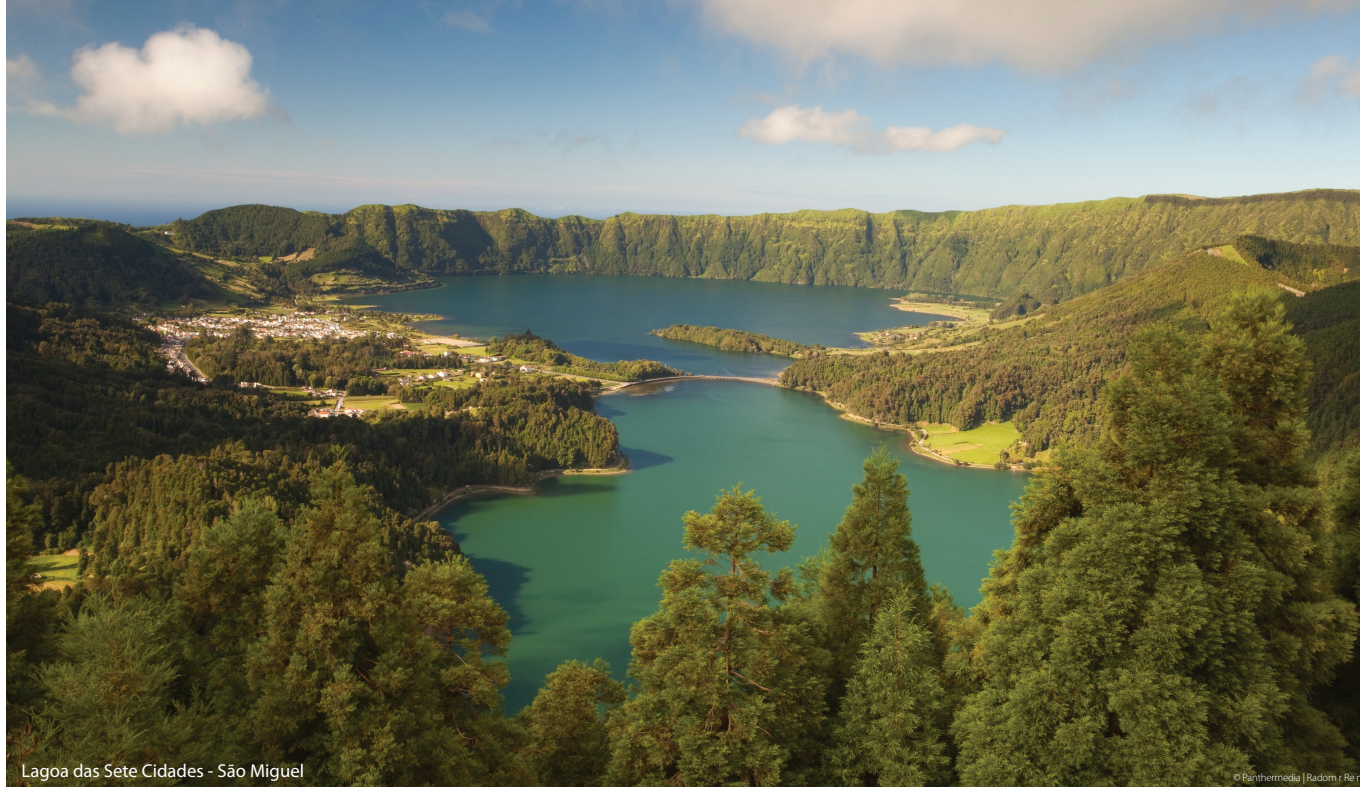
Lagoa das Sete Cidades - São Miguel