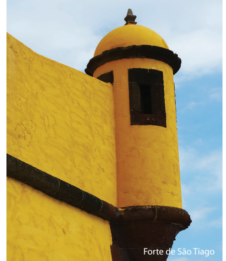
Forte de São Tiago