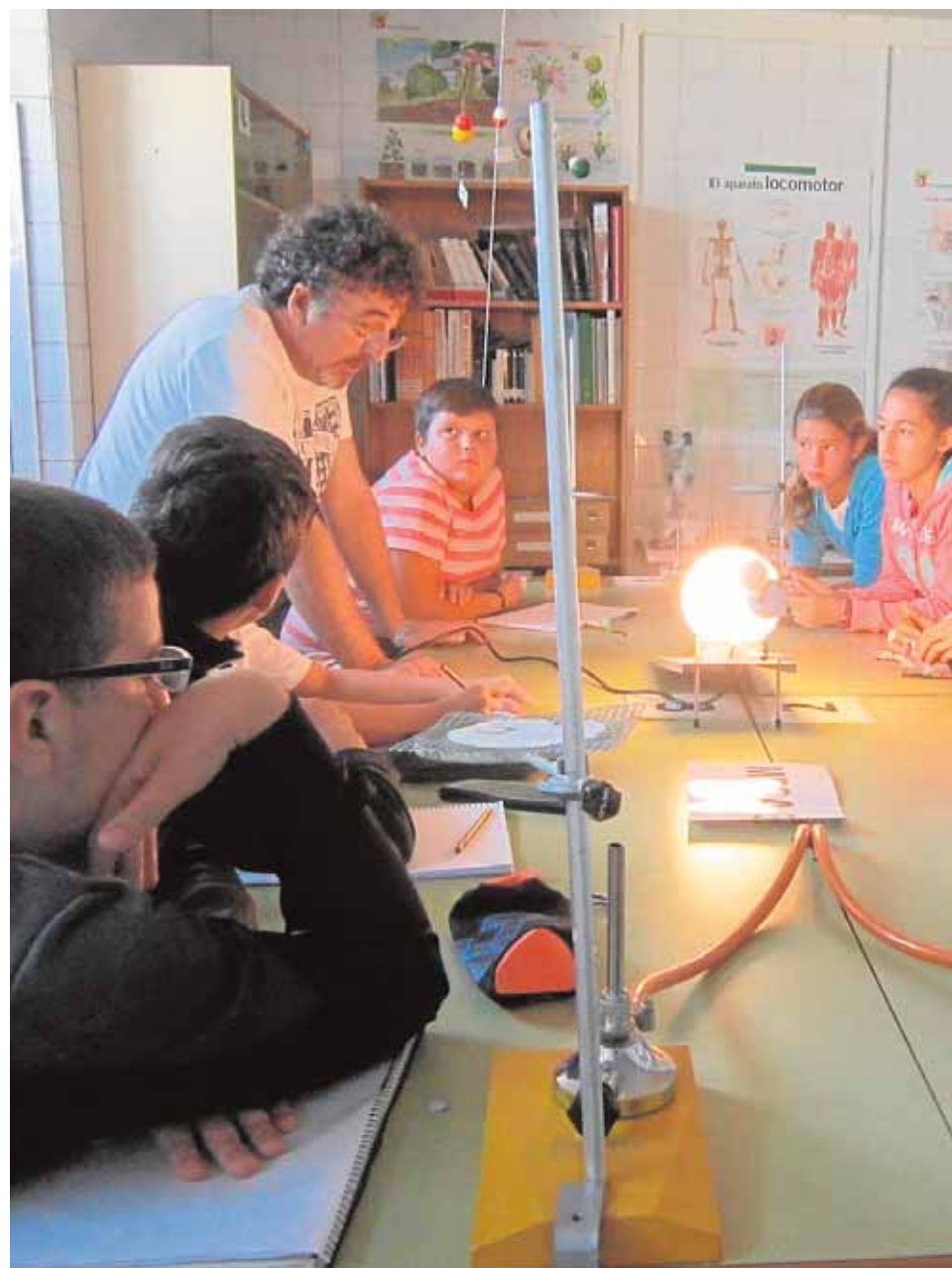
El alumnado forma grupos de trabajo desde Infantil a Secundaria y resuelven misi-

Con este bagaje lejos de estancarse en el colegio siguen conquistando es-