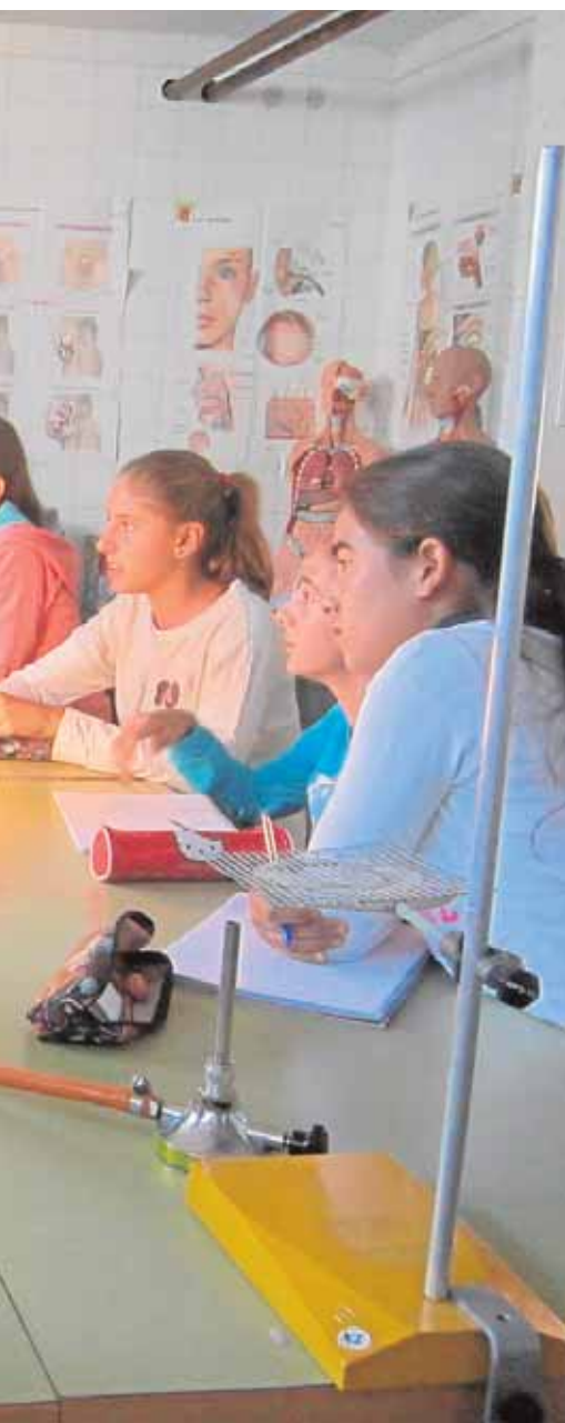
Trabajando con el método científico

especial de vigilancia y control de furgonetas y camiones del lunes al domingo de la semana que viene. Con motivo de esta campaña se realizarán inspecciones sobre los vehículos y sobre los conductores de los mismos. A.C.