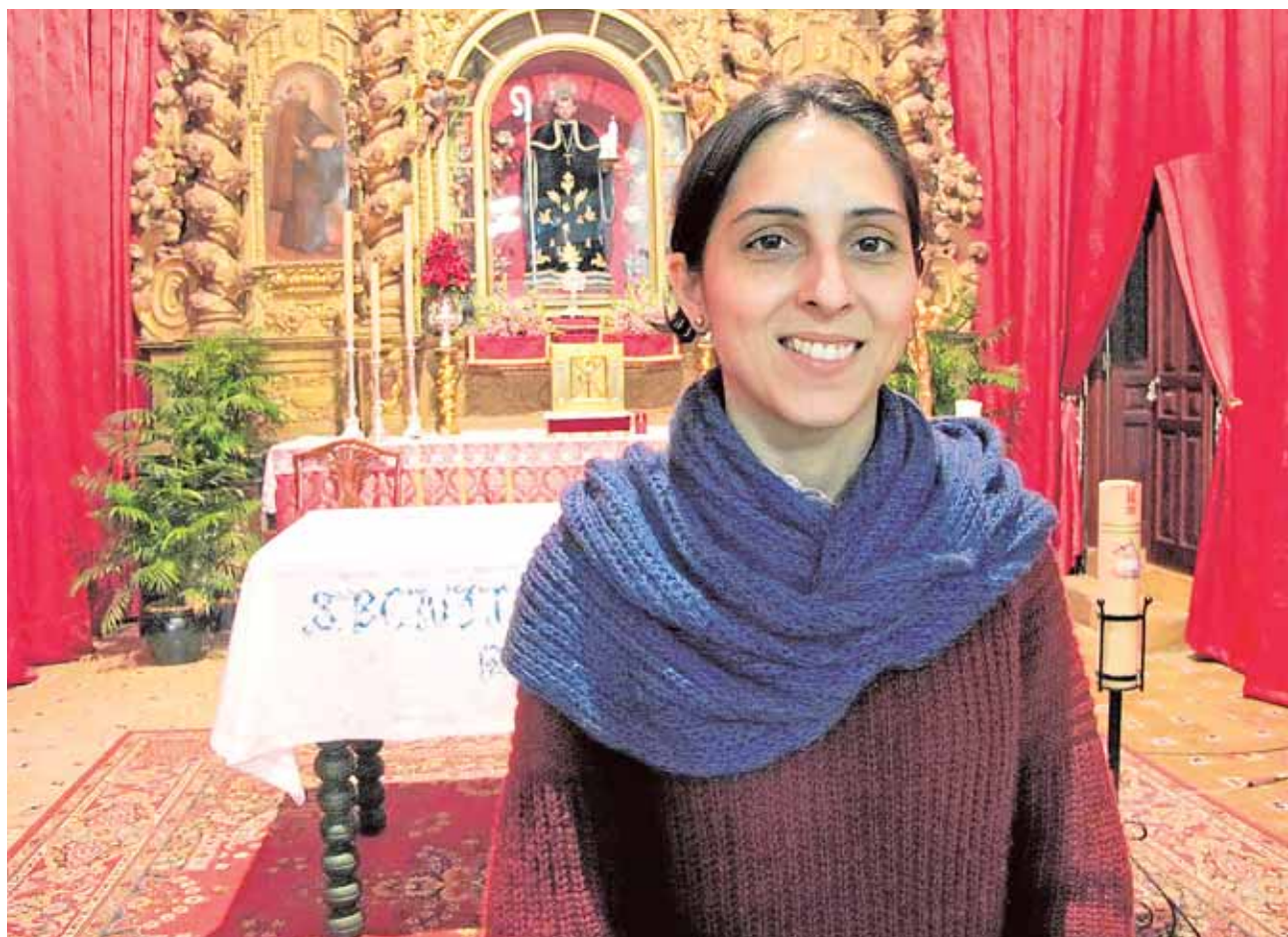
La nueva hermana mayor de San Benito Abad espera recuperar el culto al patrón de Lebrija

Pavón Jiménez impartirá la conferencia titulada «La actividad física como terapia». La actividad es fruto de la colaboración entre el centro de salud y el Ayuntamiento, y espera despejar dudas sobre las patologías del corazón. A.H.