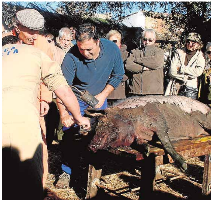
El despiece de un cerdo durante la pasada edición

Además, al igual que en la pasada edición se celebrará el premio Dehesas El Real de la Jara.