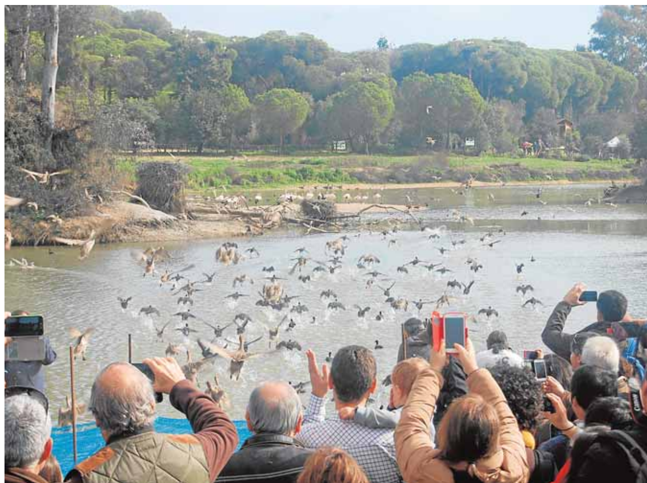
Suelta de aves, con motivo del Día Internacional de los Humedales, que se celebra en febrero

La visita a la Cañada, que puede ser libre o guiada, es una oportunidad para descubrir el incalculable valor de los humedales y la biodiversidad de la avifauna relacionada con estos ecosistemas vitales para la Tierra, cuyos máximos exponentes al sur de la península encontramos en la Doñana que se extiende por las marismas del Guadalquivir, en la provincia de Sevilla.