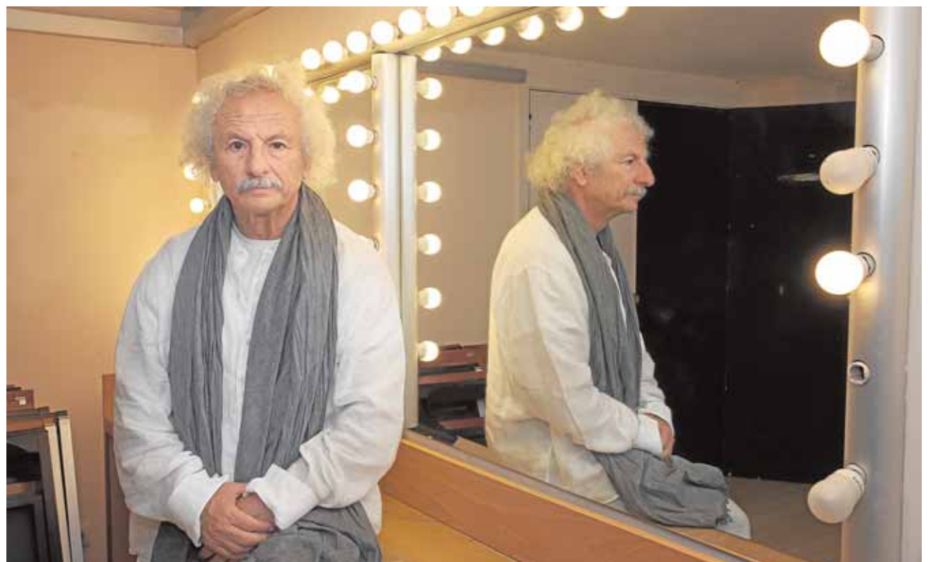
El célebre actor y dramaturgo cordobés llega a Écija con «Mujeres de Shakespeare»

En Escuela de Espectadores se estudiará cada uno de los trabajos por separado, se asistirá a la función y se organizará un encuentro personal con los protagonistas, en el que se analizarán críticamente la dramaturgia, interpretación, luz, sonido, etc., así como las tres propuestas en su conjunto. Para formar parte del Club del Espectador hay que inscribirse y adquirir el abono por un precio de 12 euros.