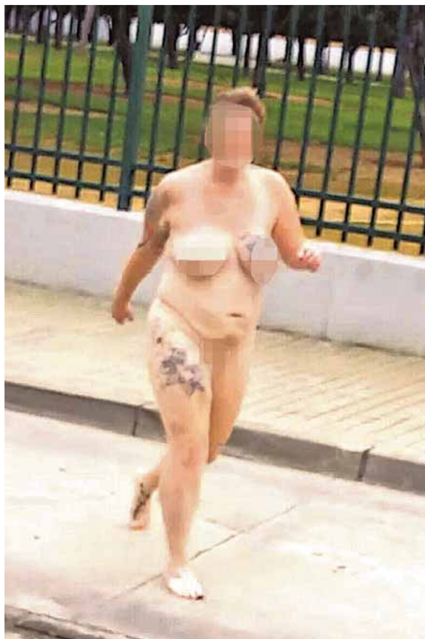
Muchos paseantes de Utrera se encontraron con la norteamericana

La Policía Local de Utrera y la Guardia Civil localizan a la norteamericana, a la que tratan de tranquilizar y llevar a su casa para que se vistiera. Al llegar al domicilio, ubicado en la calle Antonio de la Barreda, en la barriada del Naranjal de Castillo, una zona residencial a las afueras con muy pocos