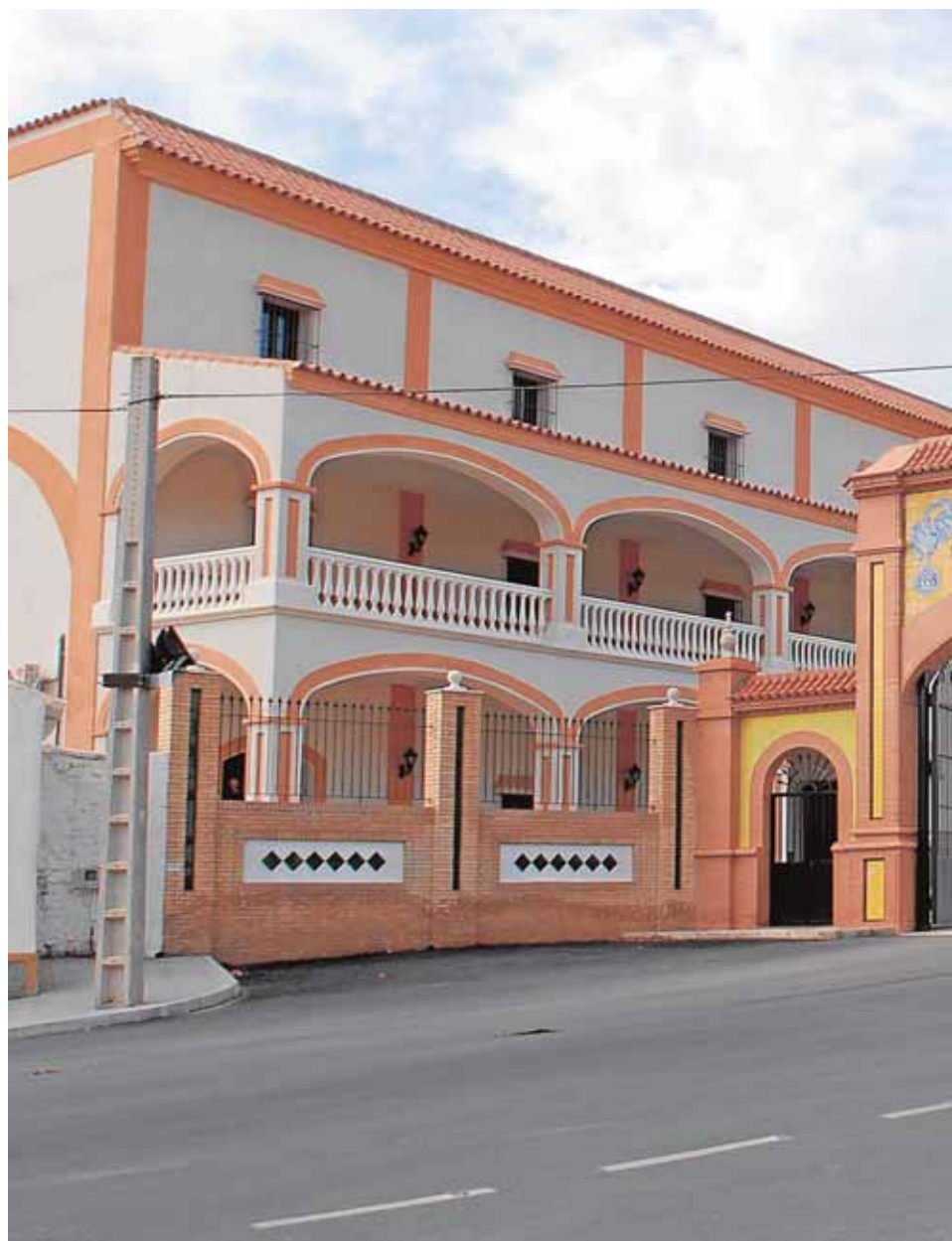
La cooperativa de Lora de Estepa, Olivarera San José, ha conseguido siete primeros

Un referente provincial Oleoestepa suma trece años consecutivos consiguiendo el primer galardón de Diputación