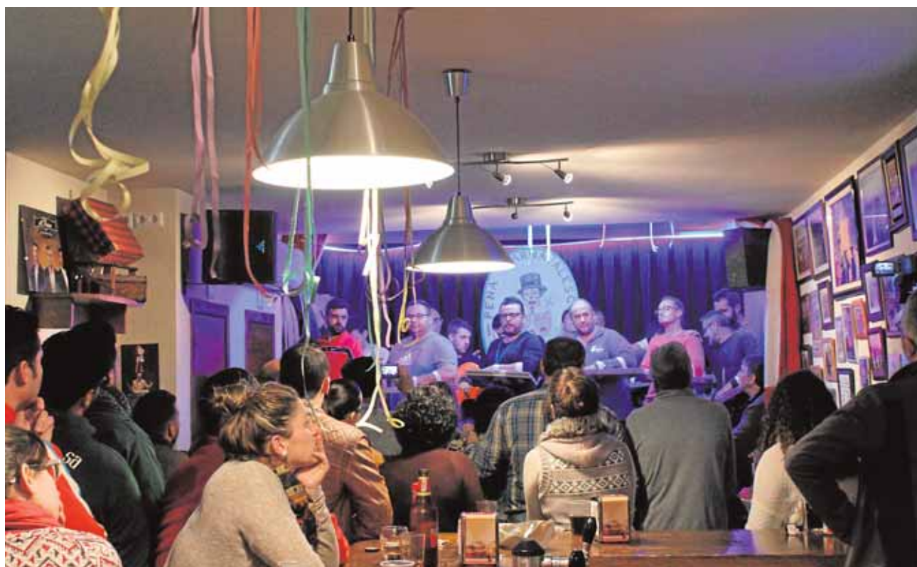
Una comparsa actuando en la peña moronense de El Siguerín

últimos años, el Parque del Príncipe, a un nuevo emplazamiento. A partir de ahora, será la Plaza del Ayuntamiento la que acoga esta actividad, por ser más céntrica. Así, los arcos del Ayuntamiento tendrán los puestos desde la mañana del 14.