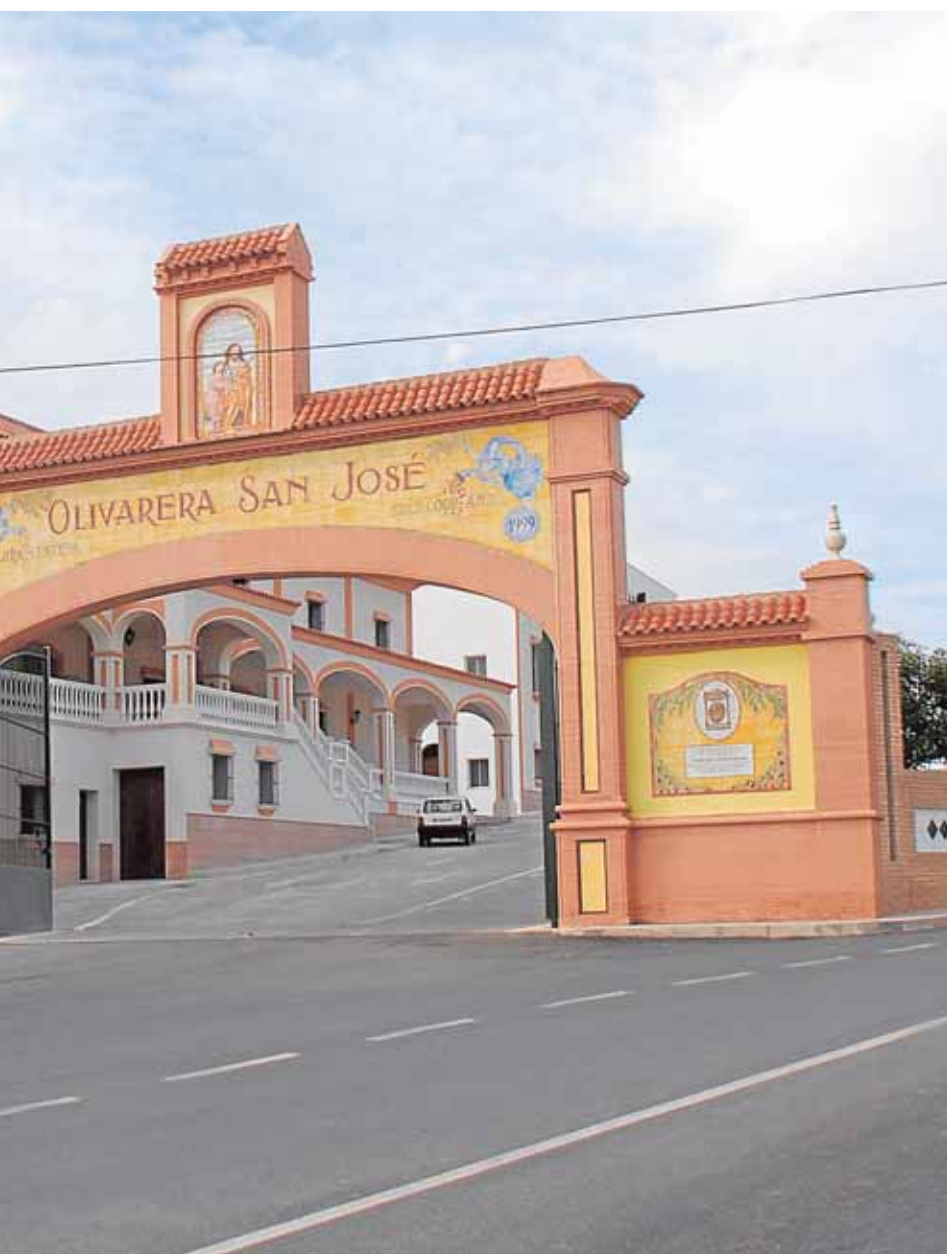
s premios y dos accésit en el certamen de la Diputación de Sevilla

su pueblo. De las once propuestas de diseños presentadas por los propios pedrereños han pasado a la fase final dos de las banderas. El Ayuntamiento establecerá un proceso de puntuación que será el que decida el símbolo definitivo para el pueblo. B.M.