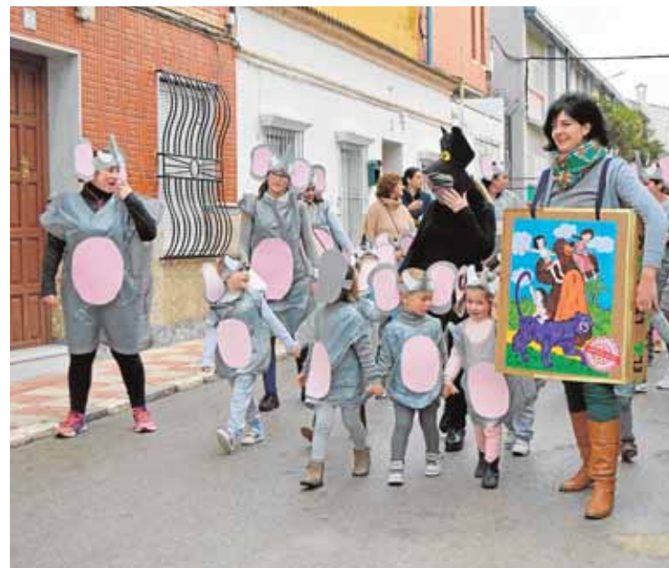
Los alumnos del Tartessos disfrazados de El libro de la selva