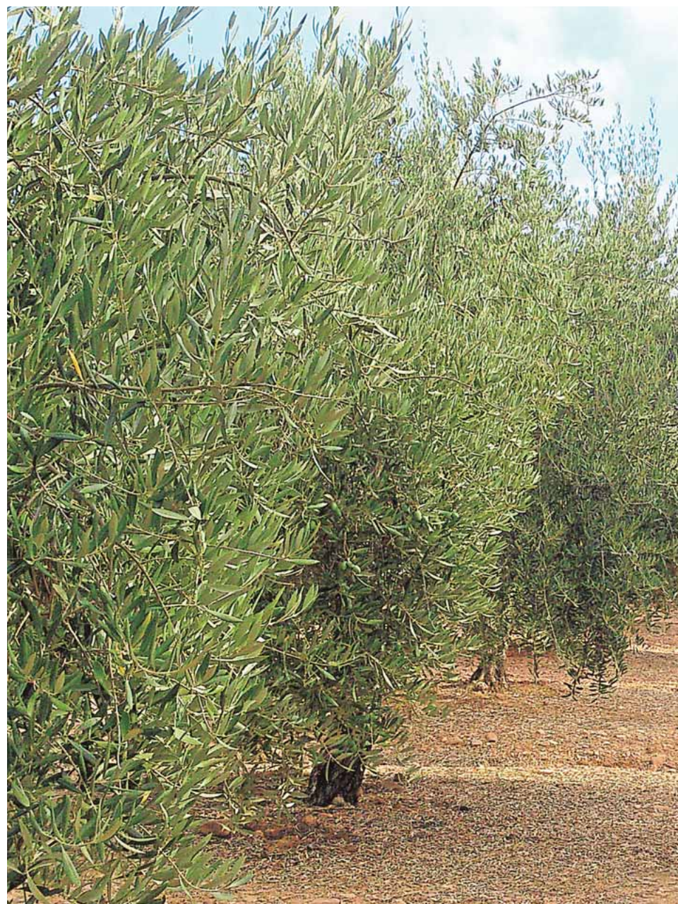
Los agricultores de Fuentes quieren competir en el sector del aceite gracias al sistema

La comunidad de regantes se propone facilitar la integración de los jóvenes agricultores y que se produzca el necesario relevo generacional. Miguel Fernández señala en este sentido que la siembra del cultivo de secano es inviable para los más jóvenes, ya