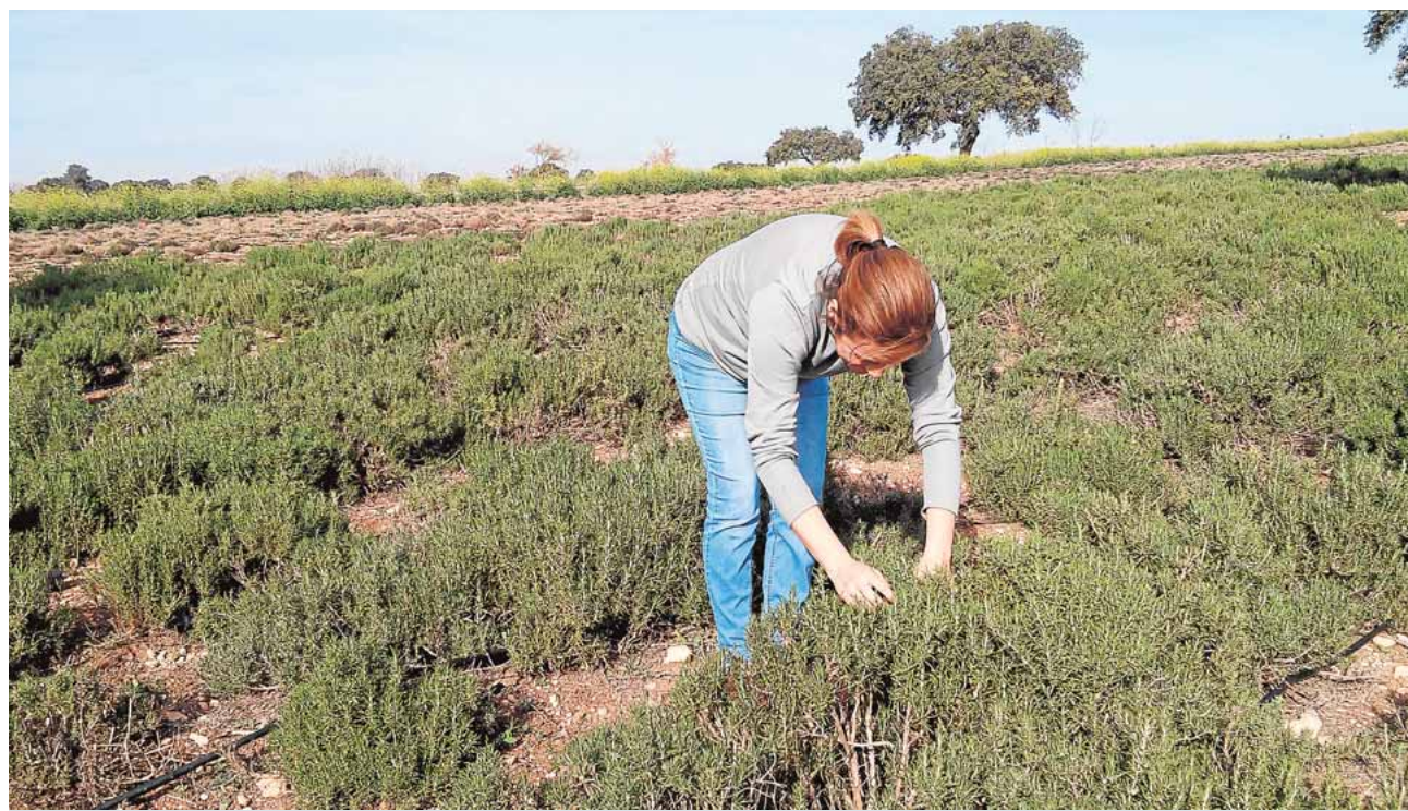
Los esquejes que se cortan de las hierbas se plantan en el vivero municipal para aumentar la producción. B.M.

nizado la primera edición del festival «Riñonera Rock», que reunirá en este primer año ocho bandas rockeras en la Sala BCN Estepa. Los conciertos comenzarán a las 22 horas con los grupos Jesse Shield, Cristina Ybarra y Eladio (Alamanta). B.M.