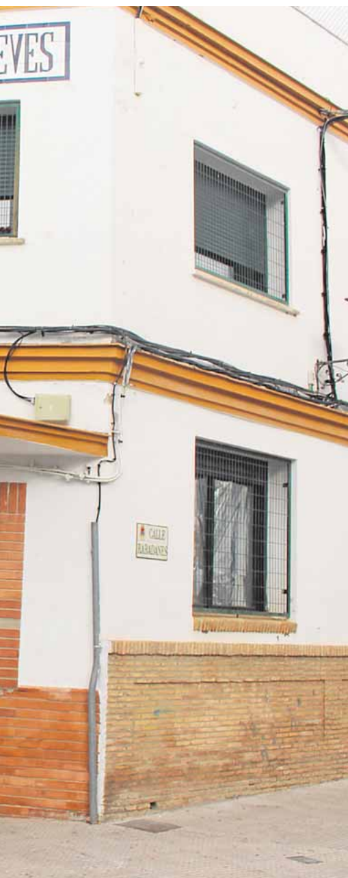
resto de la junta directiva

en el teatro El Molino la VII Noche Flamenca. A las 22.00 horas de mañana viernes, en la sala The Hole, se celebra el festival XII Independencia Rock. Y a las 12.00 horas del lunes 21 se llevará a cabo una sesión extraordinaria del pleno municipal. A.H.