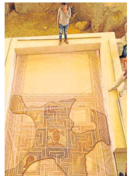
Imagen de una de las lonas ABC

Esta iniciativa ha sido financiada por los fondos del Plan Supera, a través de los cuales también se han recuperado los basamentos de los mosaicos y se ha llevado a cabo la reconstrucción de los muros perimetrales que los circundan y protegen. Con ello, ambos emplazamientos quedarían listos para volver a integrar las piezas cuando salgan del taller de restauración.