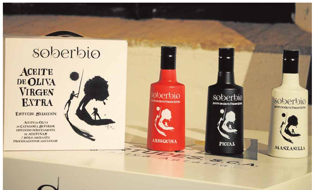
La nueva línea de aceites de «Nuestra Señora de las Virtudes»

Actualmente se compone de casi dos mil socios, y sus negocios incluso la han llevado a abrir una filial en Miami, en los Estados Unidos, bajo el nombre de «N. S. V. Manufacturing Company, Inc.», en el año 2005.