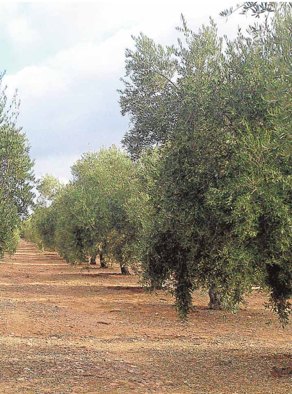
Forma de regadío que solicitan a la Confederación Hidrográfica del Guadalquivir

berán inscribirse en las dependencias consistoriales durante estos días. Para realizar la inscripción es imprescindible la autorización firmada por el padre o la madre del menor. Asimismo, deberán indicar cuál será su vestimenta para la cabalgata.