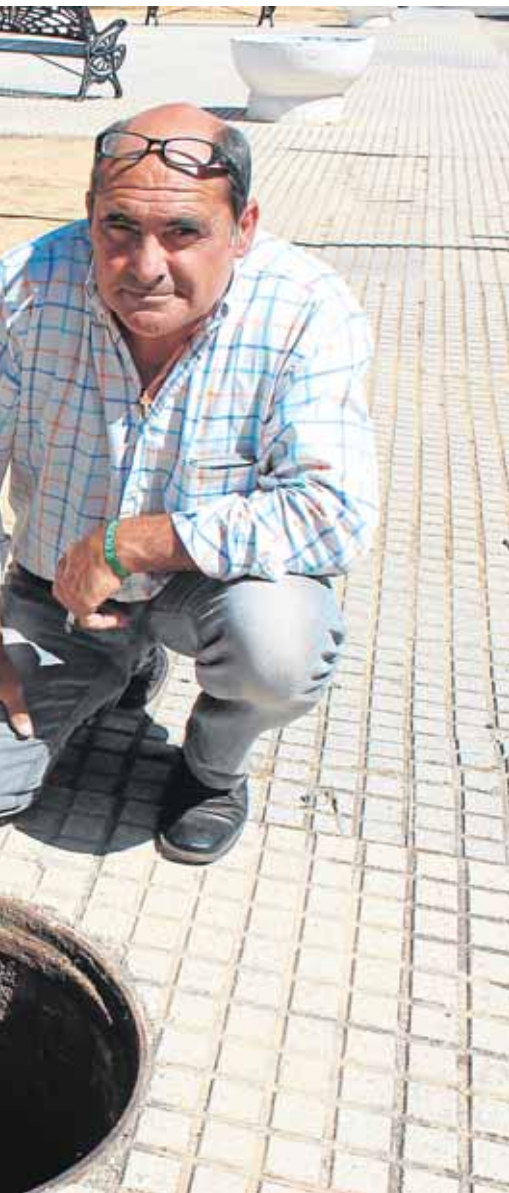
instalado en una arquetas de El Priorato L.R.I.

cipio. La población diana la constituyen las familias con menores a su cargo que carecen de recursos económicos suficientes para atender las necesidades básicas de los y las menores a su cargo, especialmente las educativas.