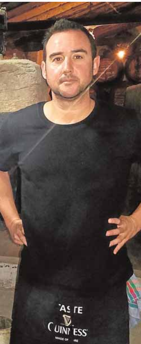
aria de Sanlúcar la Mayor D.C.

Miss World Sevilla celebrada en el Hotel Barceló Renacimiento hace unos días. El Concurso Miss World Sevilla es el certamen de belleza y moda más importante de Andalucía y antesala del certamen nacional de Miss Word España.