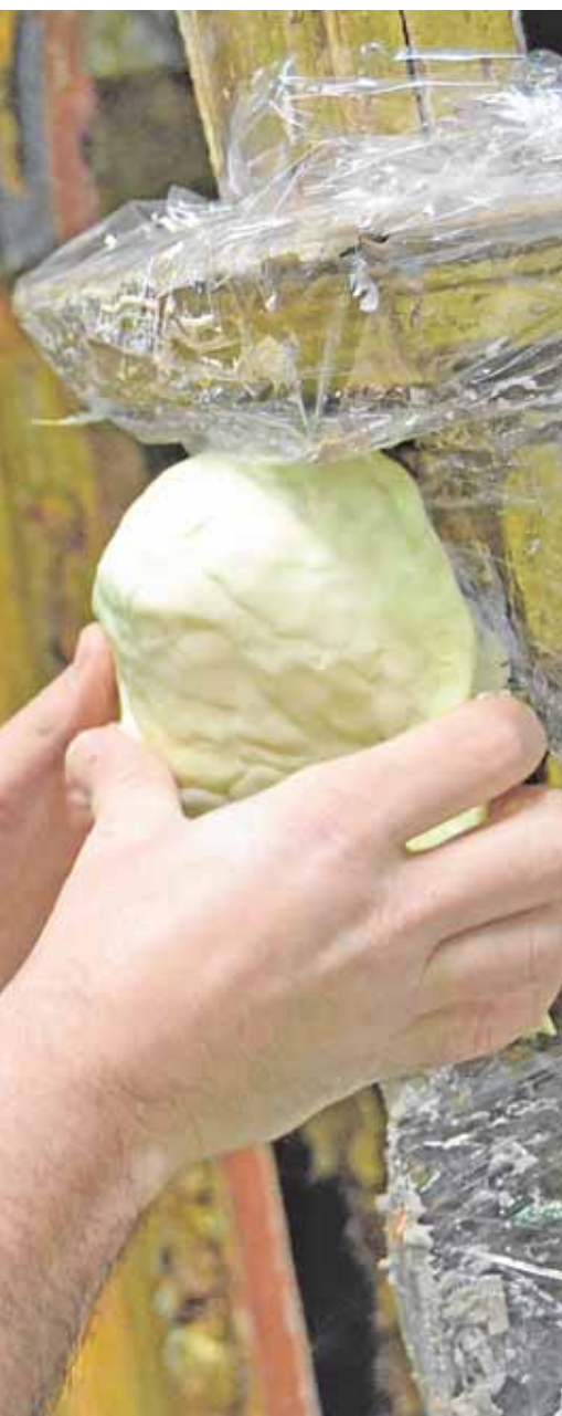
al retablo del Rosario de Castilblanco J.C.R.

más de diez actividades dirigidas a los jóvenes del municipio. Entre ellas destacan una exposición de cómics, una sesión de cine, una jornada literaria, juegos deportivos y acuáticos con un tobogán urbano de 100 metros o una tarde de zumba. G.J.L.