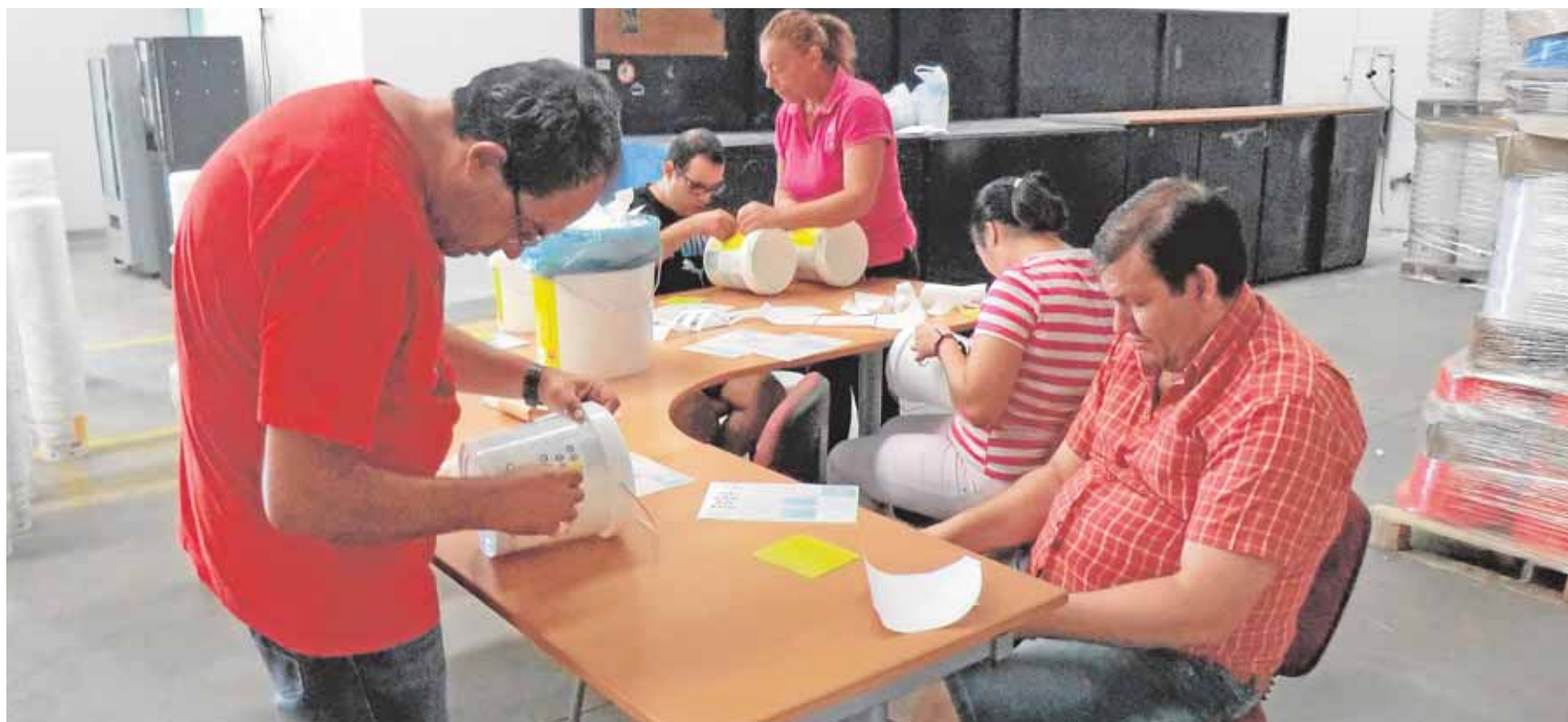
Los chicos de Avain tienen asignado su propio espacio para el etiquetado y envase de los recipientes

el Open de Andalucía, celebrado en Málaga. Estos cuatro nuevos metales, que habría que sumar a los éxitos del pasado campeonato de España, se completan con el galardón a la «Mejor Marca Territorial», conseguido en la prueba de 200 estilos.