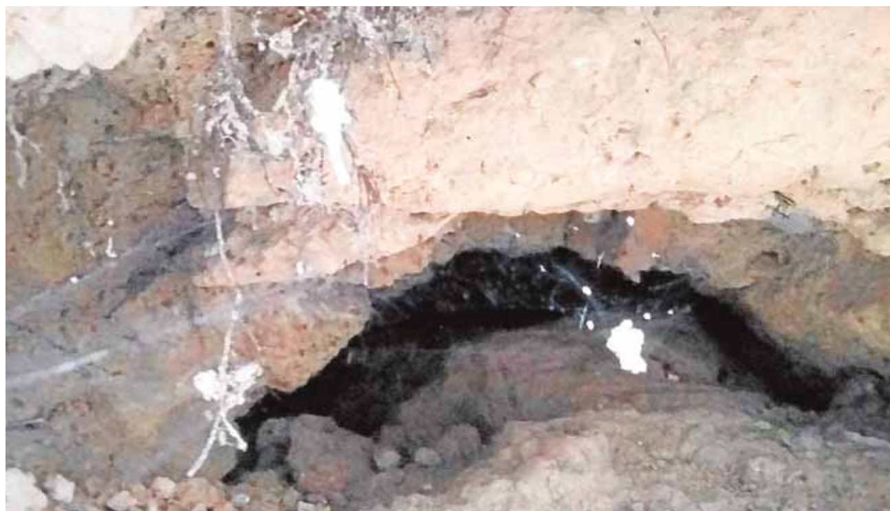
El yacimiento ha sido expoliado por dos puntos diferentes que han provocado derrumbes en el interior