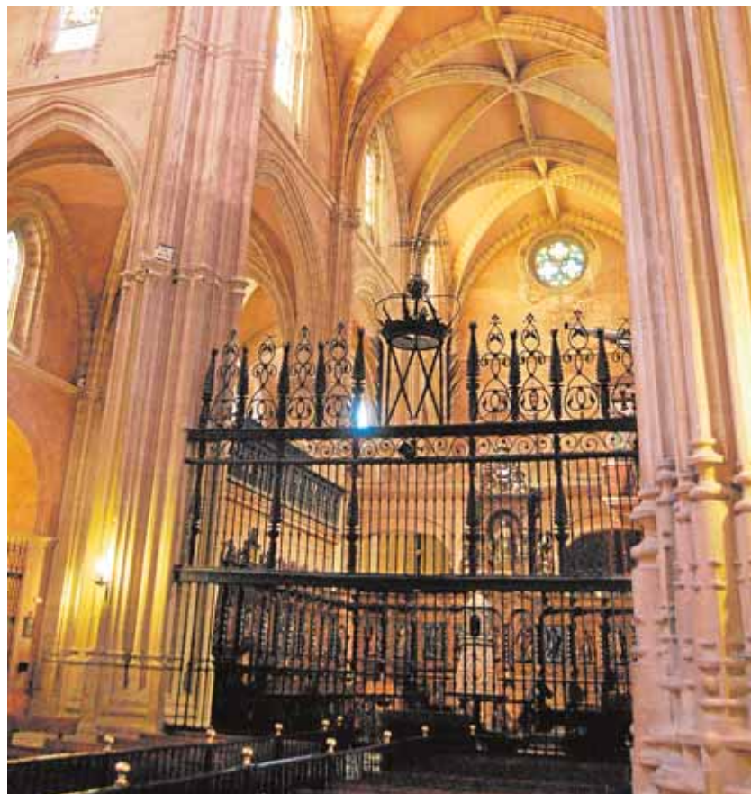
El interior del templo se encuadra en el «gótico catedralicio sevillano» A.M.

El estudio apunta a que ese lugar, entre los siglos III y VII, bien podría ser el asentamiento de Santa María. Si bien aún falta la confirmación arqueológica. Lo que sí está claro es que la mezquita aljama carmonense se levantó en el mismo solar que hoy ocupa la iglesia. Se ha buscado definir la planta concreta pero no ha sido posible ni con los resultados objetivos de una excavación