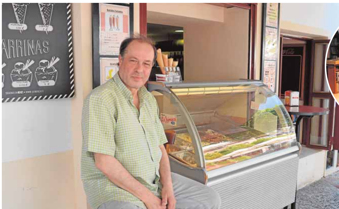
Este heladero utrerano comenzó coleccionando tebeos y, hoy en día tiene en su casa «El Rincón del Coleccionismo»