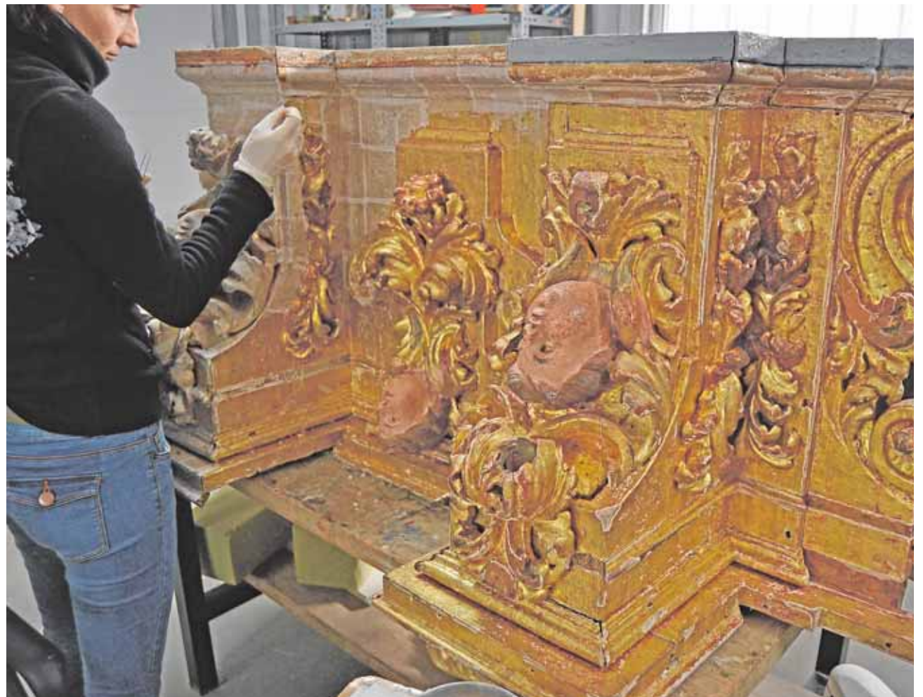
La restauradora trabajando en una de las piezas del retablo castilblanqueño felizmente salvado