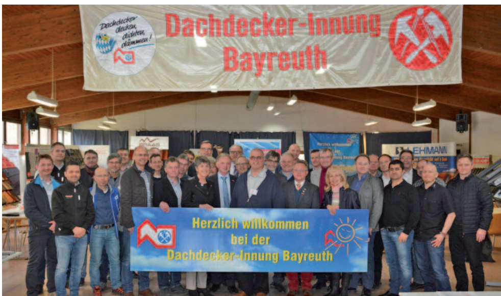
Zum 15. Mal erfolgreich vorbereitet und durchgeführt: die Bayreuther Dachmesse der Dachdecker-Innung.

Nach der Messe ist vor der Messe. Bereits jetzt haben die Organisatoren die Planungen für die Dachmesse 2018 begonnen, um diese Bayreuther Veranstaltung noch attraktiver zu machen. Man darf gespannt sein auf die nächste Dachmesse im Frühjahr 2018 mit zahlreichen Erweiterungen und Neuerungen.