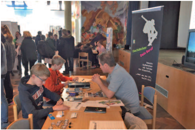
Erfolgreiche Beratung bei der Berufsmesse Ismaning war der „Grundstein“ für die Praktika-Vermittlung.

cker-Beruf. In sehr guten Gesprächen konnten mehrere Praktika vermittelt werden.