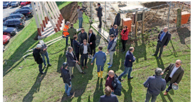
Spannender Countdown bis zum symbolischen Spatenstich für das neue Wohnheim.