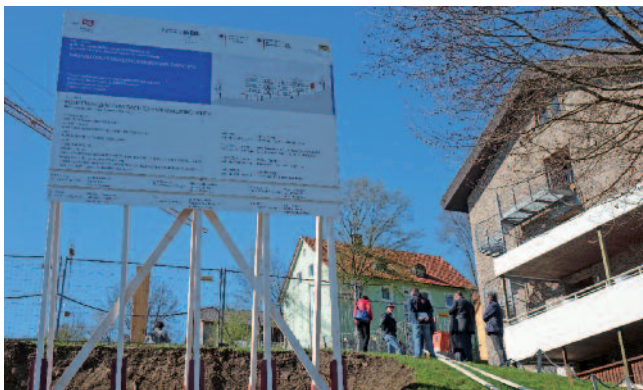
Nur wenige Meter neben dem bestehenden Wohnheim weist die Bautafel auf das neue Projekt hin.