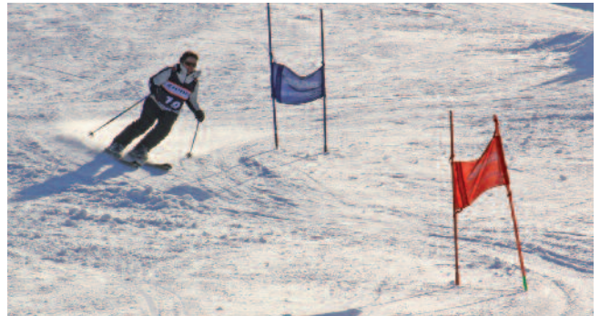
Frauen-Power auf der Piste. Auch die Damen schenken sich nichts beim 12. Ski&SnowboardCup.