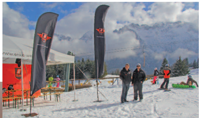
Außer dem Dachdecker-Einkauf Süd gingen alle Sponsoren - von Enke über Velux bis Klöber - mit Aktiven an den Start.