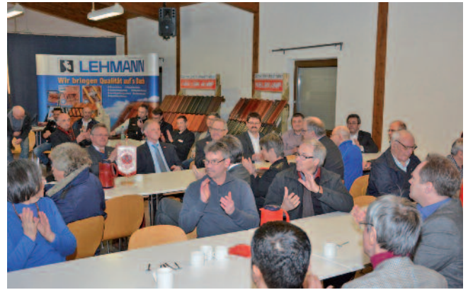
Gut besucht und hochgelobt: die Fachvorträge der Bayreuther Dachmesse.

Die Aussteller informierten an drei Tagen an ihren Ständen und in den zahlreichen Fachvorträgen über allerlei Wissenswertes rund ums Dach. Experten der Dachdecker-Innung Bayreuth standen den Besuchern für alle Fragen rund um Dach und Fassade ohne Zeitdruck zur Verfügung – ob es um die Däm-