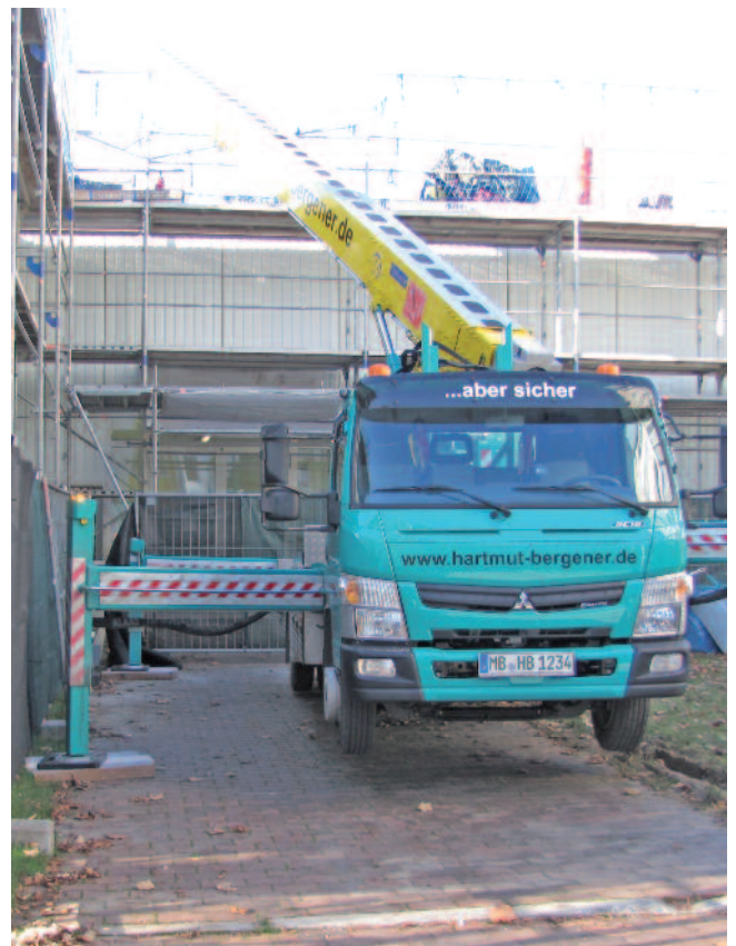
Sicherheit geht vor: Auch wenn die Absperrung für eine halbe Stunde Arbeitseinsatz mal drei Stunden beansprucht.

Die von Bergener und seinem Bauleiter Hinz vorab erstellte Gefährdungsbeurteilung wandert nicht einfach nur zu den Akten, wie es leider oft genug geschieht. Punkt für Punkt wird die Beurteilung mit