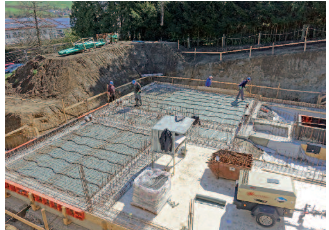
Während der Spatenstich erfolgte, wurde schon die Bodenplatte gegossen.