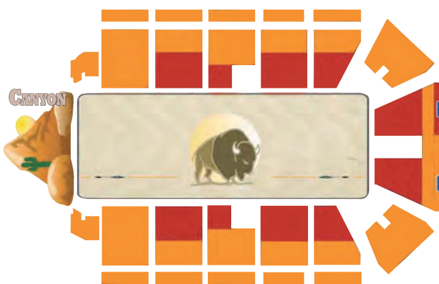
Mapa da arena

Conheça o mundo do Far Oeste com o Buffalo Bill, Sitting Bull, Annie Oakley, verdadeiros cowboys e índios, com a participação especial do Mickey e dos seus amigos. Comece a sua noite uma hora antes do espetáculo com o Xerife Pateta e músicos de country no Colonel Cody's Saloon. Em seguida, marque lugar num dos quatro ranchos e defenda as suas cores durante as provas de habilidade que decorrem na arena. Desfrute de um espetáculo que assenta no puro espírito do velho oeste, enquanto saboreia uma refeição tex-mex servida em prato de latão, como manda a tradição. Prepare-se para viver a era dos pioneiros americanos num ambiente verdadeiramente realista.