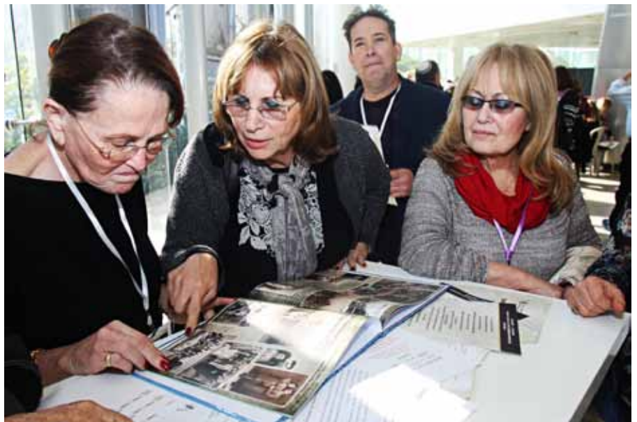
מבקרים בכנס מתבוננים באלבומים