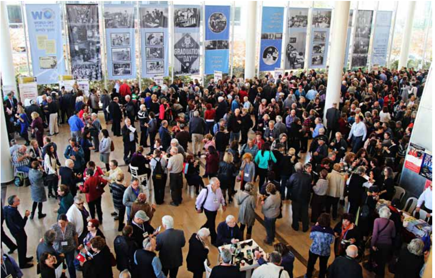
ההתרחשות האמיתית: משתתפי הכנס בלובי

הממוריאליין של העמותה. כתובת האתר: dorot.memorialine.com . ניתן גם לכתוב בעברית: דורות. ממוריאליין. בתוך האתר יש ללחוץ על הקישור קהילות ומתוך רשימת האותיות ללחוץ על האות מ' . נפתחת רשימת מחנות העקורים. מכאן יש ללחוץ על המחנה המבוקש ומשם: צור קשר . ניתן למצוא שם מידע ותמונות על המחנה וגם להוסיף תמונות וסיפורים אישיים. כך יגיעו יוצאי המחנות אלה אל אלה. אגב, האתר ממוריאליין של העמותה הוא אתר הנצחה גם לאנשים שנספו בשואה או לבני משפחותיהם. ניתן להנציח את קורותיהם, לצרף תמונות, ואם מישהו כתב ספר על משפחתו יוכל תמורת סכום לא גדול להופכו לספר דיגיטלי שיופיע באתר. בד בבד עם הקמת האתרים למחנות אנו מתכננים, בהמשך, לקיים כינוס בינלאומי של ילדי וילידי מחנות העקורים. ידוע לנו שרבים מיוצאי מחנות העקורים חיים היום בחו"ל, במיוחד בארצות הברית."