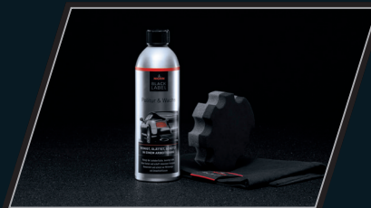
Politur & Wachs Set