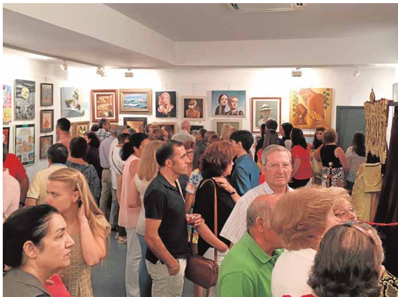
En la exposición colectiva de pintura de Constantina se muestran más de 100 obras cada año.

Sobre esta obra el presidente de la Ascil, José Antonio Filter, ha destacado que es «una interesante monografía», que permite conocer los antecedentes de la industria aguardentera y los motivos de su esplendor y declive, «un proceso histórico hasta ahora mal conocido».