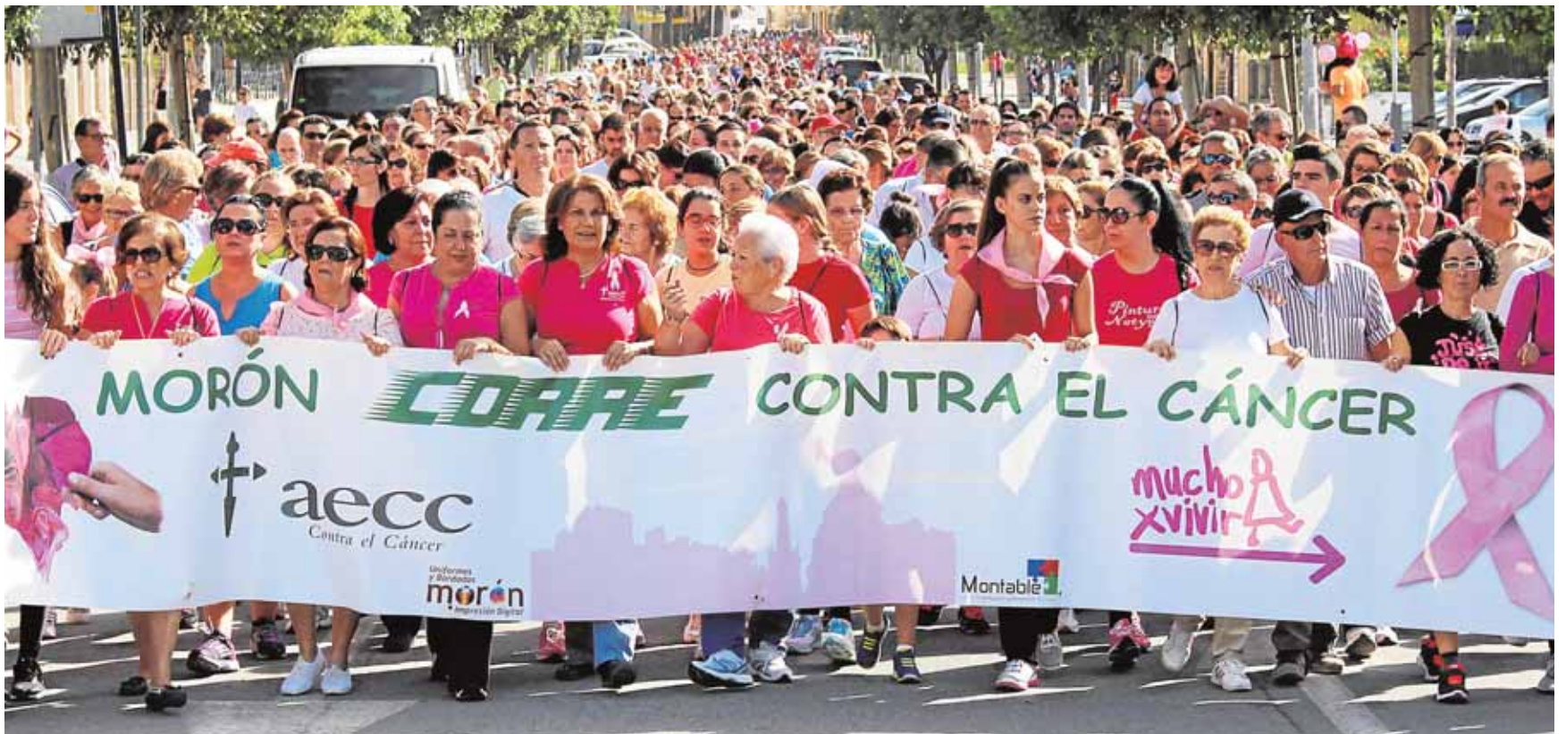
Una gran marea de personas participó en la edición del año pasado celebrada en Morón de la Frontera