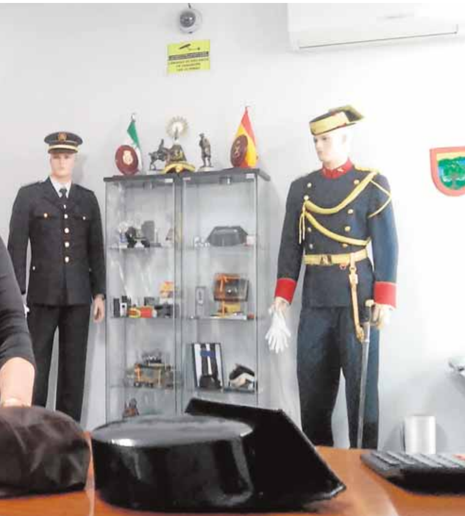
se confeccionan en la fábrica herrereña de Manufacturas Moya

liza esta obra de teatro como homenaje al cuarto centenario de la muerte de William Shakespeare y, a través de algunas de las escenas más representativas de las obras del autor, reunirá a sus personajes más famosos a partir de las 20.30 horas. B.M.