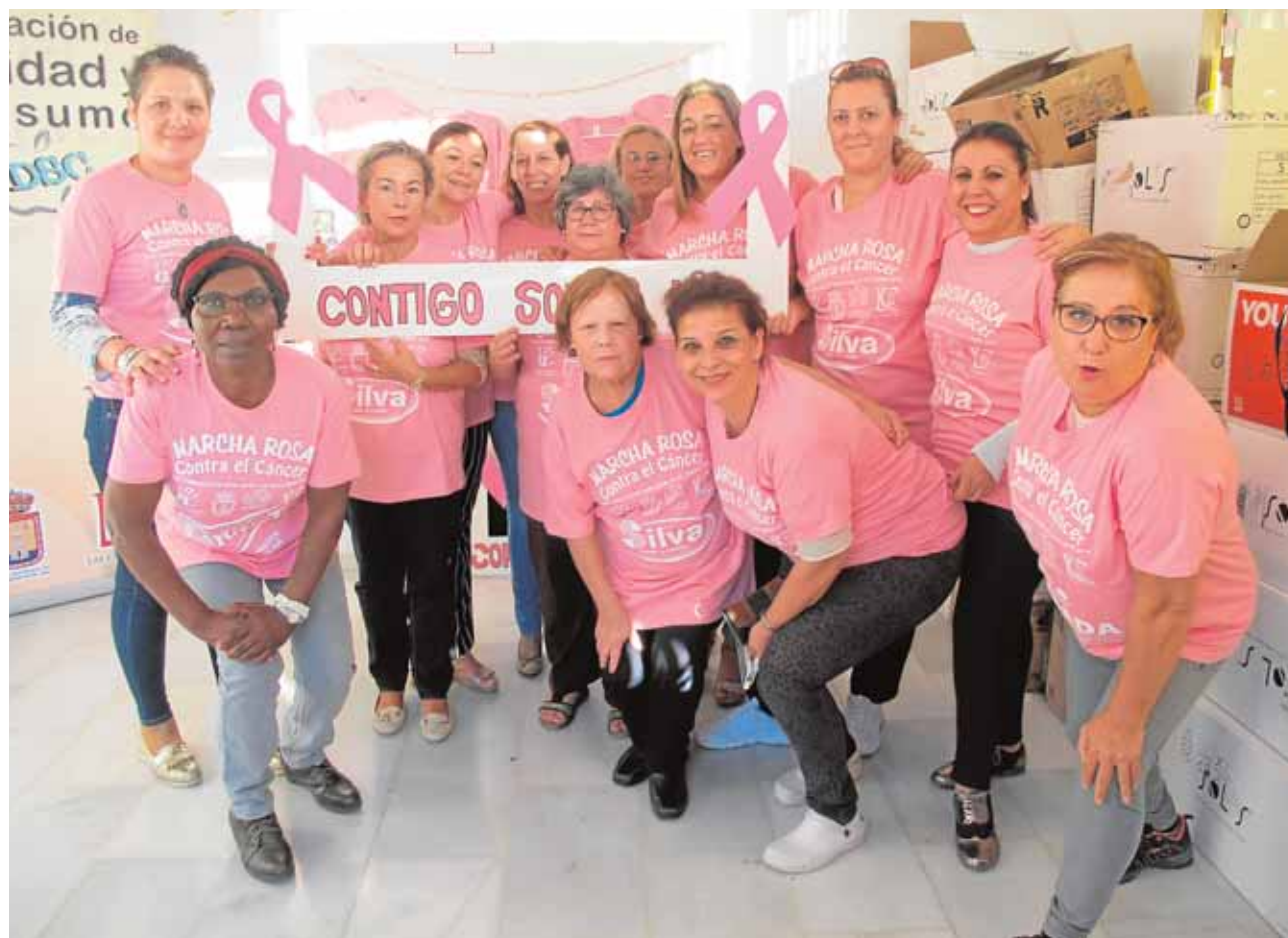
La fuerza de la Asociación Cabeceña contra el Cáncer impulsa una iniciativa que ya conoce el éxito

jos». El taller está dirigido a madres y padres y se llevará a cabo el 26 de octubre y 2 y 9 de noviembre de 10:00 a 11:30 horas en el Centro de la Mujer. Las personas interesadas pueden inscribirse en el Centro de Servicios Sociales. A.H.