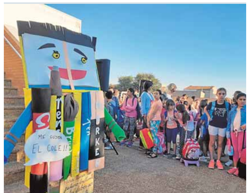
Alumnos durante la presentación de la mascota contra el absentismo