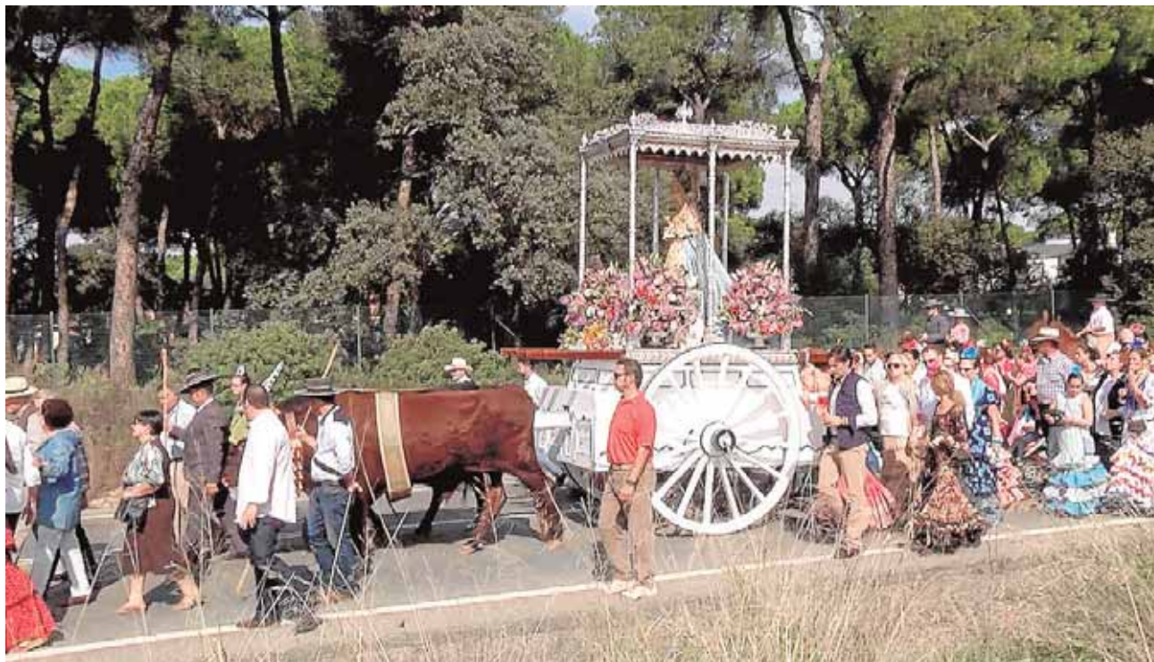
Una de las estampas más populares de la tradicional romería de Cuatrovitas

para jóvenes y desempleados, como para empresarios y emprendedores, para incentivar la búsqueda de trabajo y para potenciar la competitividad digital de las empresas, respectivamente. La primera jornada tendrá lugar el jueves 20 de Octubre.