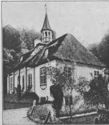
Liselund paa Møen.