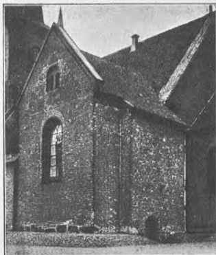
Det søndre Kapel ved Vejle Kirke.