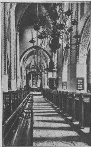
St. Mortens Kirkes Indre.