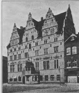
Jens Bangs Stenhus.

„De firkantede Standflasker var prydede med indebrændte Sirater i Guld, Rødt og Blaat, indenfor hvilke Signaturerne fandtes, og Tinbøsser og Sukkerglas vare forsynede med ægte forgyldte Sirater og Signaturer paa løse Skilte. — Over Indgangen er anbragt to Svaner i Sten med forgyldte Halsbaand paa hver sin Side af Kong Christian den Fjerdes Navnetræk med Krone“.