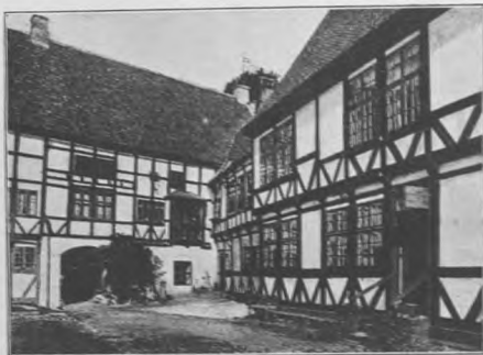
„Aalborghus“. Det gamle Slot i Aalborg.