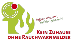
Abbildung S. 15: Fotolia