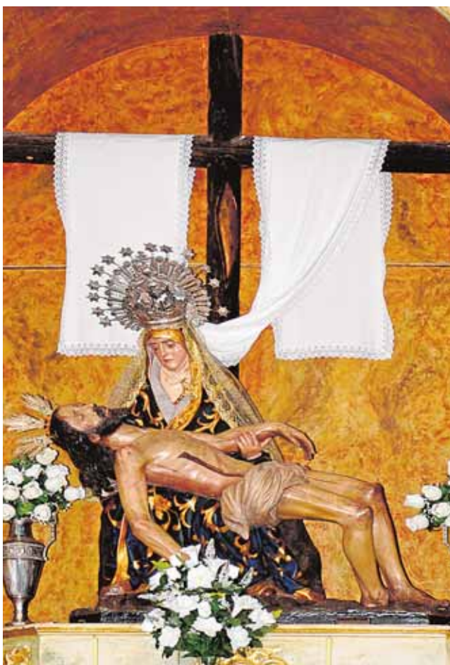
La imagen de la Virgen de las Angustias fue tiroteada en la Guerra Civil y reconstruida en el año 1938