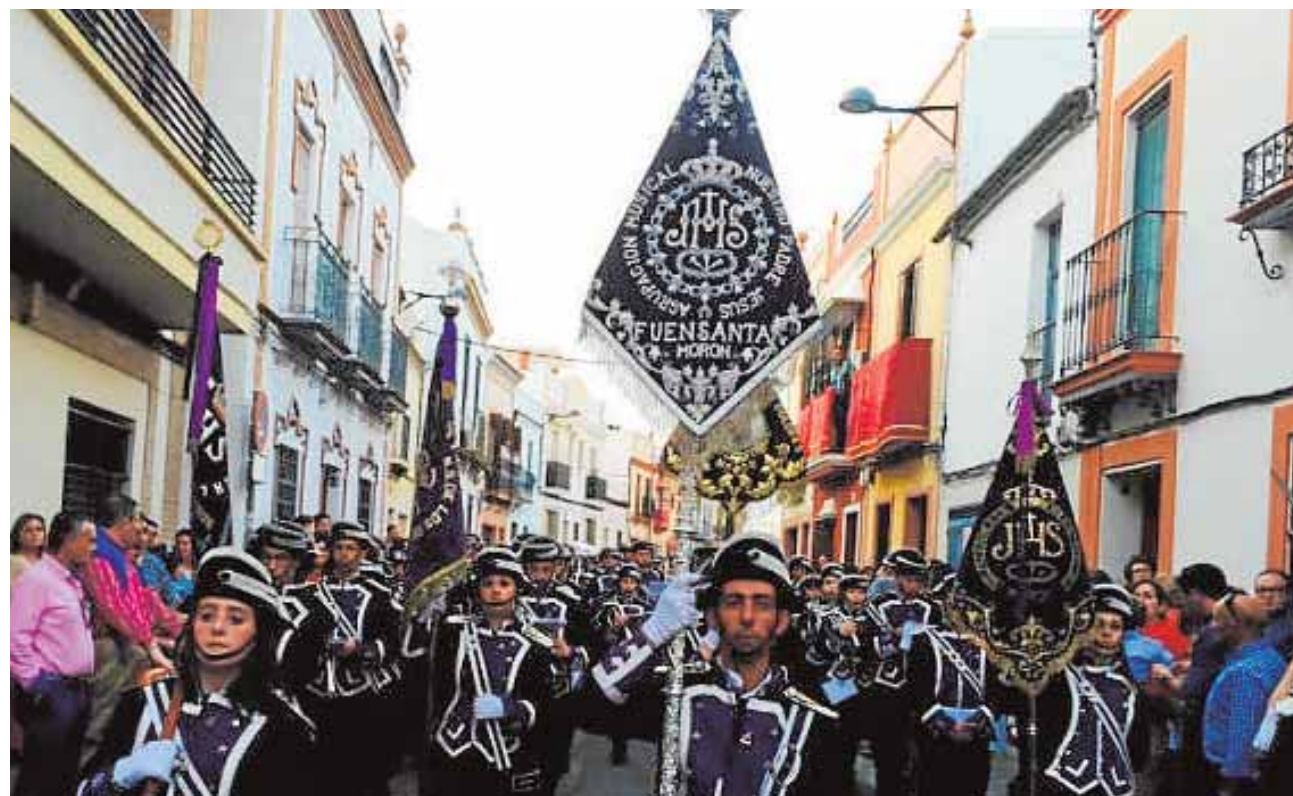
La agrupación musical Fuensanta en una procesión

La banda sigue aceptando componentes (en el 665188120 hay más información) que quieran unirse.