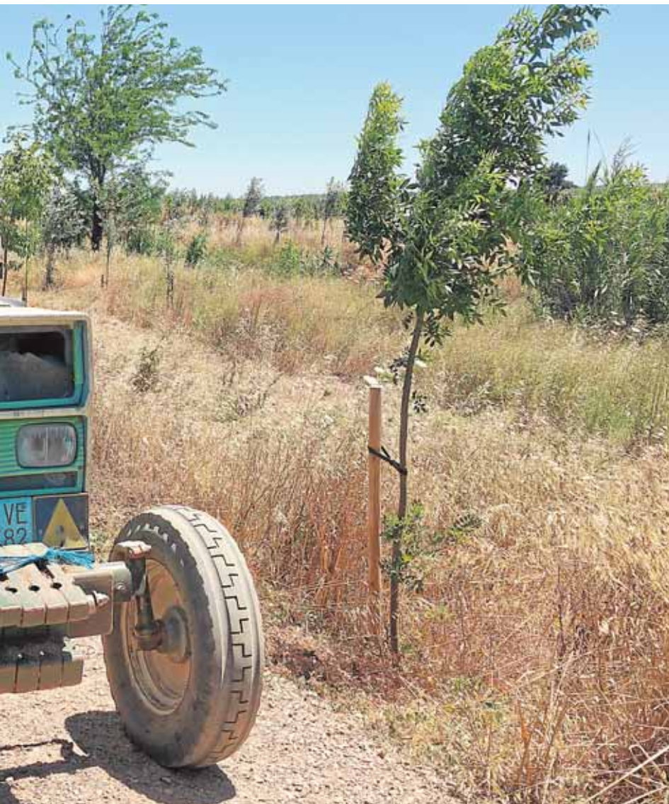
decuación en el término municipal de Salteras

ción, así como la implantación de una capa de albero -después de unos años sin realizarse- y la instalación de un nuevo sistema de microclima, con el fin de dejar todo listo al comienzo de la feria, que tendrá lugar entre el 23 y el 26 de junio.