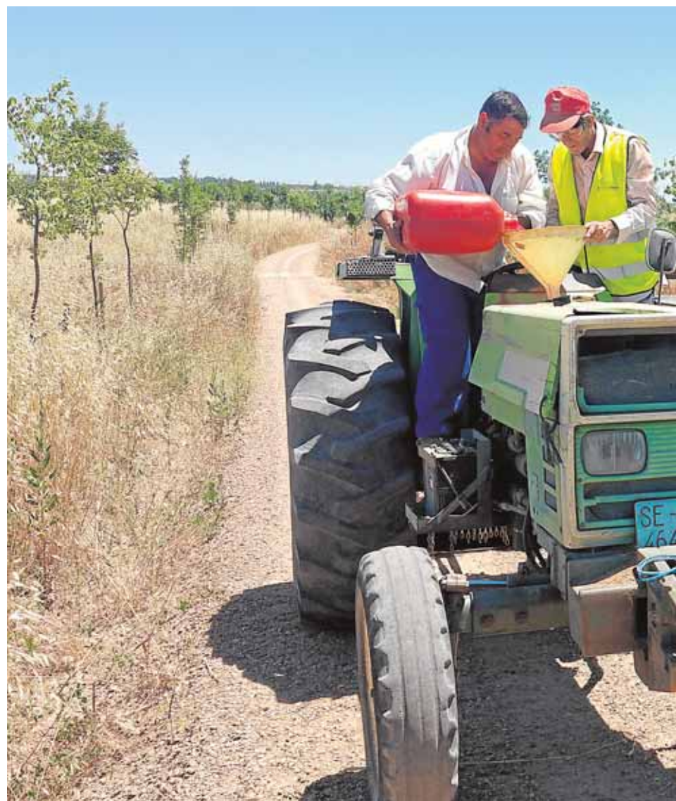
Imagen de una de las zonas del Corredor Verde, donde se han llevado las obras de a