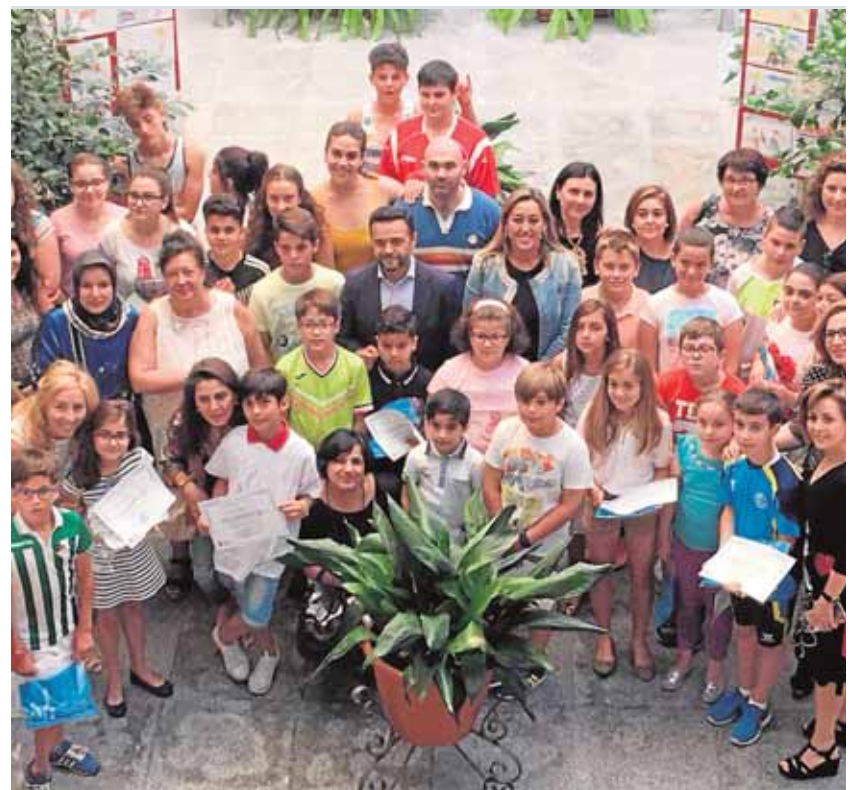
Las autoridades municipales, con los miembros del consejo

Según los datos de 2015 del Instituto de Estadística y Cartografía de Andalucía, de los 16.514 vecinos censados en Las Cabezas de San Juan, 3.910 son menores de 19 años, sumando los niños 1.992 y 1.918 las niñas.