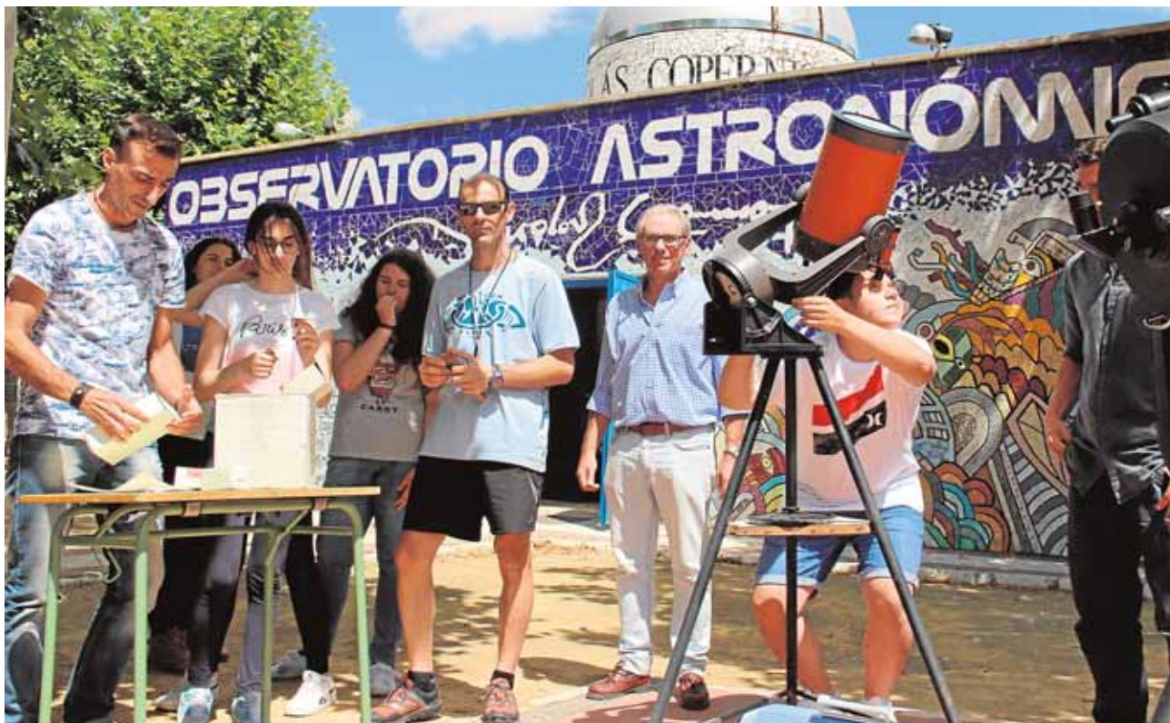
El Observatorio Astronómico abre a colegios, institutos y eventualmente al público en general