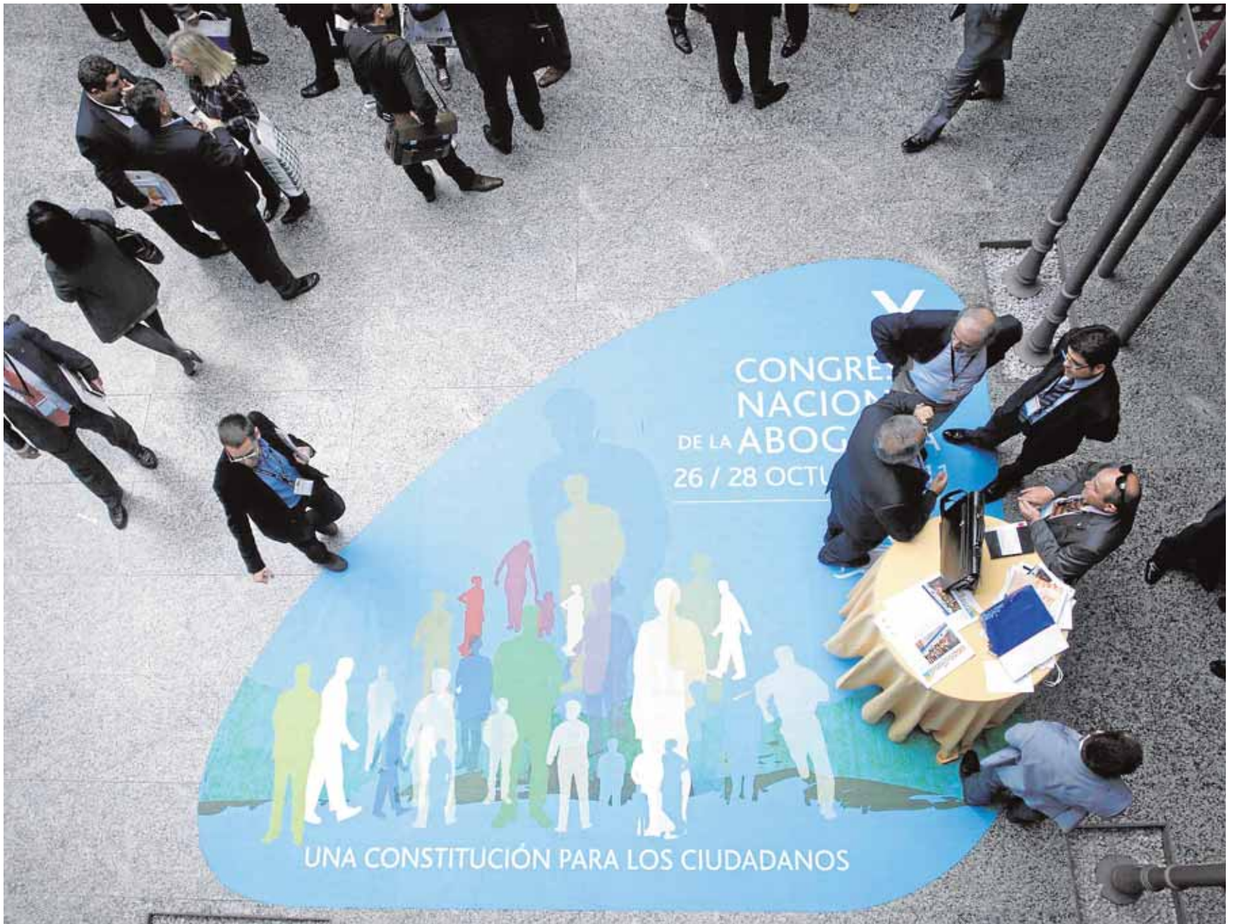
Congreso de abogados celebrado en el Palacio de Congresos de Cádiz. :: LA VOZ