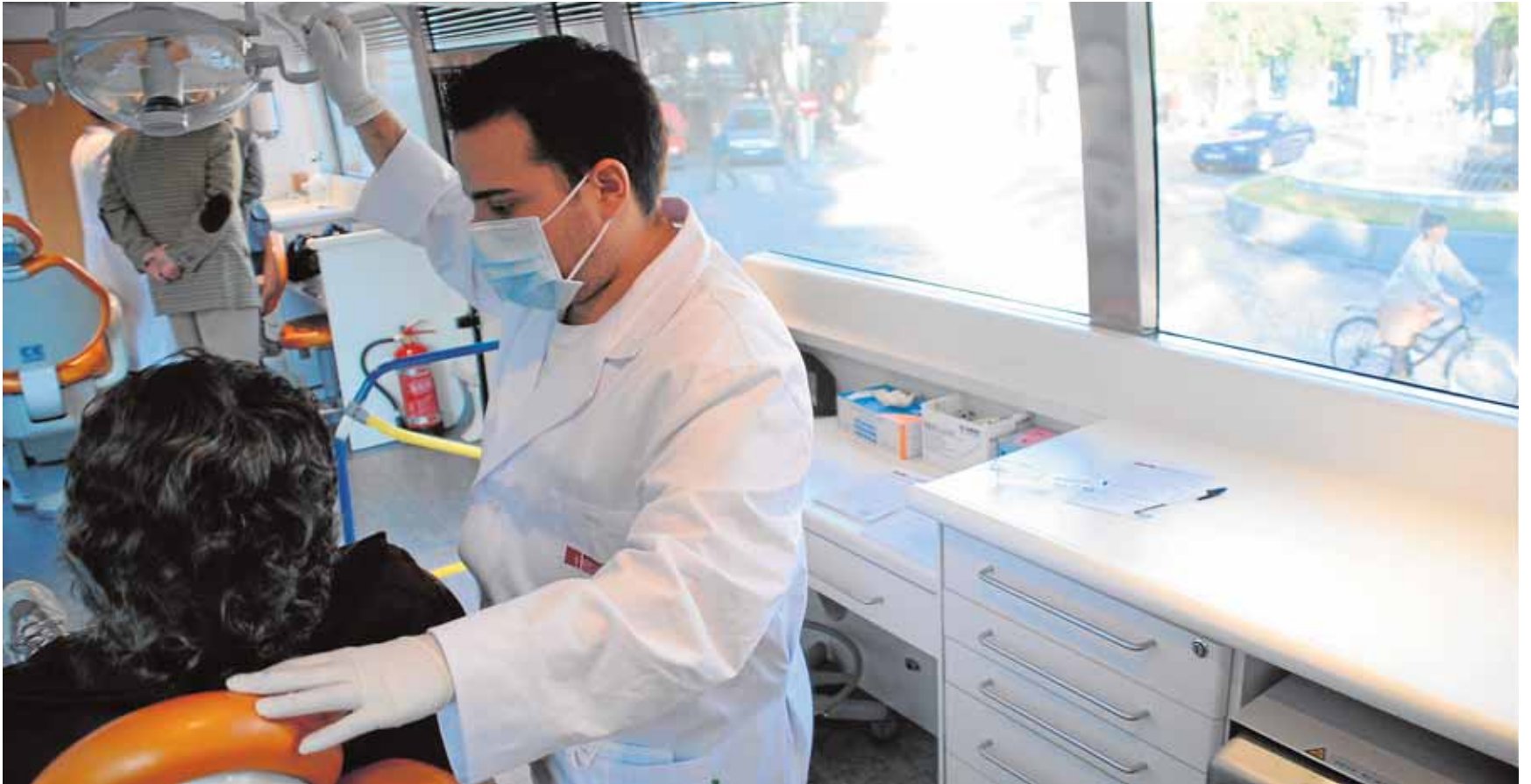
El colegio de dentistas gaditanos alerta de que el 30% de las personas que ejercen esta profesión en Cádiz carece de la titulación exigida. :: LA VOZ