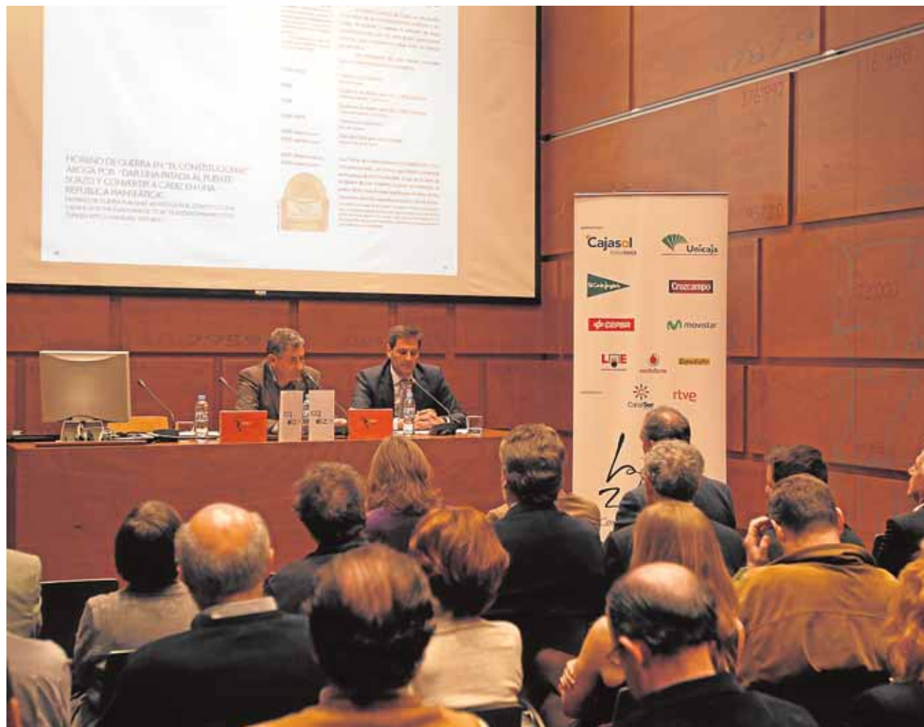
Una conferencia celebrada en el Colegio de Arquitectos de Cádiz. :: LA VOZ

Ofrecen la defensa de los intereses de la profesión y disponen de un código deontológico