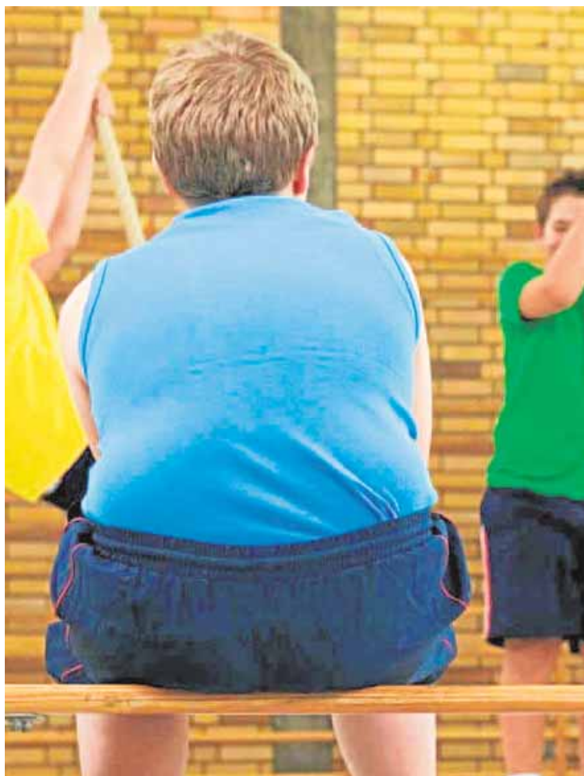
Niño obeso, una enfermedad que trae consecuencias en la edad adulta. ■ L. V.

La obesidad infantil es un importante problema de salud pública que aumenta a nivel mundial. En 1990, la prevalencia global de sobrepeso y obesidad en niños de 0 a 5 años era de 4,2 %, en 2010 de 6,7 % y la Organización Mundial de la Salud