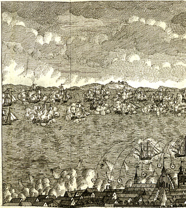
Den engelske Flaades Giennemga 1. Helsingöers Bj, 2. Cronborg Fæstning. 3. Helsingborg 6. Fire Bombardeer Gallioter, der wo