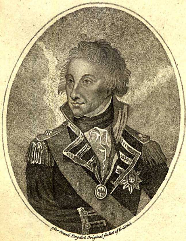
Admiral Lord Nelson.