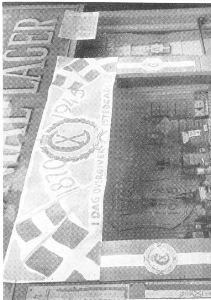
Koloniallager bekender i sin Udsmykning paa Kongens Fødselsdag 1945, at »i Dag overgiver Istedgade sig«.