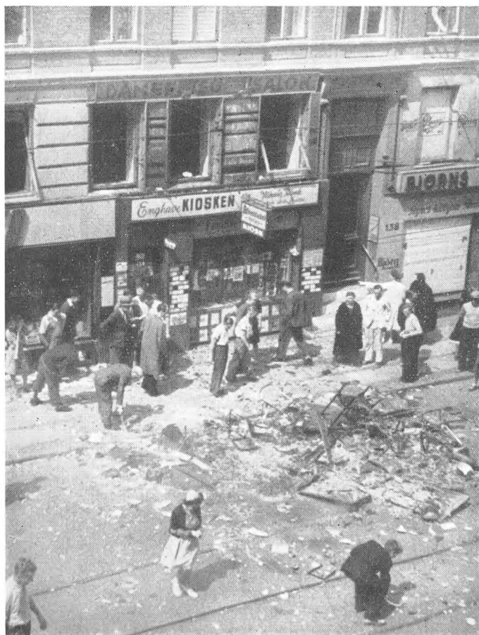
Damefrisørsalonen paa 1. Sal, hvis Indehaverske dyrkede tyske Bekendtskaber, totalt raseret. Stumperne af Indboet kastet ned paa Gaden, hvor det brændes.