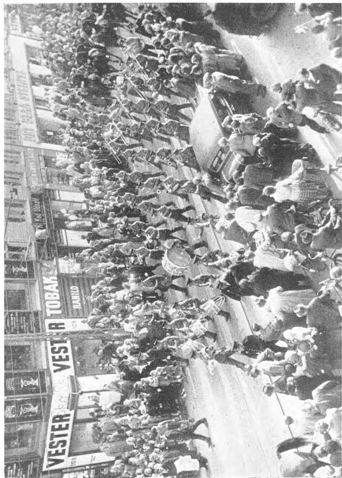
Englænderne hædrede paany Istedgade paa Kongens Fødselsdag den 26. Sept. 1946. Det berømte engelske Regiment »The Buffs«, i hvilket Kongen er Æresoberst, drog gennem Gaden, mens Tambourmajoren svingede sin Stav op i Luften og greb den igen og Trommeslagerne lavede alle mulige Narrestreger med Stikkerne. Paa Billedet ses Musikkorpset, kommende fra Enghave Plads drage forbi Hjørnet af Valdemarsgade.