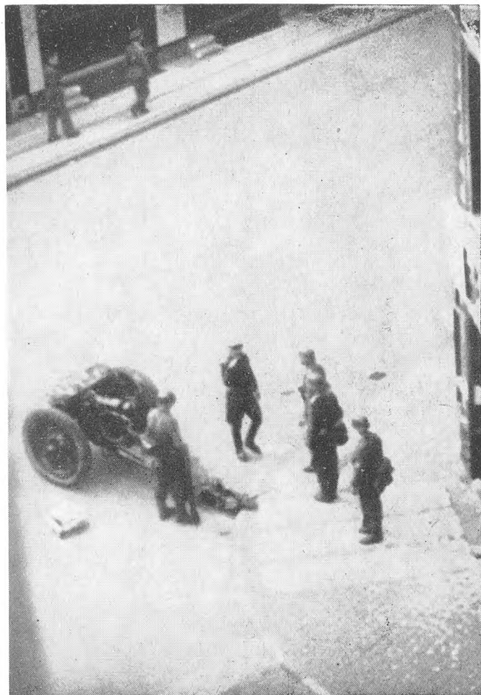
Tyskerne opstiller en Kanon, som skal betryge Istedgade.