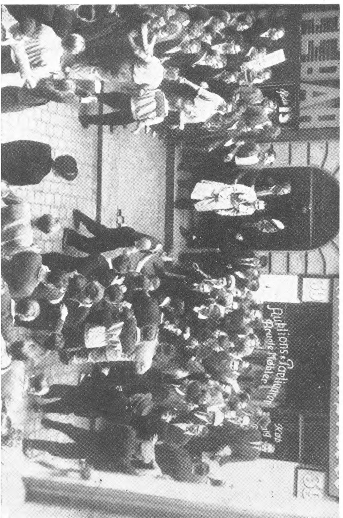
Dramatisk Situation fra Saxogade. En Obergrenadier, som man har forfulgt op i Opgangen, har skudt en af sine Forfølgere og bliver derefter selv skamslaet. Manden i den lyse Frakke paa Trappestenen raaber: »Giv Plads for Ambulancen!« Løvrigt henvises til Af-snittet: 30. Juni.