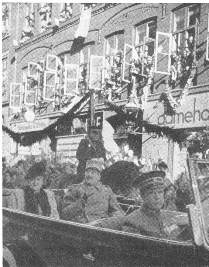
Kongen ledsaget af Dronningen paa Hyldesttur gennem Istedgade.