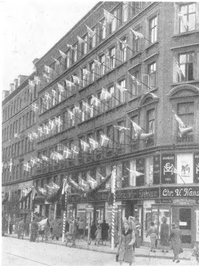
»Det flagende Hus«, Istedgade 93—95, Hjørnet af Oehlen- schlägersgade. Isenkramfirmaet Chr. V. Hansen, som ejer Ejendommen, lod bekoste Udsmykningen i Anledningen af Kongens Fødselsdag efter Befrielsen.