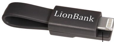
2in1 Kabel (Micro-USB und Lightning Anschluss)