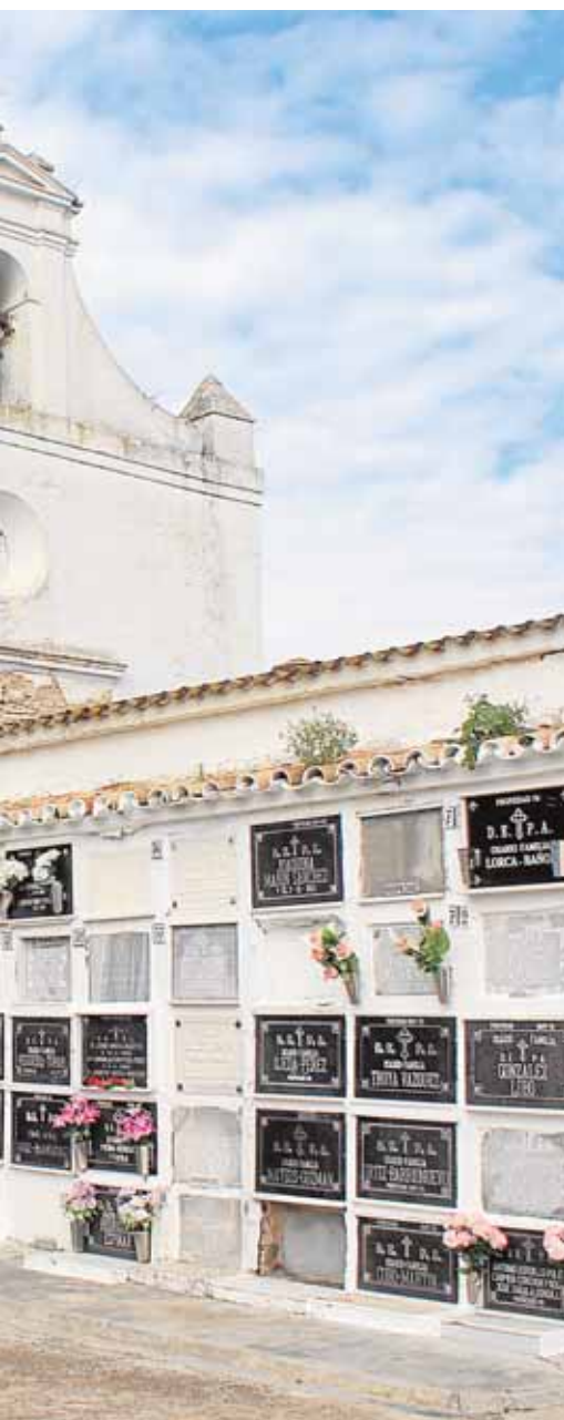
nichos del cementerio

dad, integrado en el programa Ciudad Amable cuyo objetivo es «abrir un nuevo camino en las políticas de intervención en el espacio público por parte de las administraciones». El coste de la peatonalización ha sido de 300.000 euros. A.H.