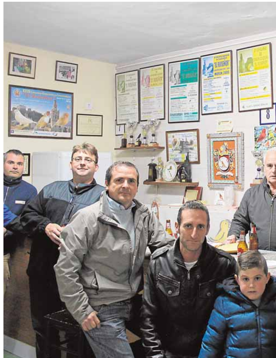
Integrantes de «El Ruiseñor», de donde han salido varios campeones