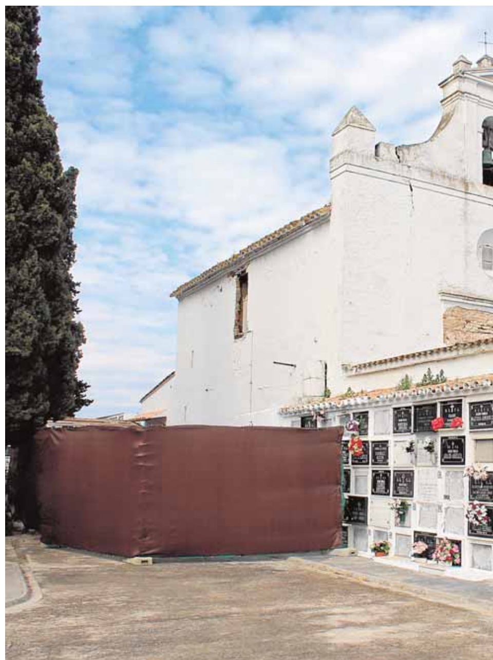
El área próxima a la capilla ha sido vallada, impidiendo el acceso a numerosos n

Hace casi dos décadas que esta capilla, que le confiere mucha personalidad al cementerio utrerano, dejó de utilizarse y algunos de sus elementos más valiosos, como el Cristo de la Misericordia o algunos cuadros, se trasladaron a la iglesia de Santiago. «El