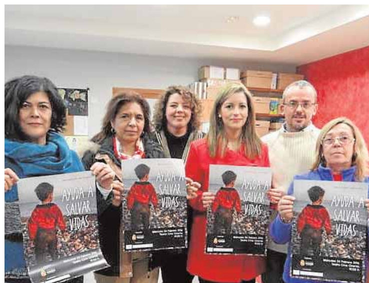
Presentación del acto en favor de los refugiados MORONINFORMACION.ES

El Ayuntamiento de Arahal ha convocado a los jóvenes del municipio para una charla informativa sobre la reedición de los planes de «Emple@ Joven» y «Emple@ +30». Estos dos programas están destinados a dar oportunidades de empleo a jóvenes desempleados de entre 18 y 29 años que firmarán un contrato laboral por una duración de seis meses. Por otro lado, para mayores de 30 años en paro, el «Emple@ +30» garantiza un contrato de hasta 3 meses. El Ayuntamiento dispondrá de 717.716,14 € para financiar estos planes. La charla será el próximo jueves en el Salón de Plenos del Ayuntamiento, a las 18:00 horas. J. L. M.