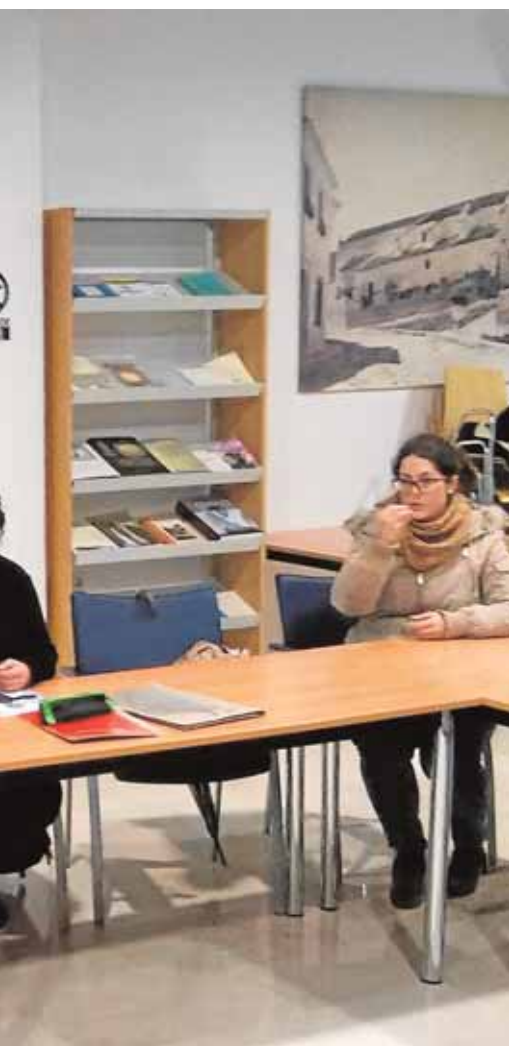
de haber en una familia

40 años podrán asistir para aprender a utilizar Internet a través de dispositivos como la tablet o el móvil. El taller también se realizará en la pedanía de Corcoya, y tiene como objetivo salvar el salto tecnológico para las personas mayores. B.M.