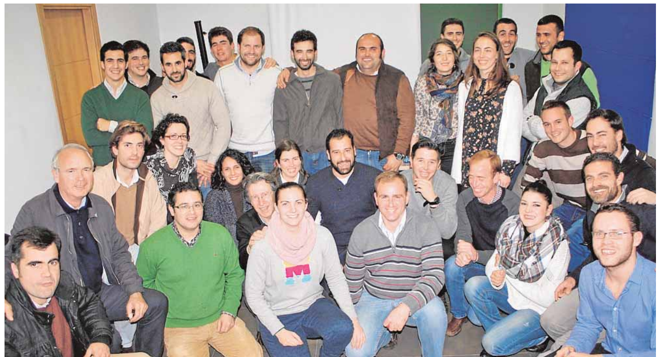
Los miembros de la gestora de «Somos Sierra Norte de Sevilla» acompañado de otros jóvenes

Ilusión, participación y compromiso son algunas de las palabras que definen a este grupo de jóvenes que vienen a relevar a una generación de la que continúan aprendiendo.