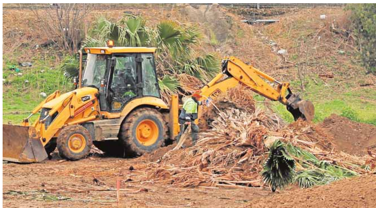
Operarios preparan la zona en la que se instalarán los huertos sociales en el barrio de la Alcarrachela

motivo del Día de Andalucía. En esta cita los estudiantes participan con la elaboración de recetas de origen andaluz, inglés y francés que se degustan en la sede de la EOI como parte de un día de convivencia e intercambio cultural.