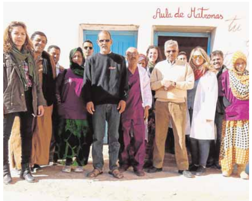
Miembros de la delegación solidaria de Carmona en el Sáhara