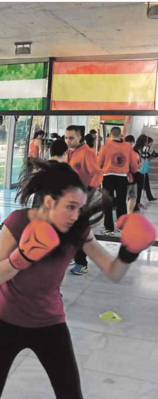
ada de puertas abiertas

lación de pavimento de caucho para evitar accidentes. Es uno de los tres nuevos parques infantiles de la localidad, además de los de la plaza Mili-ki y la plaza Antonio Chacón. También ha comenzado las obras de mejora y ampliación de otros ocho parques.