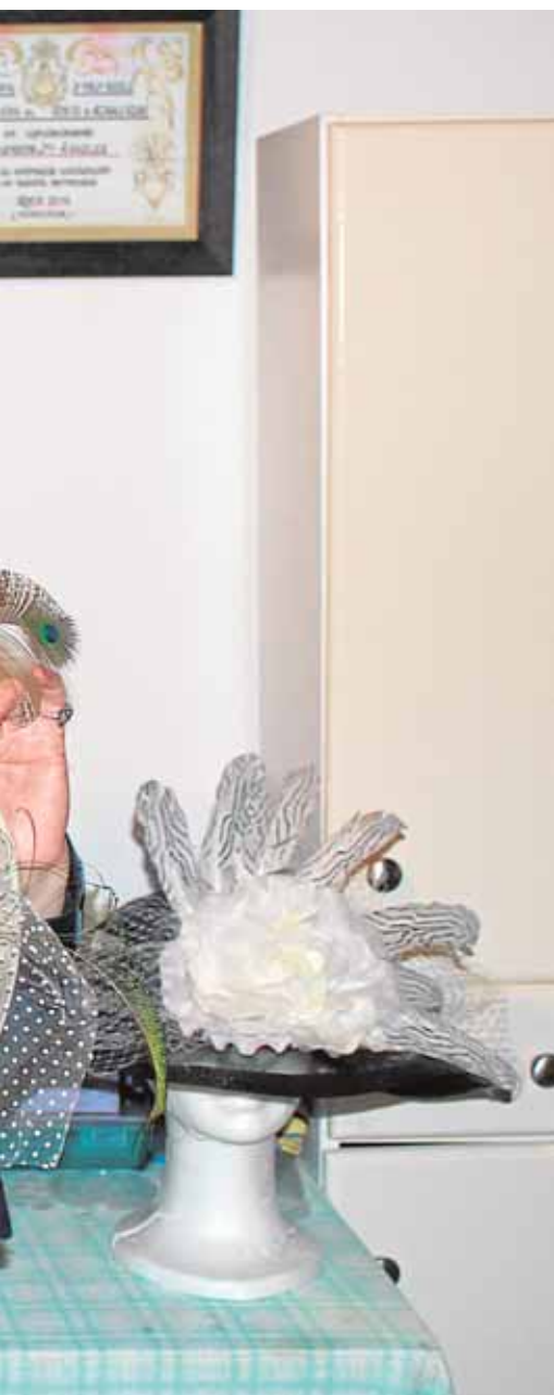
ido obteniendo en su trayectoria

pio; concretamente, la Avenida de la Constitución, Pablo Iglesias y Ntra. Sra. de la Oliva. Con este recordatorio desea advertir a la ciudadanía antes de hacer efectivas las correspondientes sanciones que la ordenanza vial prevé para estas infracciones.