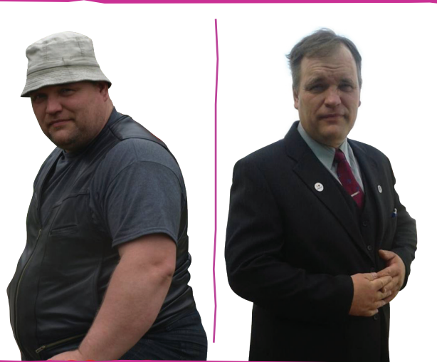
Aini ERAETTEVÕTJA, TARTUMAALT