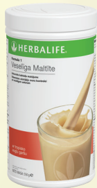
Troopilised viljad #0144