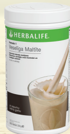
Küpsised ja kreem #0146