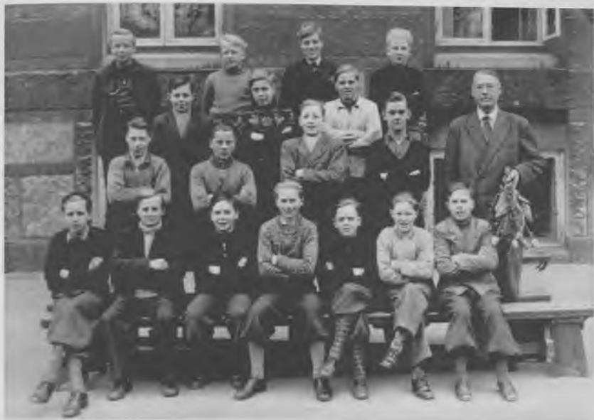
Der foreligger ikke noget billede af drengene i 3. fri mellem 1945/46 i Strandvejsskolens arkiv, men her er drengene fra 3. fri mellem i 1942/43. Drengene var i en alder, hvor de sled hårdt på tøj og sko, så tre år senere ville drengene nok have været knap så pæne i tøjet (Strandvejsskolens arkiv, Københavns Stadsarkiv).

middelklassepræget beboergruppe. Generelt var bebyggelsen mindre tæt, nyere og i bedre stand end f.eks. på Nørrebro. Det betød, at gruppen af arbejdere ofte bestod af faglærte arbejdere, og det gjaldt også eleverne i Holbølls 3. fri mellem. Der er en elev, hvis far er ingeniør, en, hvis far er styrmand og en anden, hvis far er vognmand. Ellers er fædrene bagere, farvere, mekanikere, malere, maskinsmede osv. Fem-seks af eleverne har fædre, der er ufaglærte og to bor i familier, hvor det er moderen, der er familieoverhoved: Den ene betegnes som enkefrue, den anden som fraskilt tekstilarbejderske. 19