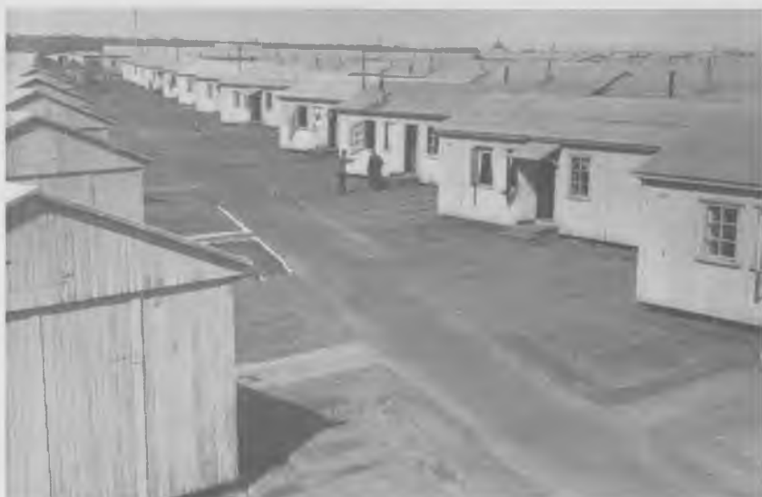
Barakker i Kløvermarkeslejren. Hen over sommeren 2006 har Kløvermarken været et omdiskuteret område i forbindelse med overborgmester Ritt Bjerregaards planer om her at opføre en række billige boliger til glæde for folk med ordinære indkomster. I givet fald bliver det ikke første gang, at der ligger boliger på Kløvermarken. I den sidste halvdel af 1940'erne rummede Kløvermarken således tusindvis af flygtninge fra det østlige Tyskland.