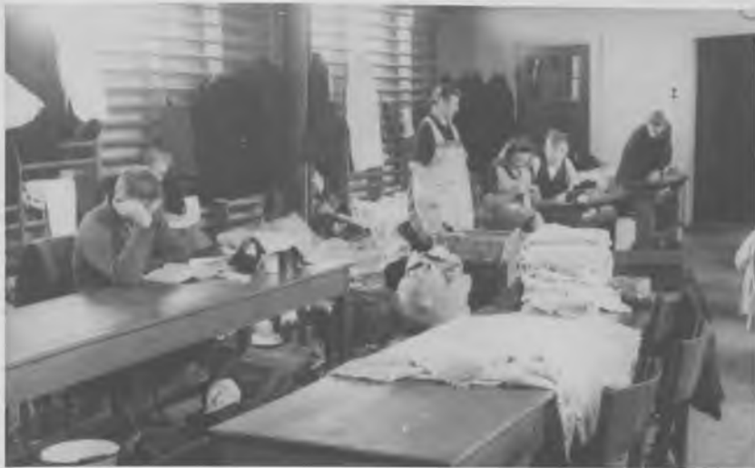
Flygtninge på Kettevejens skole i Hvidovre.

Hvad lægerne og Sanitetstjenestens chef anfægtede var, at flygtningene ikke fik tilstrækkeligt med ordentlig føde til at kunne overleve en række ellers almindelige og forholdsvis uskadelige sygdomme. Og dette fortsatte efter at Danmark havde overtaget ansvaret for flygtningene.