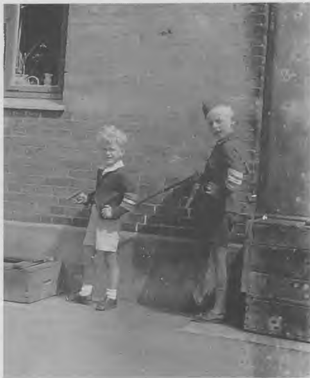
Odinsgade, København, maj 1945. Børn leger frihedskæmpere efter den 5.maj. De store forbilleder kunne man se køre forbi på gaden, udrustet med armbind og våben (Frihedsmuseet).

Det sker i "de fem mørke besættelsesår". Modstandsbevægelsens medlemmer hedder næsten overalt "frihedskæmpere", et begreb der først blev udbredt i besættelsens sidste år. I en stil anvendes det endnu mere højstemte "patrioter". Begrebet "kapitulationen" er anvendt om den 4. og 5.maj, hvor den mest almindelige betegnelse ellers er befrielsen.