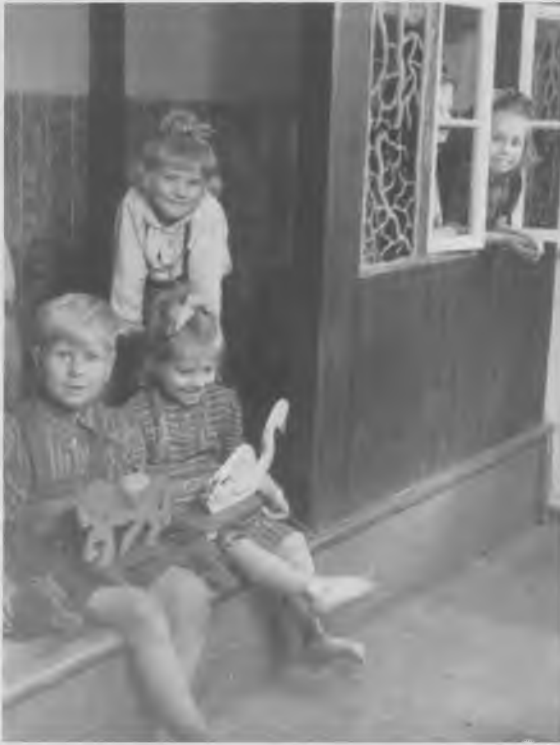
Mindreårige flygtningebørn nyder sommersolen udenfor den barak, der gik under betegnelsen "Børnehaven".

[Oberleutnant T.] fået lov at straffe drengene efter første forsøg, havde de aldrig ovovet at gentage forsøget”.