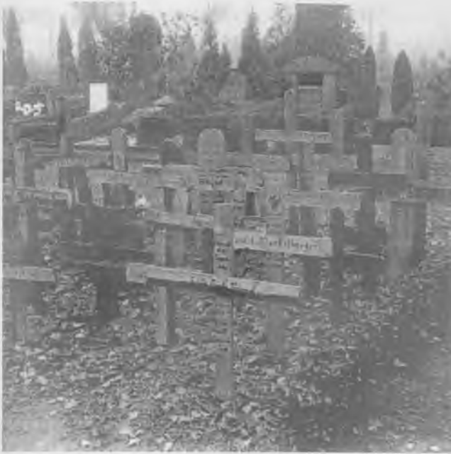
Flygtningegrave på Bispebjerg Kirke- gård.

de af administrationens funktionærer til pressen givne oplysninger, men at helhedsindtrykket dog ikke herved er forrykket, ligesom det må tages i betragtning, at det har drejet sig om spørgsmål, der vanskeligt på stående fod kunde kræves nøjagtigt besvarede, og hvis besvarelse i det hele måtte tages med de af materialets særegne beskaffenhed flydende forbehold i forskellig henseende". 81