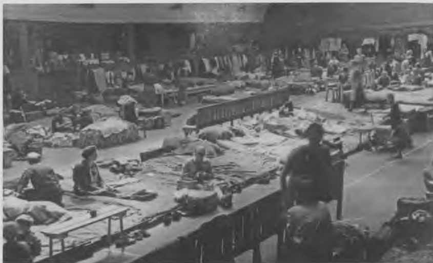
Flygtningelejren i tennishallen på Pile Allé (Københavns Bymuseum).

skrev til Arbejds- og Socialministeriet og Luftværnschefen og henstillede til, at skolerne "snarest" blev overgivet til skolebrug – "under henvisning til de alvorlige sociale og pædagogiske konsekvenser for børnene og hjemmene". 31 I august 1945 udsendte 2800 demonstrerende forældre i Enghaveparken en resolution, der krævede, at de tyske flygtninge omgående skulle ud af alle skoler. 32