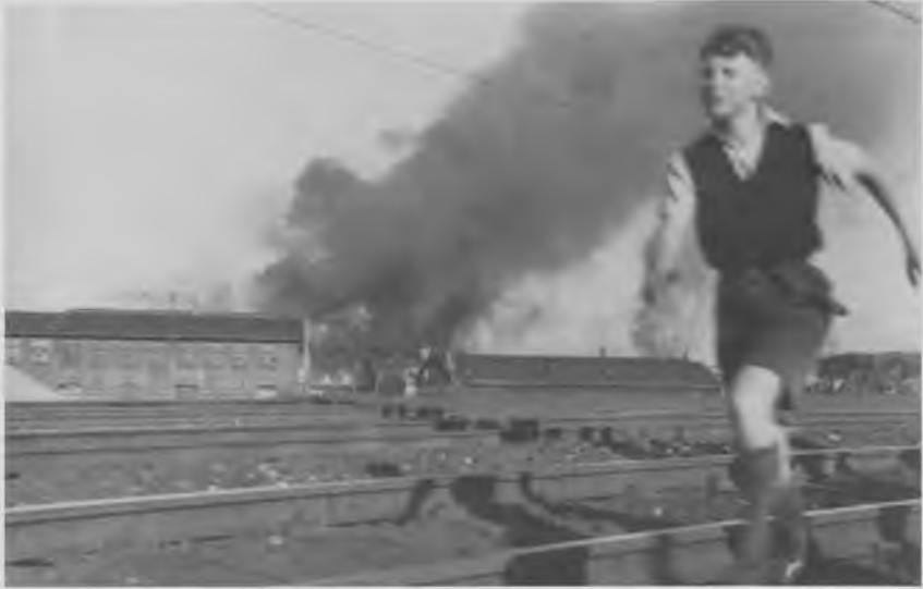
Fra sabotagen af Riffelyndikatet i Frihavnen 22. juni 1944. Med sin udstråling af dramatik og autenticitet er det et af besættelsens mest anvendte sabotagebilleder. Frihavnen og jernbaneterrænet ved Nordhavns Station var et nærområde for drengene i 3. fri mellem 1945/46, og drengen på billedet kunne sagtens være en af dem.

I Nansensgade overværede en af drengene en dramatisk episode med først fire frihedskæmpere, derefter "hipo'er", der skød i gaden, og drengen måtte søge dækning i en opgang. En dame blev dræbt under skydningen, kan der berettes om i stilen. Det er episoder som denne, der utvivlsomt blev grundigt fortalt videre og endevendt blandt kammeraterne, som kunne få klassekammeraten til beklagende at berette, at han slet intet havde oplevet i de fem dramatiske år.