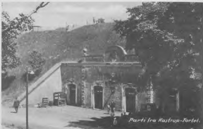
To af de bygninger, der stadig afslører Kastropfortets oprindelige formål, er kasematerne midt i området. Her blev tidligere opbevaret krudt. Denne del af fortet blev dog ikke benyttet i lejrens tid som børneflygtningelejr.

hal, som oprindelig var radiobillbane. Den kunne ikke opvarmes, og den var på alle sider omgivet af store vinduesflader. Hallen kunne pga. dette ikke bruges til beboelse, og blev i foråret 1946 af de oprindelige ejere flyttet til en anden lokalitet. 13 Ved optællingen af flygtningene 15. januar 1946 var der 567 flygtninge på disse knap 1.500 m 2 .