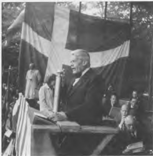
John Christmas Møller var formand for Det Konservative Folkeparti ved besættelsens start i 1940. I 1941 forlod han imidlertid politik, da han fandt, at Danmark strakte sig for langt for at imødekomme besættelsesmagten. Derefter flygtede han i 1942 til England, hvor han blev formand for Det Danske Råd. Kort før befrielsen tilbød han uden bemyndigelse fra dansk side, at Danmark ville stille med omtrent 11.000 soldater, når det slagte Tyskland skulle besattes. Christmas Møller blev udenrigsminister i befrielsesregeringen. Her ses han på talerstolen ved fejringen af Norgesdagen i 1946.

og afholde bespisningen. 27 Da det britiske udenrigsministerium erfarede de danske krav, udbrød lederen af Foreign Office's Northern Department : "I am shocked at their attitude". 28 Men den britiske administration måtte - chokeret eller ej - forholde sig til memorandummet.