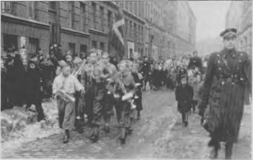
Jubilæumsoptog fra Randersgades Skole (naboskole til Strandvejskolen) på vej gennem Aalborggade vintertiden 1945/46 med FDF-orkester i spidsen. Det er omtrent på det tidspunkt, hvor drengene i 3. fri mellem skulle skrive stil om besættelsen. Der er tilskuere og liv i gaden. Østerbro var både før og under besættelsen folkerigt og en bydel med meget udeliv.

og angivelser af stemning. Det afgørende er: Hvad skete der!