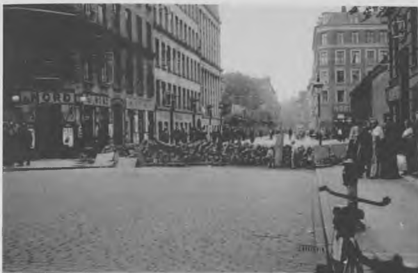
Det gik hårdt til under Folketøjren i sommeren 1944. På Nørrebro byggedes der barrikader og der blev begået hærverk mod forretninger, hvis indehavere man mistænkte for at være nazister. På billedet ses en barrikade ved hjørnet af Poppelgade og Møllegade på Indre Nørrebro.

Jeg konstaterede nu, at Barikaden i Nørrebrogade var anbragt mellem Slots- gade og Stengade; den bestod af en lukket Flyttebus, væltet paa tværs og for- ankret med tove til Lygtepælene, man var i Færd med at lange Brosten op paa den væltede Vogn hvorpaa de tidligere omtalte Flag var anbragt. I Lednings- nettet over Barikaden var ophængt en Voksdukke. En anden Voksdukke var meget dekorativt anbragt paa Taget af Telefonboxen udfor Fælledvej. Disse Dukker viste sig at stamme fra Bulldog, 2 hvis Vinduer havde faaet en "Sten- kur" fordi Firmaet havde nægtet at lukke inden Middag. Senere har jeg fra paalidelig Kilde erfaret, at 3 Lastbiler havde afhentet saa meget af Varelageret, som kunde rummes paa disse. Ad Øster Søgade vendte jeg tilbage til Svane- gade Kl. 13.30.