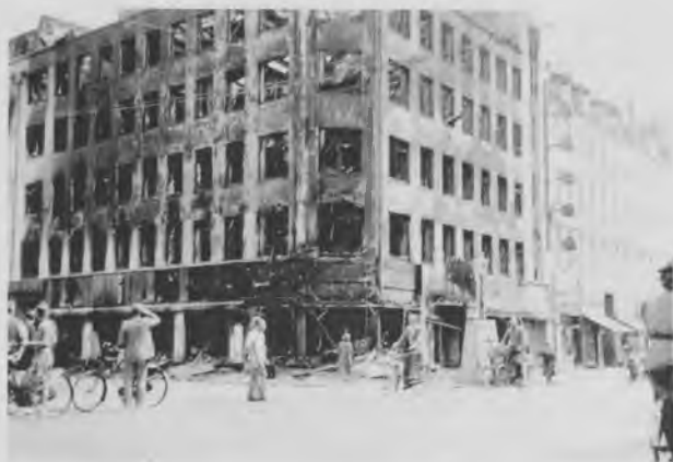
Da "Buldog" udbrændte mistede Daells Værehus en konkurrent i kampen om kunder fra arbejderklassen. Bygningen blev siden revet ned og grunden overtaget af Irma, der i midten af 1950'erne byggede forretning her. I dag ligger der en Fakta på stedet.

ringen var eller vilde blive genindført, henstilledes det fra Personalet, at man fik Tilladelse til at gaa eller at der fra Kontorets Side blev gjort Skridt til at skaffe Personalet Ausweis, hvilket skulde yde en vis Garanti for, at man senere paa Dagen kunde komme hjem paa Trods af eventuelle Skærpelser af Situationen. Det blev dog kun til Diskussion om, hvorvidt dette skulde organiseres og efterhaanden var der flere, der uden videre gik hjem. Ved 10.00 Tiden var der ikke flere Sporvogne paa Gaderne, idet Folk flere Steder havde kastet Sten mod Vognene og truet med at afspore dem, hvorfor det kørende Personale ikke ønskede at fortsætte Kørslen.