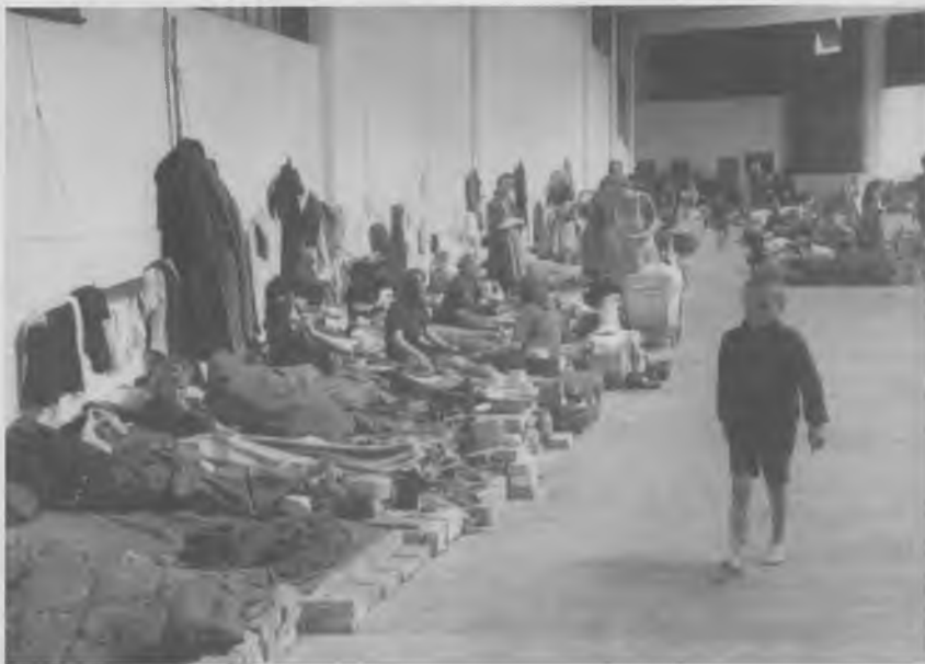
Fabrikken Nordværk i Haraldsgade husede 3600 flygtninge.

han, håbede han at kunne trykke dem i hånden som ligeværdige mennesker. 53 Faktisk anmodede Harald Nielsen om at ledsage transporten, da de sidste flygtninge fra Kløvermarkslejren skulle hjemsendes. Flygtningeadministrationen afsløg hans anmodning. 54