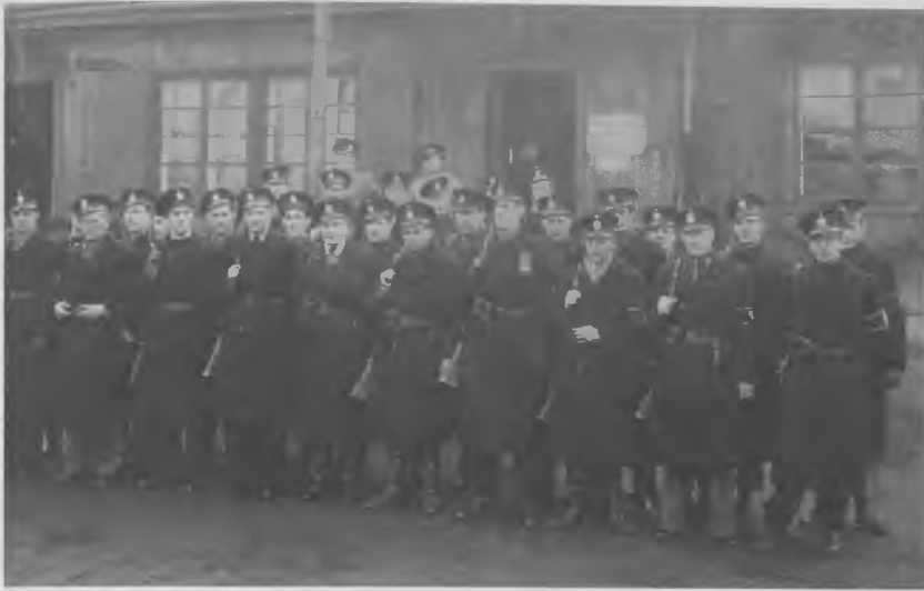
Københavns Vagtværn foran vagtværnsbygningen på Kløvermarken.

botere”, forklarede han og advarede lejrlederne mod at udsætte sig for ”ubehageligheder”, hvis de ikke overholdt reglementet. 61