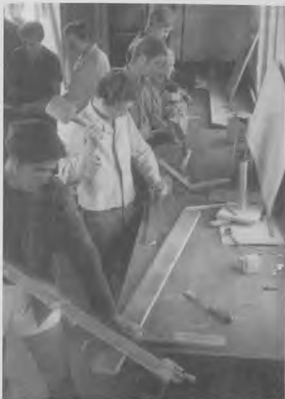
Man forsøgte at etablere lærlingeuddannelser for de halvstore drenge. På billedet ses snedkerlærlinge. Netop denne gruppe af drenge skabte dog en del uro i lejren, og mange af de store drenge blev i foråret 1946 flyttet til Ryvejslejrens flygtningelejr.