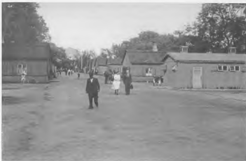
Der lå flere flygtningelejre på Amager. Foruden de beslaglagte skoler var der lejre på Kløvermarken, på Kastrupfortet, på Krudttårnsvej (den nuværende Amager Strandvej), i Dragør og, som vist på billedet, i det gamle militærområde Ballonparken ved Artillerivej.

enheder i Tyskland vigtige - også for Storbritannien.