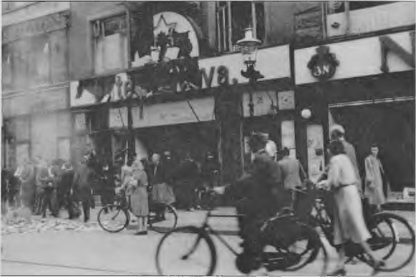
Også fotoforretningen Stella Nova på Nørrebrogade blev "expederet" i de hektiske sommerdage i begyndelsen af juli 1944.

ret ved Haandværkerhaven og ved Kirken fik vi af Politiet at vide, at Frederiksborgvej var spærret ved Parkalle. Jeg søgte nu ned i Mosen i den Hensigt at komme over til Mørkhøj, hvis dette var muligt, men alle Veje over Mosen var spærret og flere Gange maatte jeg standse for tyske Vagter, der ustandseligt vilde vide "wohin". Efterhaanden kom jeg ud til Frederikssundsvej, hvor jeg drejede nordpaa.