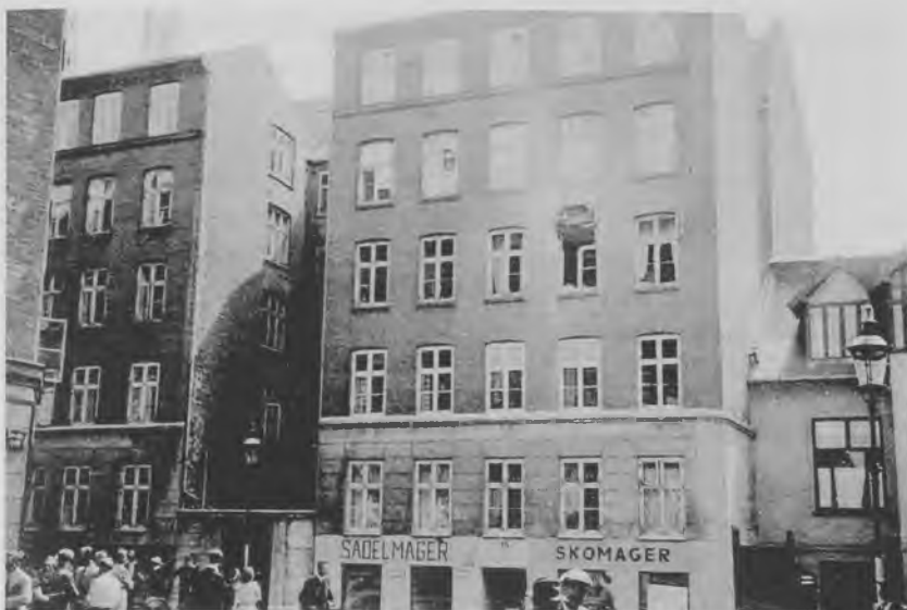
På billedet ses det hus i Ewaldsgade, som var blevet beskudt af en tysk maskinkanon, og som Erik T. Jensen på sin tur kom forbi.

22.00 var ialt 21 dræbte og 213 saarede paa de københavnske Hospitaller. Iøvrigt paaviste hun flere Steder, hvor Geværprojektiler var gaaet ind i Murene og et enkelt Sted gennem et Vindue paa 3. Sal.