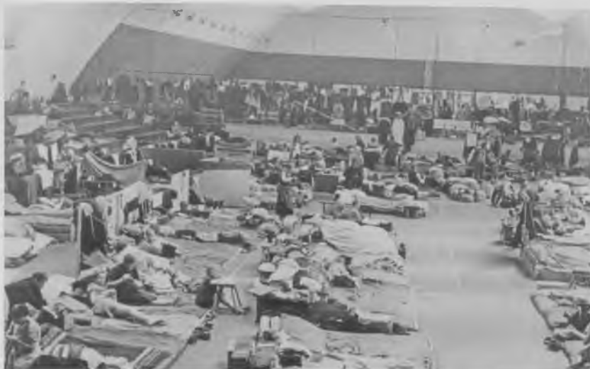
Tennishallen på Hartmannsvej med over 1000 flygtninge (Københavns Bymuseum).

et skur med 26 lokummer, og et pissoir som var ”en åben trærende – for alles åsyn”. 19 I perioden 12. maj til 4. juli 1945 var lejren ramt af en tyfusedemi. Der blev konstateret 47 tilfælde. En læge mistænkte toiletterne for at være skyld i epidemien: ”Da det samtidig var meget varmt i vejret, og da der var store mængder fluer samtidig med at lejrens madrum kun var fjernet ca. 4 m. fra toiletterne var betingelserne for bakteriespredning tilstede”. Beboerne blev vaccineret, og der blev installeret ”vandtoiletter”. 20