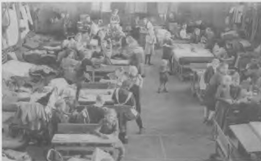
Talrige københavnske skoler var i krigens sidste tid, og i en tid derefter beslaglagt til husning af tyske flygtninge fra Østpreussen – til stor utilfredshed for store dele af den københavnske befolkning, der ikke havde megen medlidenhed med de fordrevne tyskere. Her ses flygtningenes sovesteder i en gymnastiksal på Skolen ved Sundet i Sundbyøster på Amager.