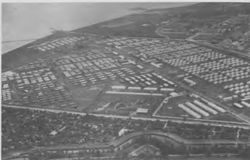
Flygtningelejren på Kløvermarken kunne huse 18.000 flygtninge (Københavns Bymuseum).