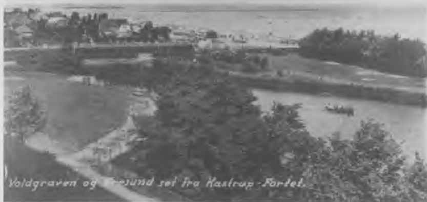
Fra Kastrupfortets volde var der en fremragende udsigt til de omkringliggende huse, og til stranden, som flygtningebørnene ikke måtte benytte. Fra anbringelsen i 1945 til afrejsen i januar 1947 måtte børnene blive på fortets område, som det var strengt forbudt at forlade.

Sagen var faktisk blevet indrapporteret tidligere til luftværnschefen af den tilsynsførende fra Socialtjenesten i København, men der synes ikke at have været megen medlidenhed med drengene. 22 Ifølge Socialtjenestens inspektør, der jo burde have grebet ind overfor de uacceptable metoder, som lejrlederen anvendte, bestod deres forbrydelse i, at de skabte uro i lejren. Den ene havde beskyldt lederen for nazi-metoder, og den anden havde været rømmet fra lejren. De var ifølge den tilsynsførende ”idømt stuearrest i syv dage. Den værste af drengene er anbragt i en særlig for dette øjemed indrettet celle”. Ifølge inspektøren var straffen passende. 23