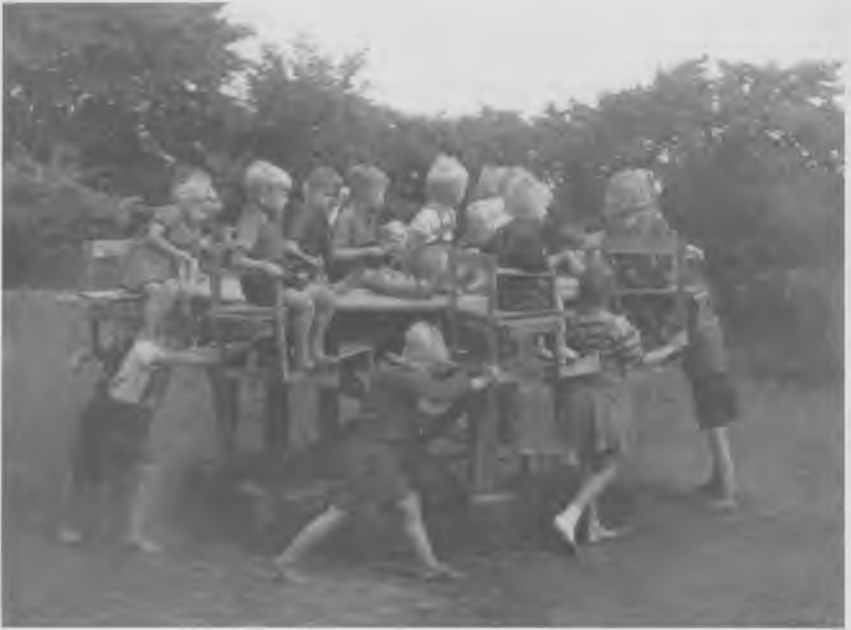
Børn fra Kastrupfortet leger på en hjemmebygget karrusel. Bemærk, at børnene er uden sko og strømper. Og det er ikke kun fordi, at det var sommer, da billedet blev taget. Også om vinteren var det et stort problem at skaffe strømper og fodtøj til de mange børn.