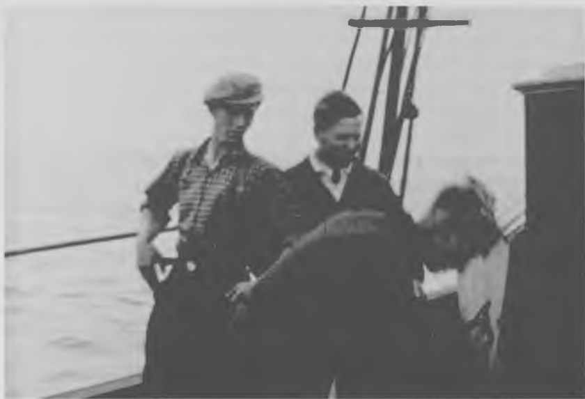
Rekonstruktion fra filmen "Det gælder din Frihed" fra 1946 (Det Kongelige Bibliotek).

for, at tyskerne skulle rette opmærksomhed mod tjenestens virksomhed. Men det kan dog ikke udelukkes, at naboer og bekendtes opførsel var næret af antisemitisme. Generelt skal årsager til den kynisme og grådighed, som kunne gribe om sig i et nabolag ved jødernes flugt, findes i motiver fra egentlig antisemitisme over misundelse til det øgede fristelsespres ved knaphedssituationen.