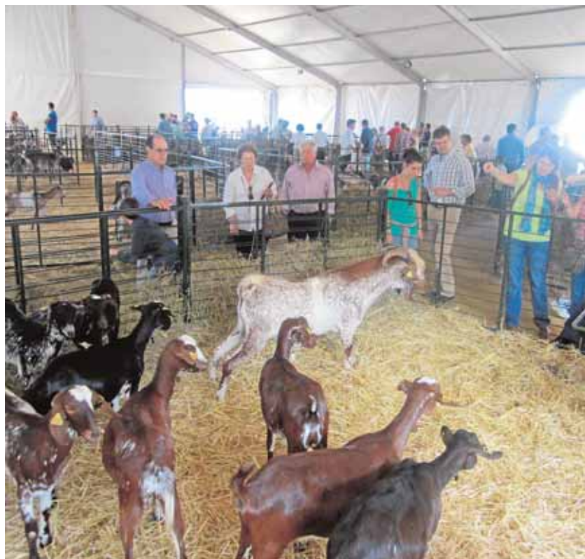
Imagen de la pasada edición de la feria agroganadera carmonense

Como novedades este año figuran apuestas por nuevas fórmulas de desarrollo para el sector como la denominada artesanía agroalimentaria, que consiste en que pequeños productores den valor añadido a su trabajo mediante la gestión de todo el proceso hasta la comercialización, algo que se adap-