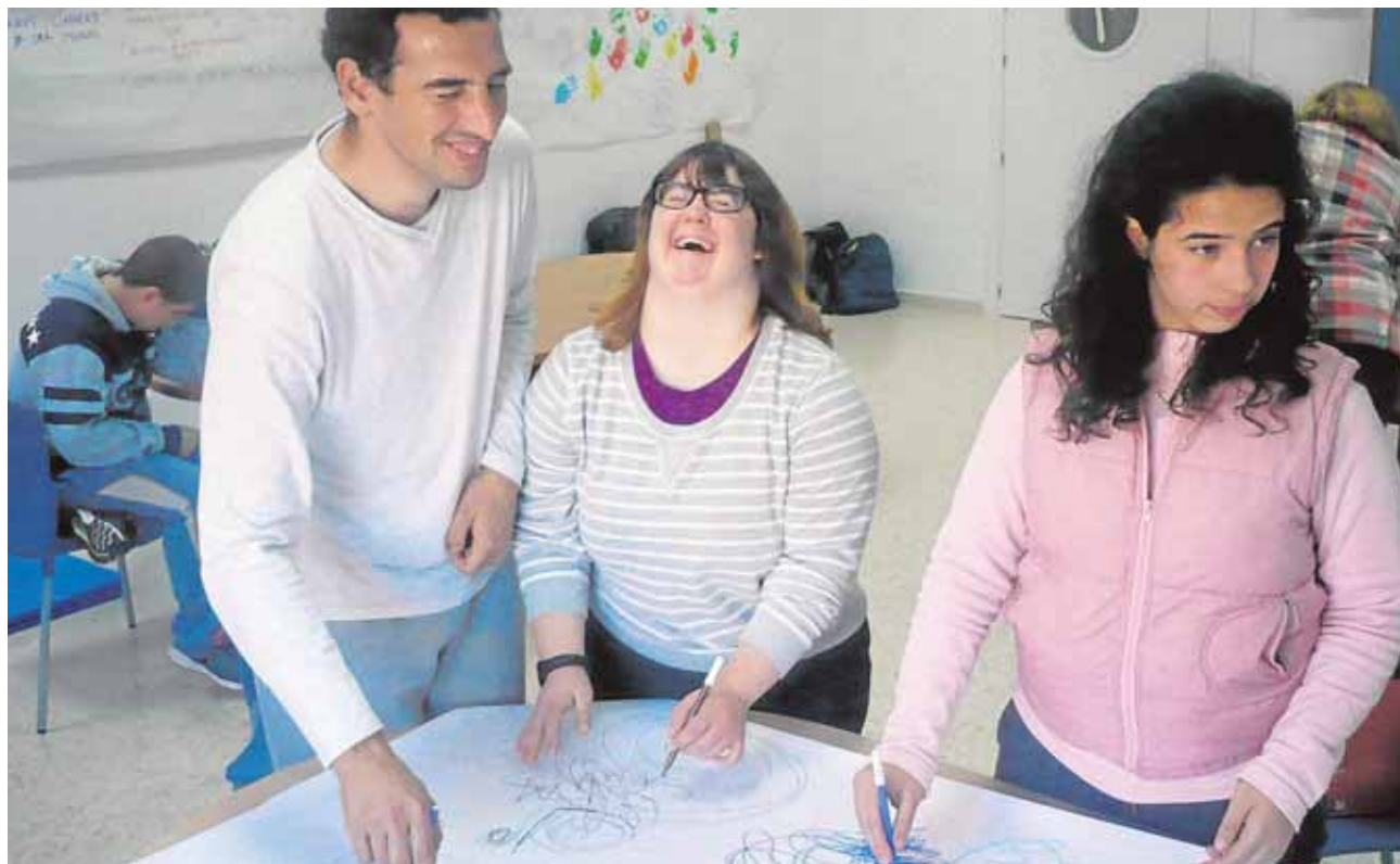
Varios usuarios en una de las sesiones de Arteterapia impartidas por la Fundación TAS