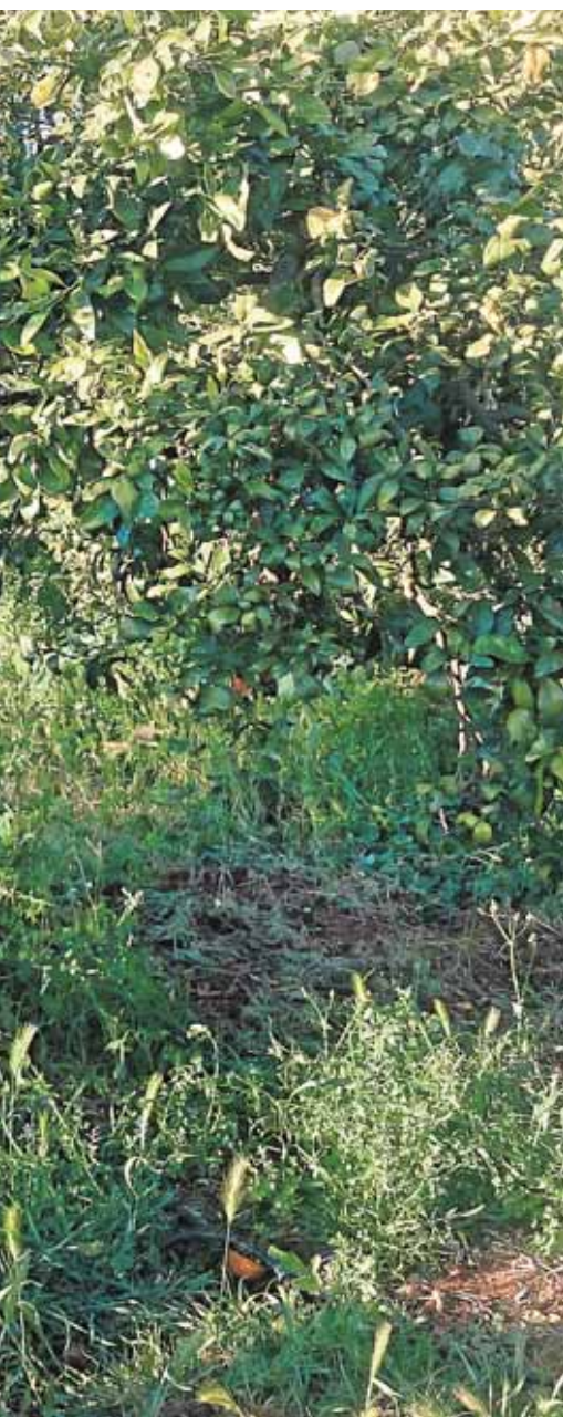
gicos a la agricultura

Historia, Patrimonio Documental y Archivos que convoca el Ayuntamiento de Carmona con la colaboración de la Universidad de Sevilla, la Diputación y la Asociación de Archiveros de Andalucía. Los trabajos pueden presentarse hasta el 30 de octubre.