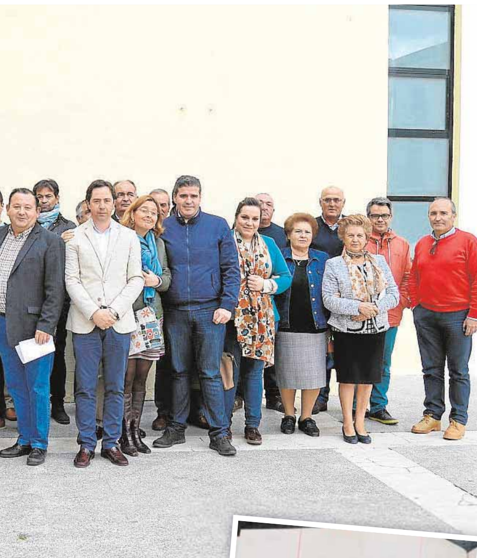
pasó a ser de Andalucía

dio de la historia. El primero de estos talleres se impartirá el próximo día 9 y será sobre Creación de máscaras teatrales romanas. El taller hará una introducción sobre el teatro en el Imperio Romano y comenzará a partir de las 11.30 horas. B.M.