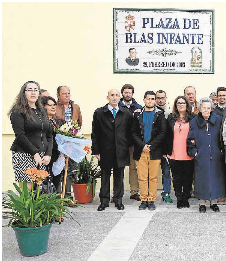
Homenaje en la plaza dedicada a Blas Infante. A la derecha acta por la que La Roda

Web sobre el centenario La Diputación Provincial colaborará realizando una web que aglutinará todas la empresas rodenses