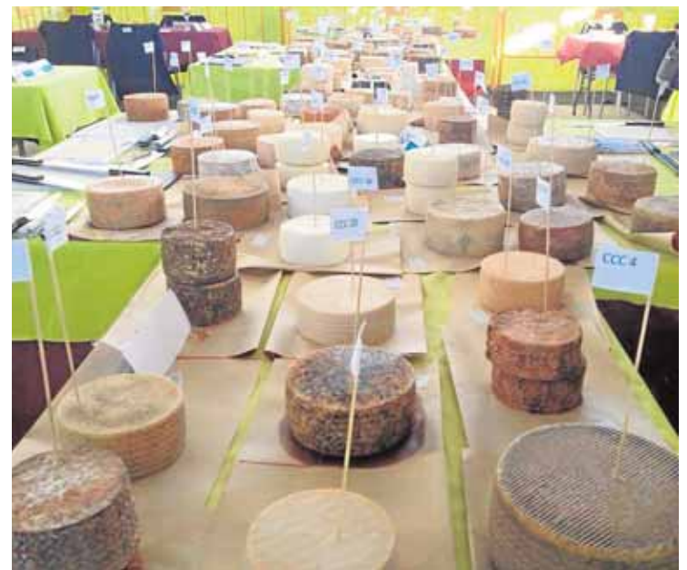
En esta edición han competido los productos de 30 queserías

El Ayuntamiento ha puesto en marcha su propio servicio de orientación laboral para ayudar y asesorar a los rubieños en la búsqueda de empleo. Bajo el nombre de «El Rubio Oriéntate», este servicio está dirigido a los vecinos demandantes de empleo para suplir la supresión de los antiguos Andalucía Orienta y evitar el desplazamiento a otras localidades. Desde el ayuntamiento informan que «Estas actuaciones se realizarán individualmente o a nivel grupal, teniendo en cuenta el perfil de los usuarios». Esta iniciativa se completará con un servicio de información telefónica llamado, «El Rubio te Whatsappea». B.M.