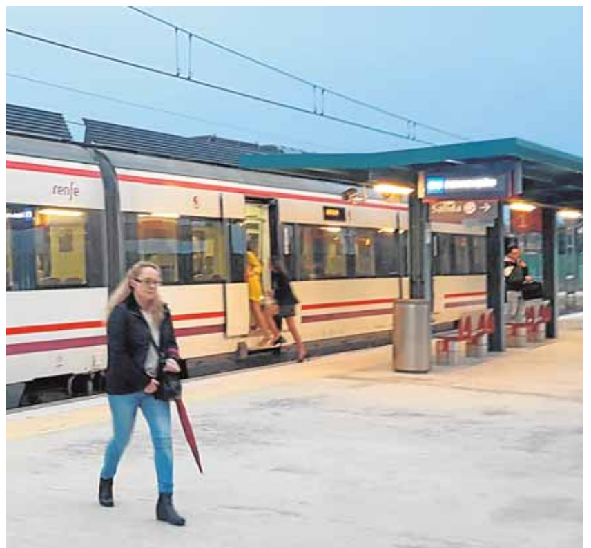
Tren de cercanías, de la línea C5, criticada por los usuarios