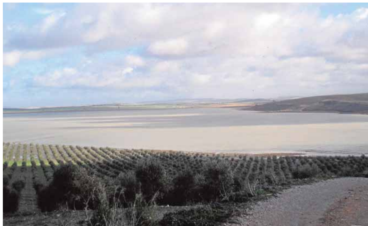
La laguna se ubica en una ruta clave para miles de aves migradoras que a su paso dejan bellas estampas

Financiación europea Varios organismos unen sus fuerzas para recuperar 13 lagunas del entorno y fomentar su uso público