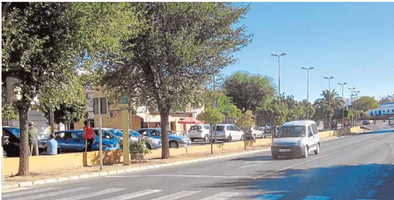
Los vecinos de la zona de Villarrosa se quejan desde hace tiempo de las inundaciones que sufren

del colegio Salesiano y que permitirán ampliar las instalaciones con nuevas pistas. Este espacio se adecuará a la práctica del deporte que se observa cuenta con más demanda en la localidad. Esta intervención generará más de un centenar de contratos.