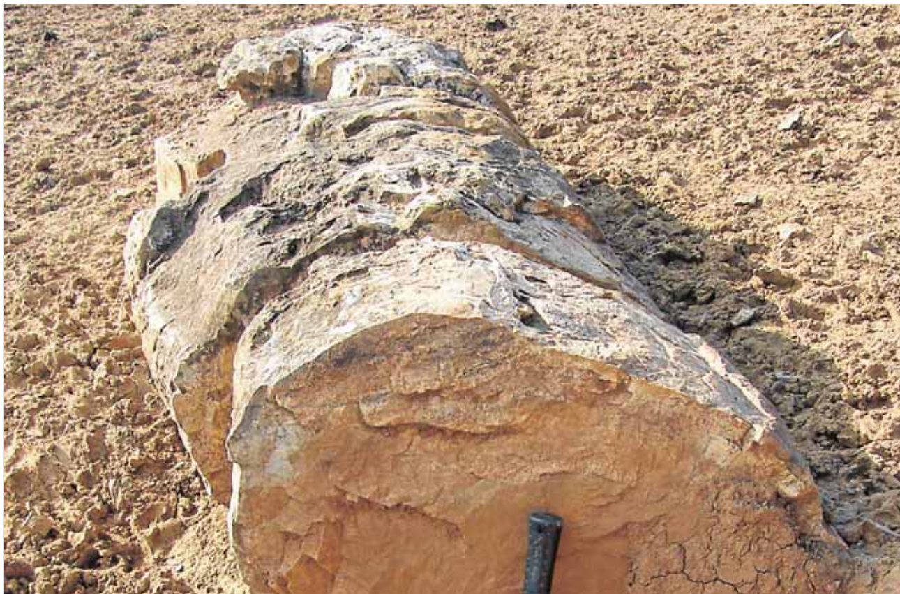
Especialistas del Parque Natural de la Sierra Norte confirmaron el hallazgo del árbol fósil de Almadén

zada al campo para escuchar la berrea el sábado a las 18:30 horas desde la Plaza Virgen de las Huertas. Además del avistamiento la visita incluye una degustación de tapas. La organiza el Ayuntamiento y la empresa Sierra Norte Aventura. A.C.