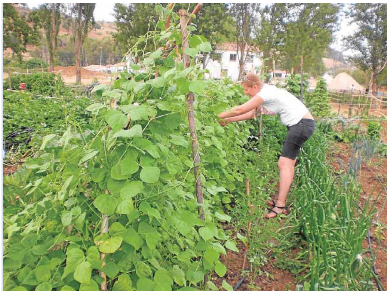
Los huertos sociales ecológicos de Cazalla están divididos en 33 parcelas

Cazalla no es el único pueblo que cuenta con huertos sociales en la Sierra Norte, también en La Puebla de los Infantes desarrollan una iniciativa similar desde 2012. La experiencia partió del colectivo ciudadano La Puebla en Transición y del Ayuntamiento del municipio. En total son algo más de 50 parcelas, la mayoría explotadas de manera individual y otras de manera grupal. Los huertos están muy presentes en el municipio y de hecho se han realizado actividades de divulgación como talleres con el insituto.