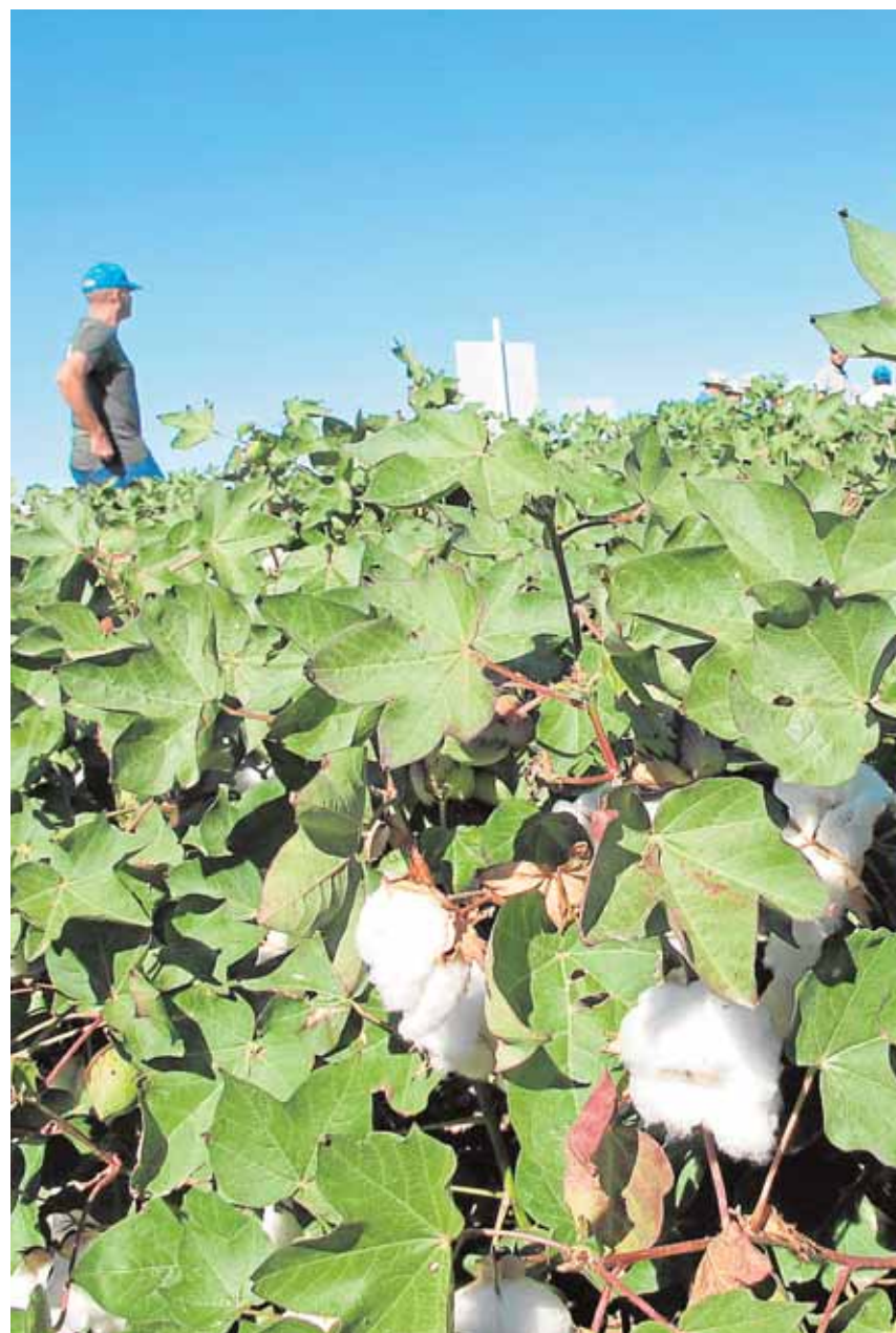
Campos lebrijanos con las primeras cápsulas abiertas del «oro blanco» A.H.

Desde las firmas comerciales de fitosanitarios, fertilizantes, defoliantes y semillas, que han celebrado en Lebrija