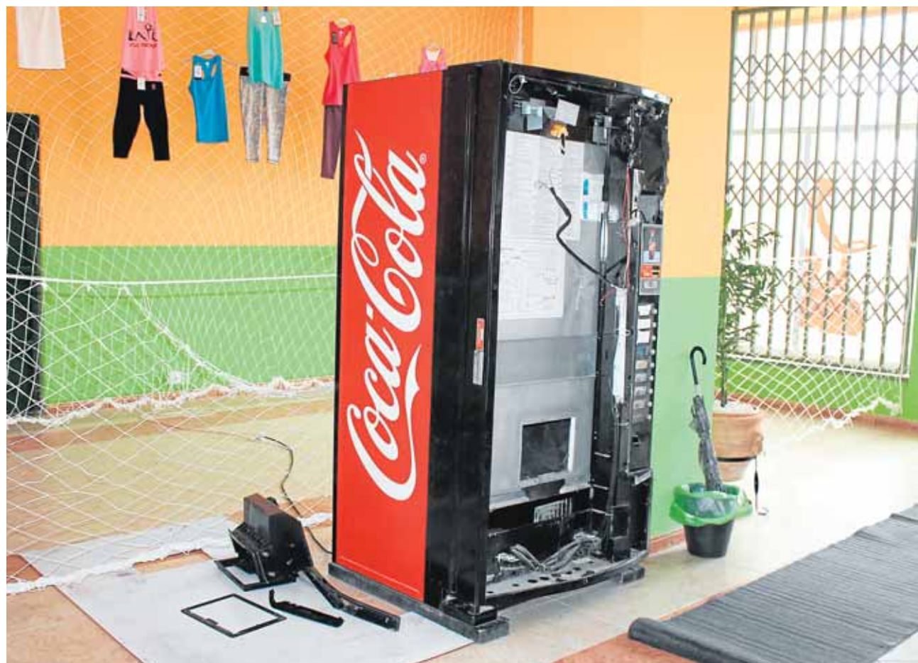
Destrozo de la máquina de bebidas de uno de los establecimientos afectados y sustracción de la recaudación L.R.I.

En la madrugada del lunes la Guardia Civil conseguía detener a el cuarto de los tres sospechosos, habiendo sido detenidos y puestos a disposición judicial todos. Según dice García Melo, los cuatro detenidos reúnen características similares «son varones de entre 30 y 40 años, con un amplio historial delictivo y reincidentes, habiendo dos de ellos salido hace poco de la cárcel».