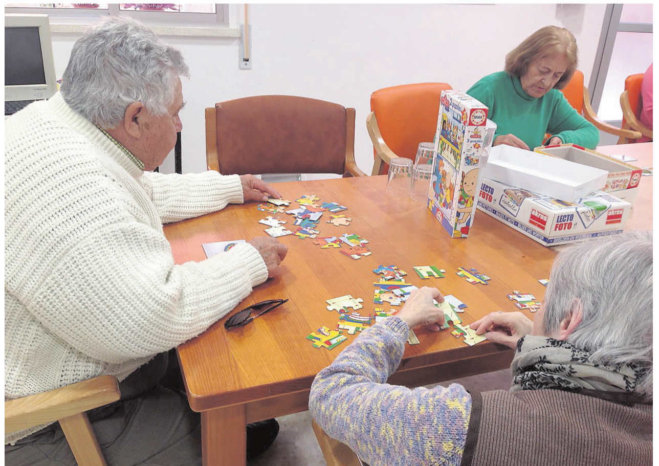
La realización de puzzles ayuda a los mayores a trabajar su memoria