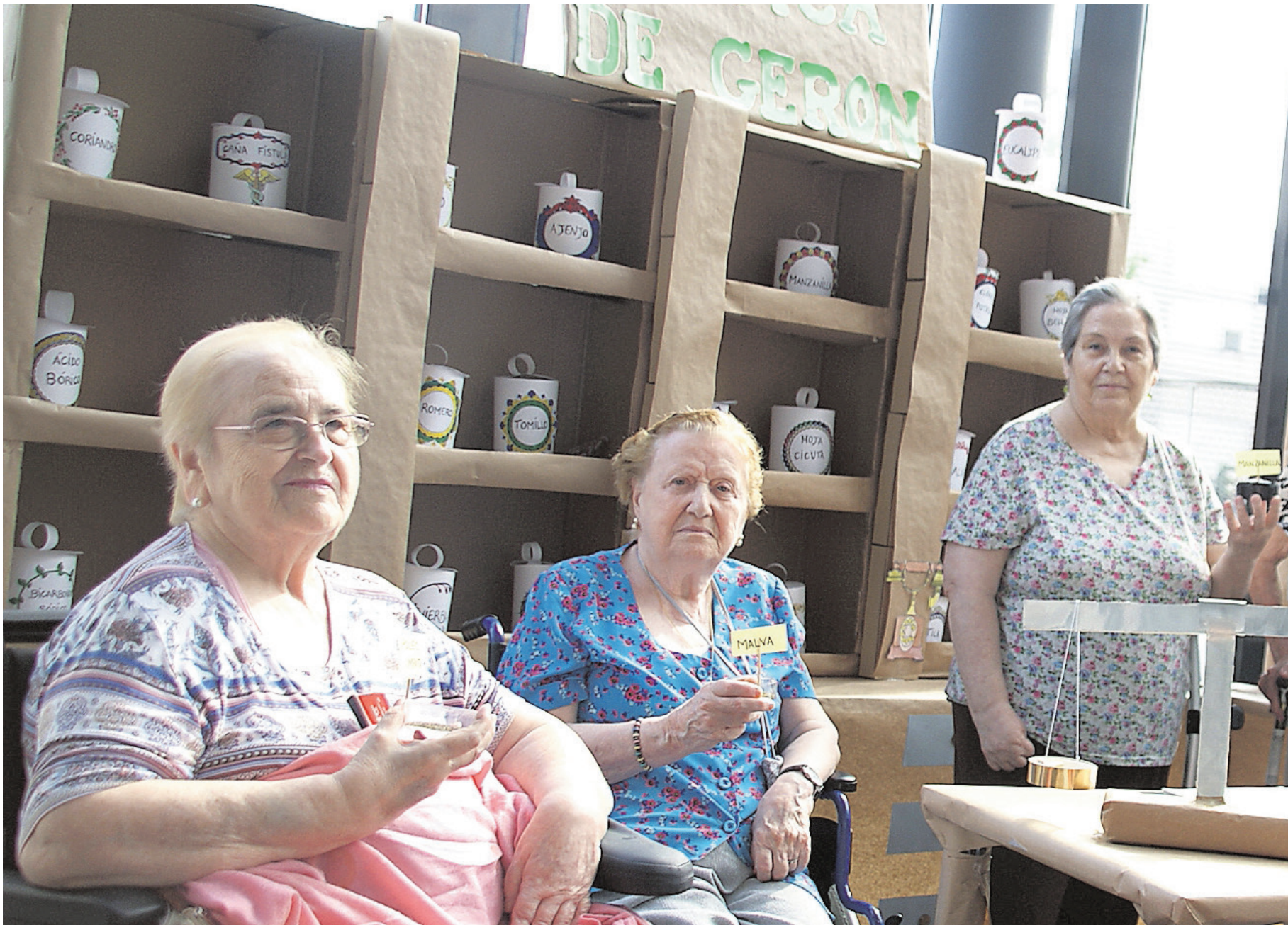
Participantes en la actividad celebrada en la residencia de mayores Gerón de Sevilla