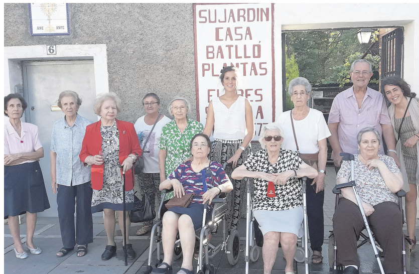
Los participantes en esta actividad

Fue una actividad entretenida, en la que nos sentimos familia en el camino entre la gente, ejercitamos la memoria sensorial y espacial, reconociendo especies y espacios; donde el contacto con las plantas nos recordó el valor de la simpleza, valor en el que no existen diferencias entre residentes, pacientes, familiares o profesionales.