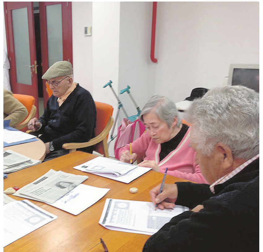
Los participantes en el taller de lenguaje, lectoescritura y cálculo

También realizamos tareas de matemáticas: cuentas, cálculos. Y, en la parte de Lengua, hacemos dictados y caligrafías que nos permiten seguir manteniendo lo aprendido en nuestros tiempos. Son unos talleres, además de entretenidos, muy interesantes.