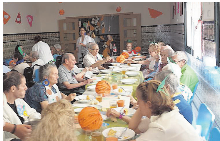
Un momento de la celebración en Hábitat Geriátrico

Las comidas son muy buenas y el pueblo es bonito. A veces me voy con la familia un día o dos para estar con ellos y luego vuelvo.