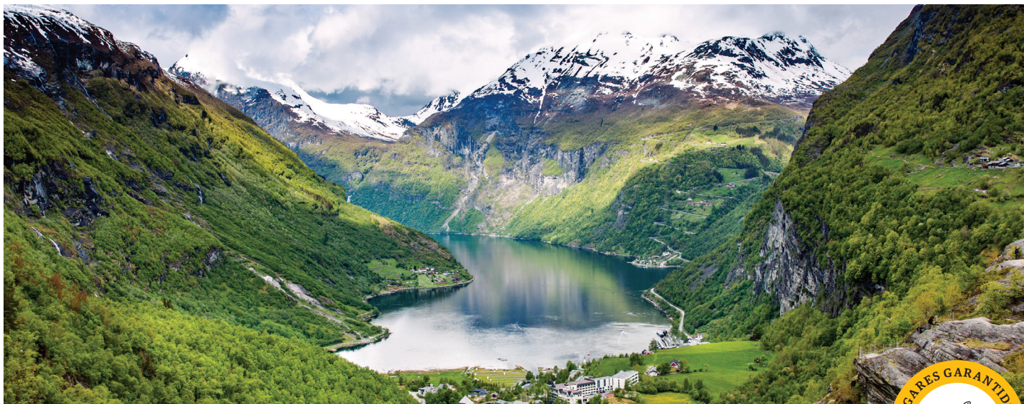
Fiorde de Geiranger