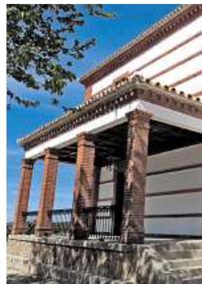
El Centro Escuelas Nuevas

Escenarios naturales Las visitas guiadas al centro se combinan con las actividades en el patio del edificio al aire libre