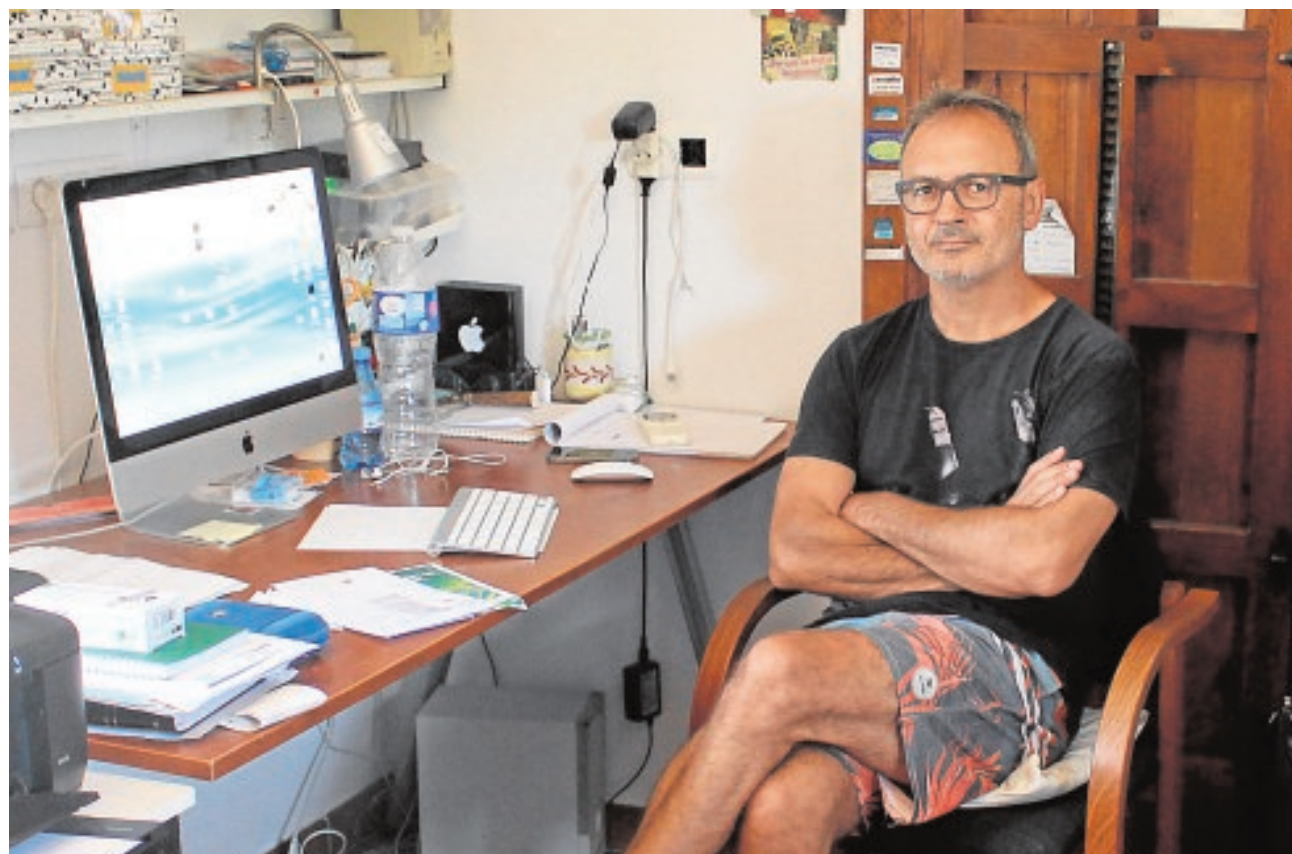
Álvaro Begines dirige la serie documental «Al sur del tiempo»,