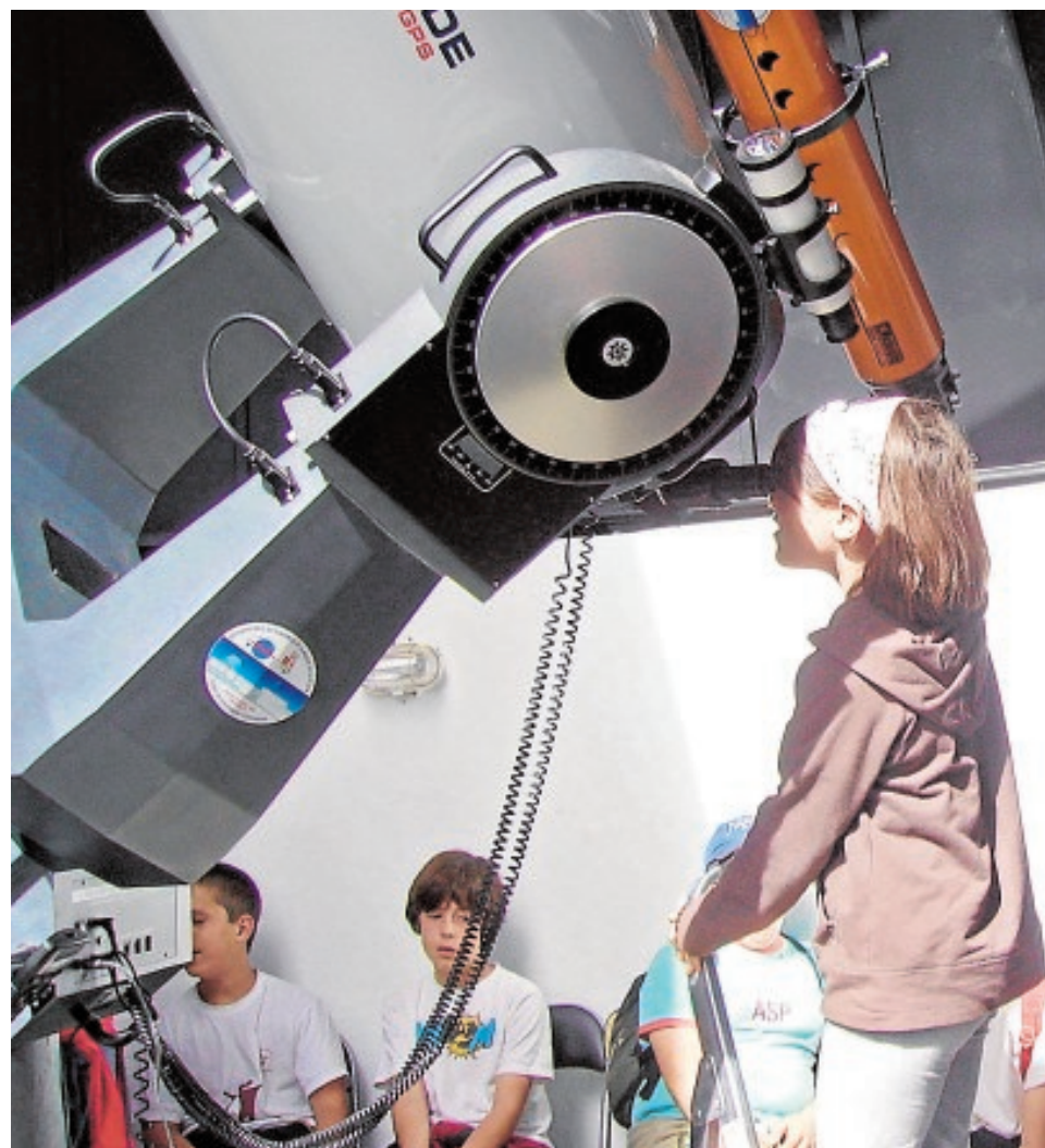
Imagen de archivo del Observatorio de Almadén cuando estaba abierto al público.

A principios de 2015, el PP publicó la licitación de la gestión del Observatorio por un periodo de 15 años, que ganó la Asociación Astronómica de España, y así se aprobó en un pleno dos días antes de las elecciones municipales. «Solo estaba pendiente de la firma del contrato, pero el PSOE entró en el Ayuntamiento y paralizó el proceso»,