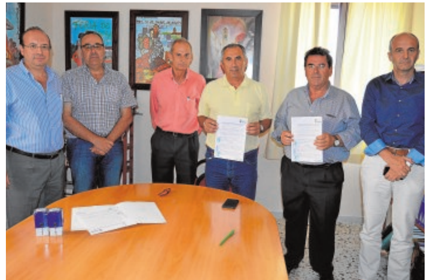
El alcalde de Pedrera, en el centro, tras la firma del contrato de obra ABC