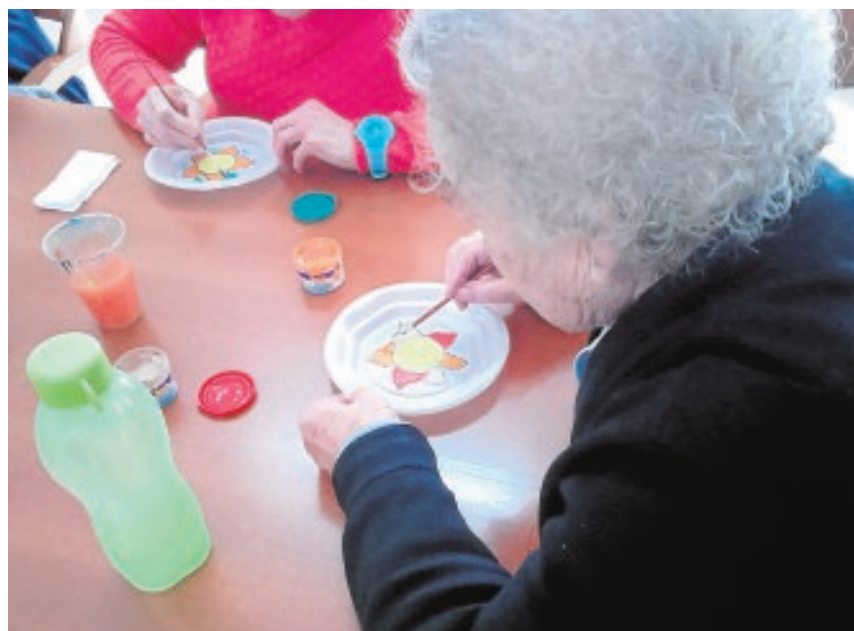
En el centro de la asociación se atienden de forma directa a 15 enfermos A.H.