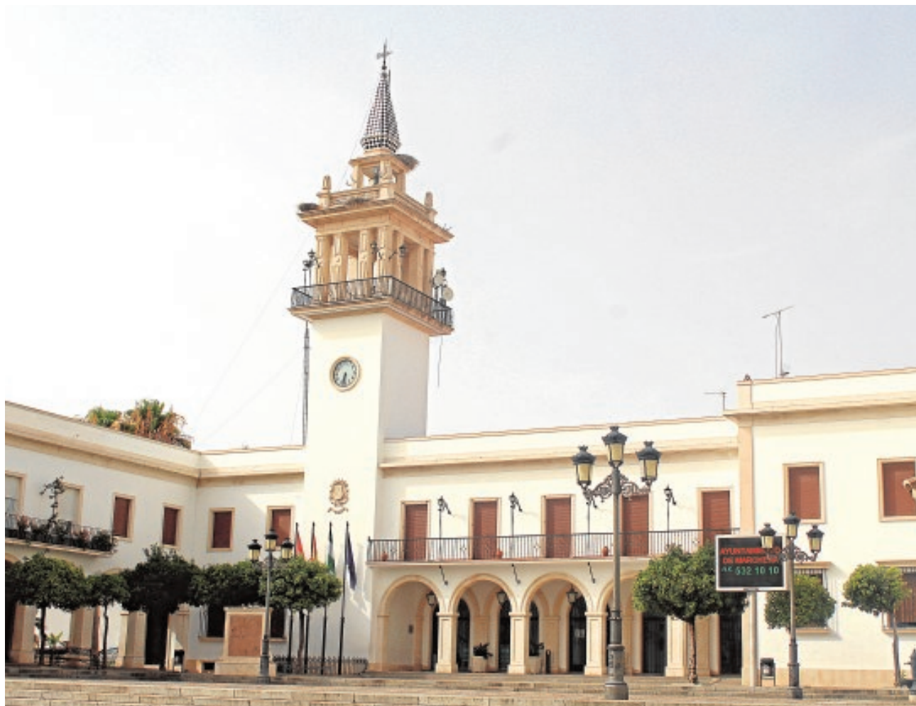
El Ayuntamiento de Marchena, en la imagen, es un gimnasio Pokemon en el mundo virtual