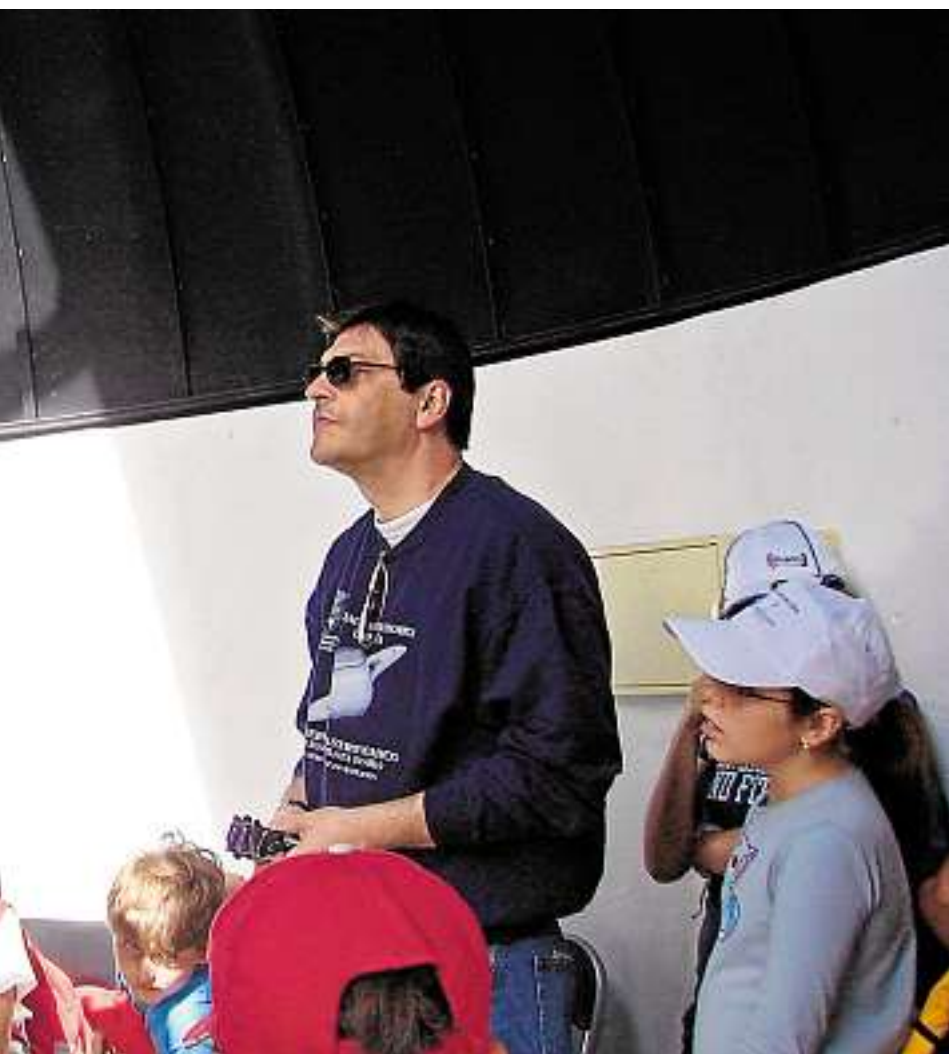
Estuvo operativo en dos períodos durante los que recibió miles de visitas

la piscina municipal desde el 27 de julio al 26 de agosto. Las inscripciones se harán por orden de llegada hasta agotar plazas. Hay cursos para bebés, menores y mayores con variedad de horarios de mañana y de tarde. A.C.