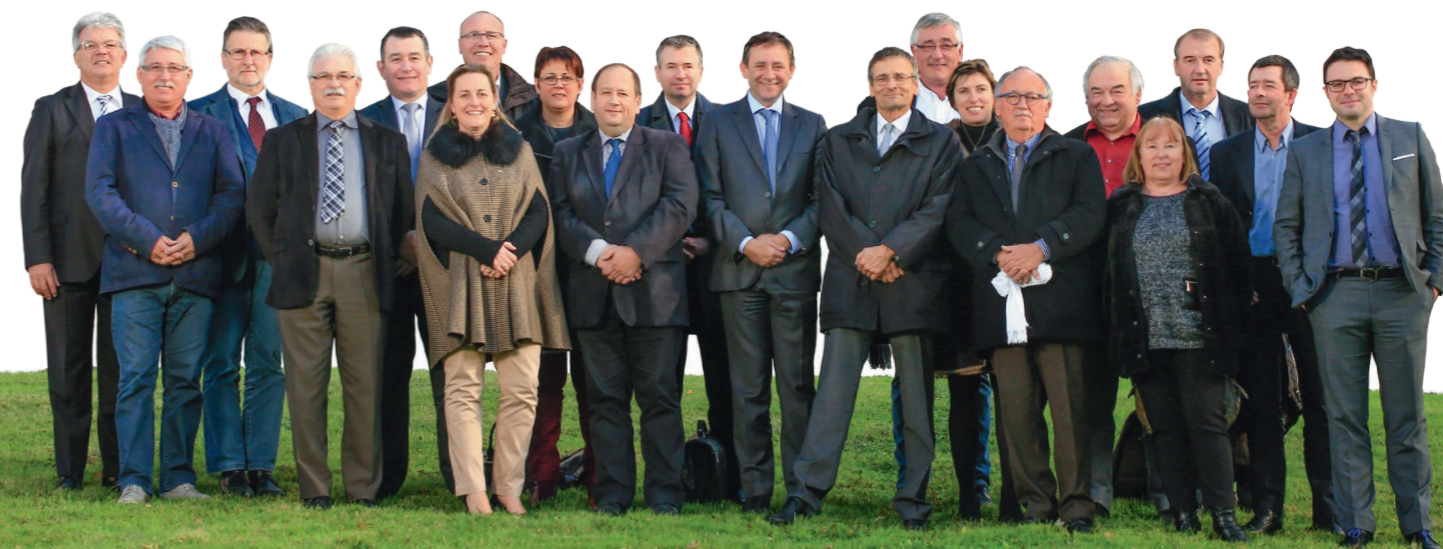
Les membres du Conseil d'Administration de la Caisse régionale Charente-Périgord.

Directeur de la Distribution et des Réseaux du Crédit Agricole Charente-Périgord