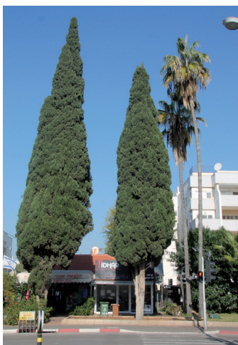
ישן וחדש ברחוב אחוזה

האיקליפטוס הוא עץ ירוק עד שהגיע לארץ מאוסטרליה כדי לייבש את הביצות, והם עשו זאת בהצלחה חלקית בלבד. ברעננה יש מקבץ של איקליפטוסים ב"ער הקטן" וברחוב מגדל ליד מגדל המים, במקום שהייתה המעברה בשנים הראשונות של המדינה. shinbet37@gmail.com