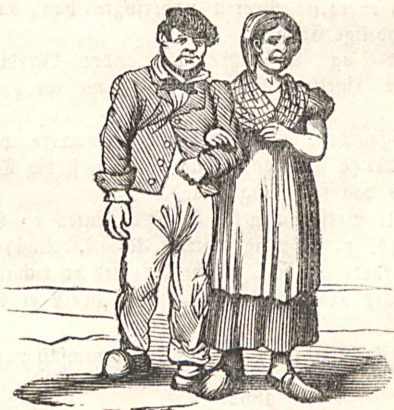
Et Par Rikereffefolk fra Ladegaarden der gaee ud en Søndagmorgen.

Af det Anførte vil man see, at paa Ladegaarden lever Armoden — af oekonomiske Grunde — sammen med Forbrydelsen, et Mafferskab, der dog ei er saa farligt, som det ved første Blik synes: Forskjellen mellem disse to Slags Beboere er meget hyppigt overmaade ringe. — Livet har efterladt Pletter hos dem begge.