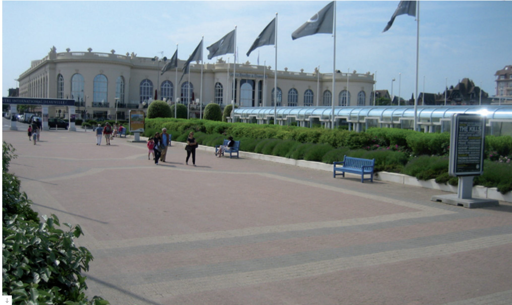
Projet : Parvis du Casino, Deauville (14) aux bords de plage - Architecte J. Garcia, Paris Matériaux : Pavés multi-formats Couleurs : Nuancé