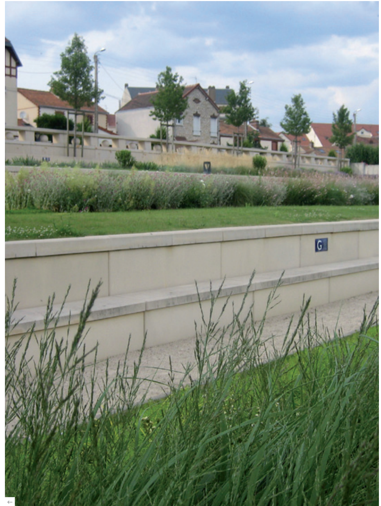
Projet : Réhabilitation des quartiers en périphérie de la cathédrale, Chartres (28) Matériaux : Assises et éléments de soutènement Couleur : Ton pierre