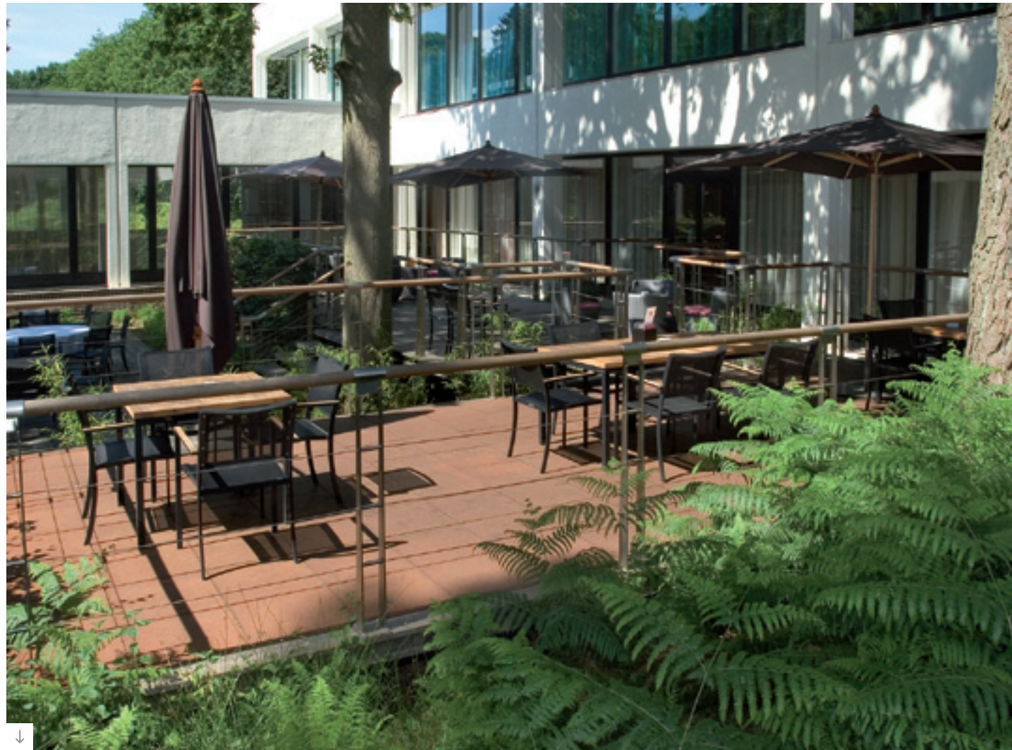
Projet : Création d'un milieu naturel en cour intérieure, Hôtel Dolce, La Hulpe - Bruxelles Matériaux : Dalles 50 x 50 x 6 cm Couleur : Acier corten