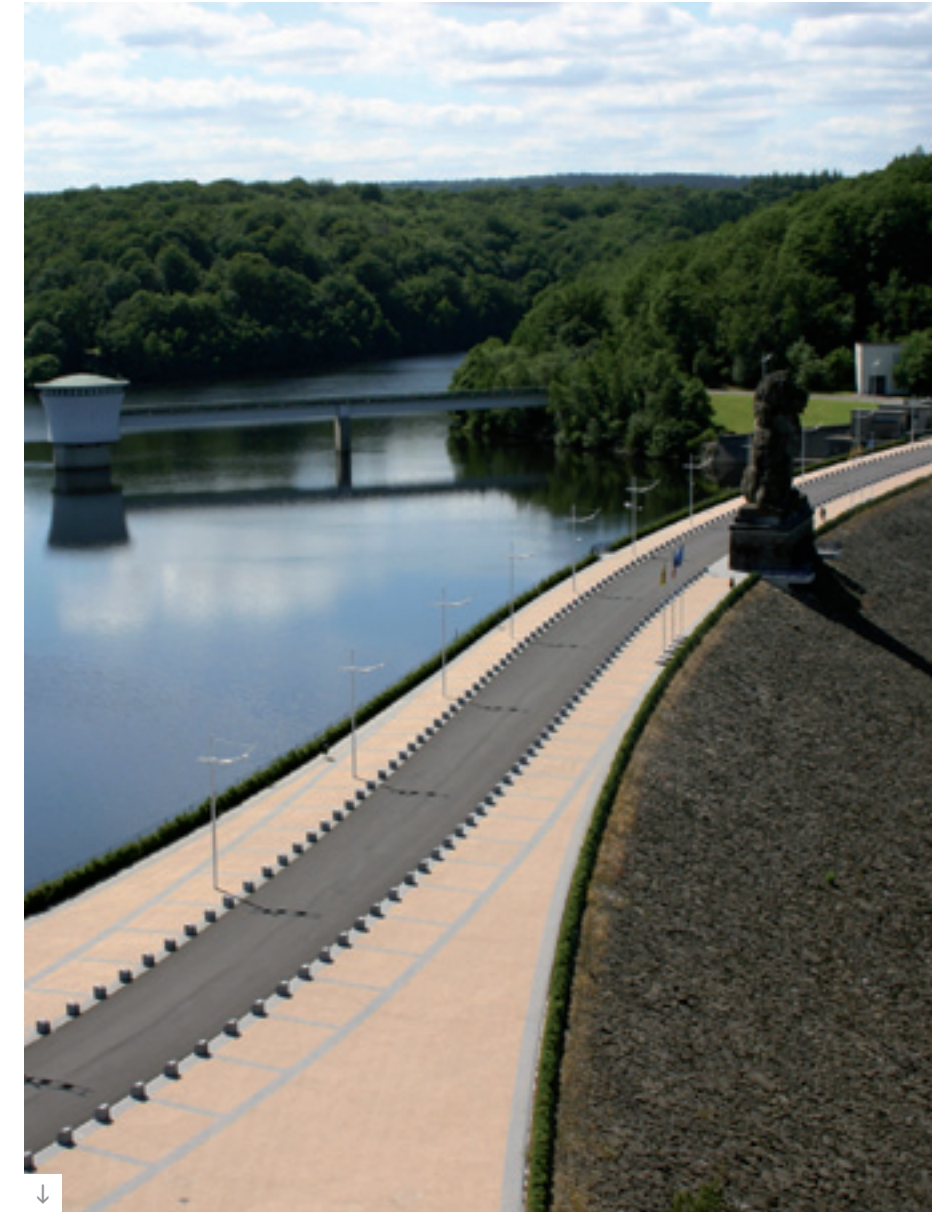
Projet : Voiries du barrage de la Gilleppe - Belgique Matériaux : Pavés 20 x 20 x 6 cm Couleur : Jaune bronze