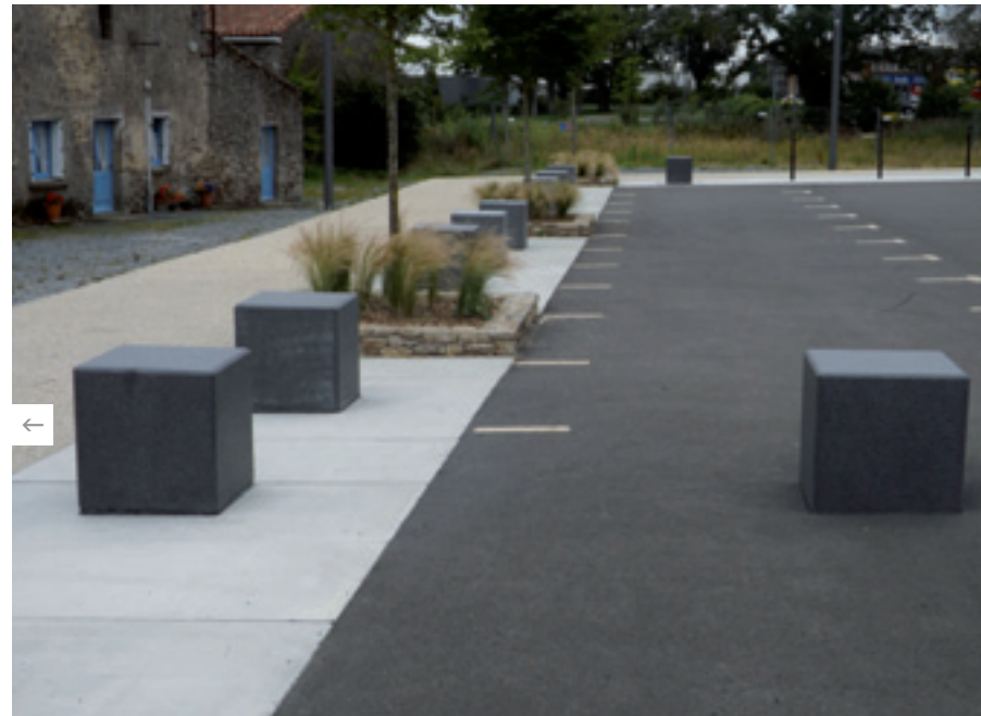
Projet : Place Buzen, Les Herbiers (85) - Architecte Format 6, Nantes Produits : Bornes d'éclairage, protection anti-graffiti et antisalissure Couleur : Gris anthracite