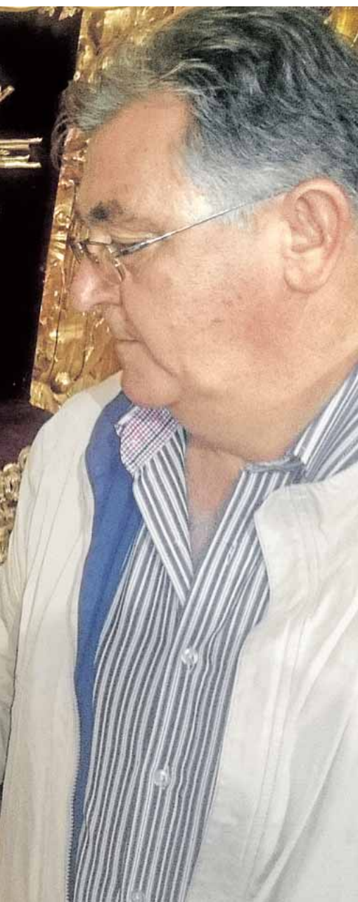
en que aparecieron en el altar mayor A.G.

bajo a unos 45 desempleados de la localidad. La inversión con que cuenta el programa ronda los 150.000 euros que se destinarán a desempleados con especiales necesidades sociales. El plazo de recogida y entrega de solicitudes está abierto hasta el 17 de junio.