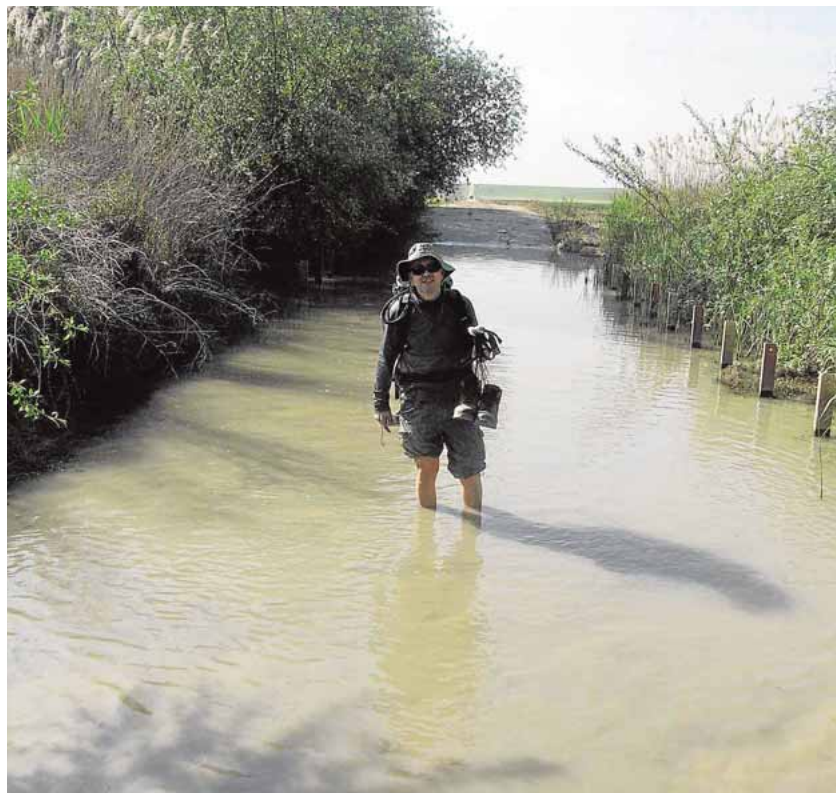
El vado del arroyo fuerza a los caminantes a sumergirse en las aguas