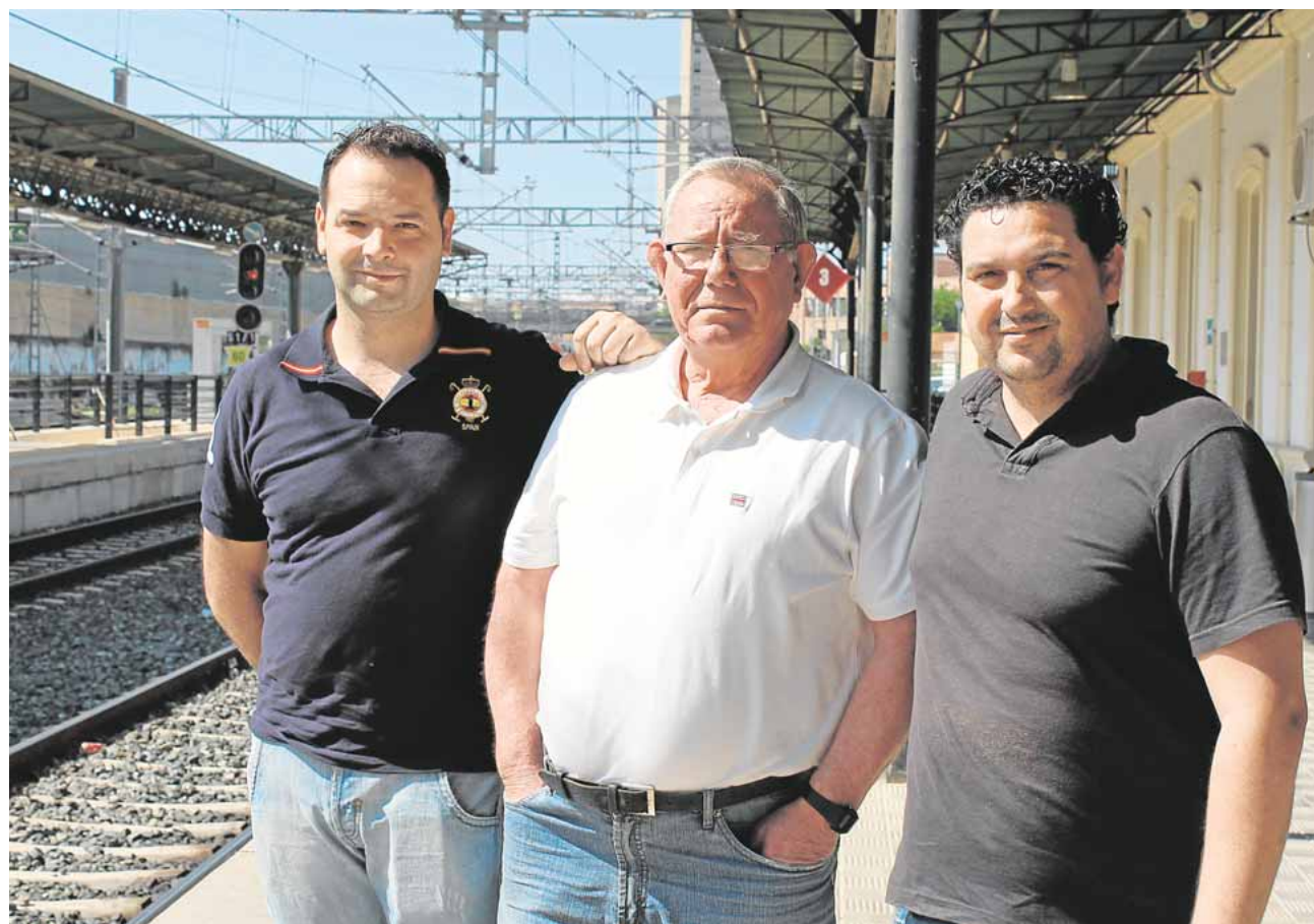
Los miembros de Acufer están convencidos de que Utrera no se entiende sin conocer la historia del tren

La asociación quiere realizar una gran maqueta donde se recreen todas las antiguas estaciones