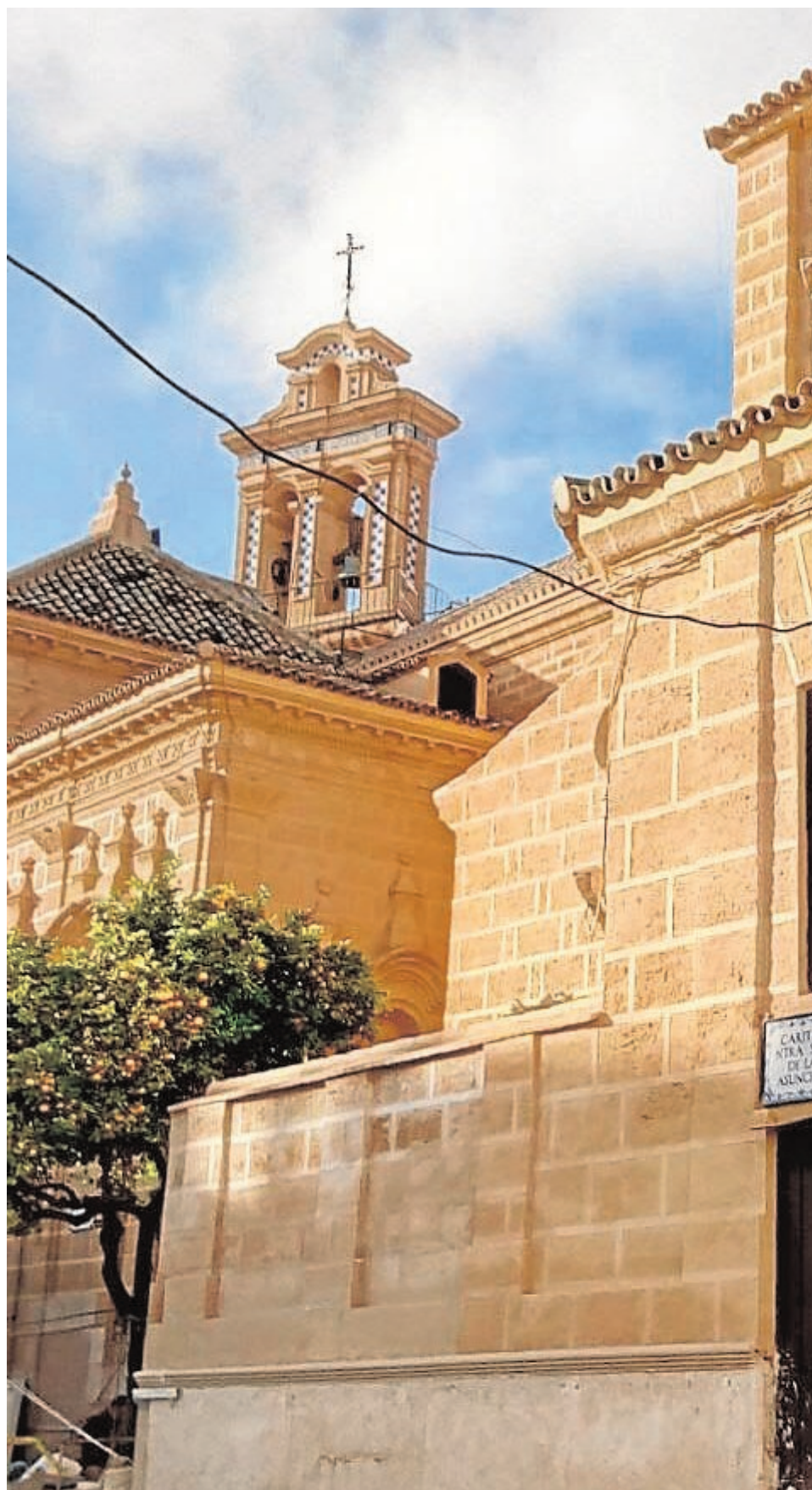
Vista de una parte de la fachada restaurada de la iglesia de Santo Domingo, en el centro de Osuna.

La vuelta a su templo El Dulce Nombre de Jesús y Jesús Caído trasladan las imágenes titulares de sus hermandades el jueves