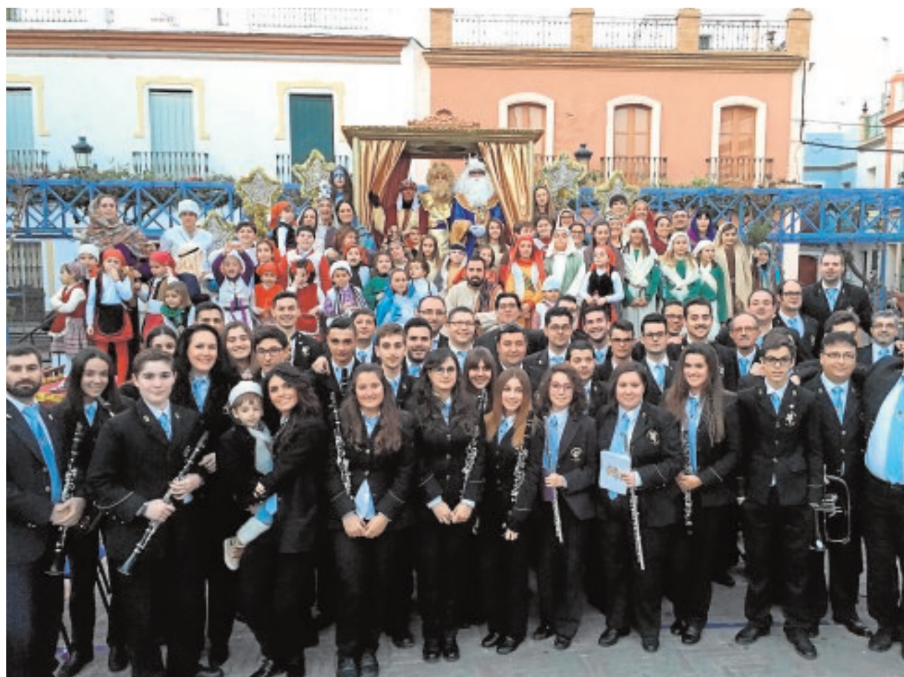
Los integrantes de la banda de la asociación musical legan el Belén Sinfónico a La Algaba junto a sus amigos