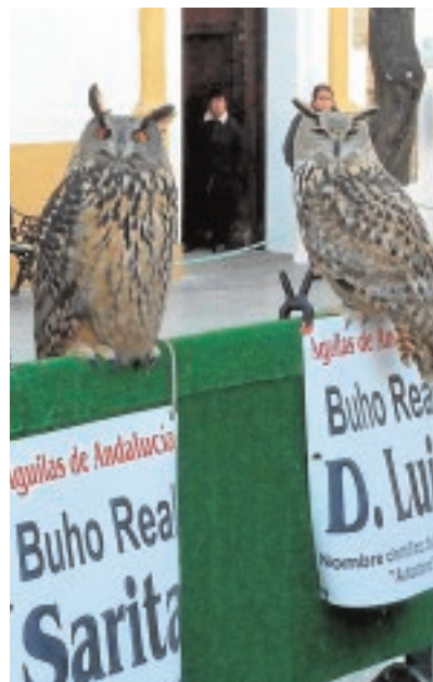
Buhos reales y otras aves se darán cita en El Pedroso G.J.L.

También se podrán realizar visitas a la iglesia de Consolación, con su capilla sacramental del siglo XVI, el Cristo del Buen Fin y la figura de la Inmaculada, atribuida a Martínez Montañés; al Museo de la Minería y la Historia de la Escritura, en el Centro de la Cultura Escuelas Nuevas; a la almazara de aceite de oliva, donde se podrá observar el proceso de molturación de la aceituna en plena campaña; y a la Casa Museo de Costum-