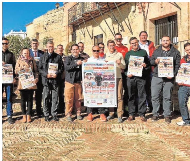
Presentación de la nueva edición del cross de atletismo

Dos propuestas de cocina innovadora se han hecho con el primer premio de la VIII Fiesta de la tapa de Osuna. El bar El Molinillo ha sido el ganador en la modalidad de tapa Gourmet caliente con su receta de Tallarines de choco con cebolla caramelizada y crema de Champiñones. En tapa Gourmet fría ha vencido la Tartaleta al oporto glaseada de la cafetería-cervecería Santa Ana. En una de las ediciones más reñidas de los últimos años, han sido galardonados con el segundo premio en tapa caliente El Bujío y con el tercero en tapa fría el bar La Esquina. Las dos tapas de Casa Paco han conseguido segundo premio en fría y tercero en caliente. B.M.