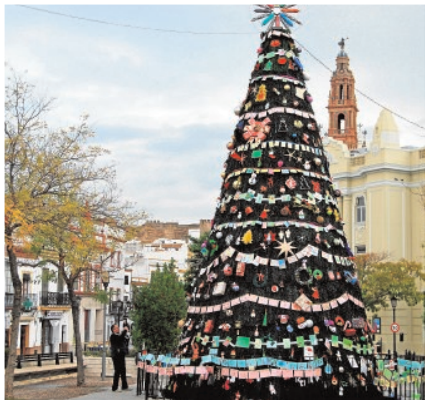
Un gran árbol realizado por escolares preside el Paseo del Estatuto

Así hasta completar más de 40 actividades entre las que también hay talleres infantiles, mercadillos, conferencias, presentaciones de libros o exposiciones artísticas como la que organiza la Peña «Los Tranquilotes» hasta el día 11 en el Ayuntamiento.