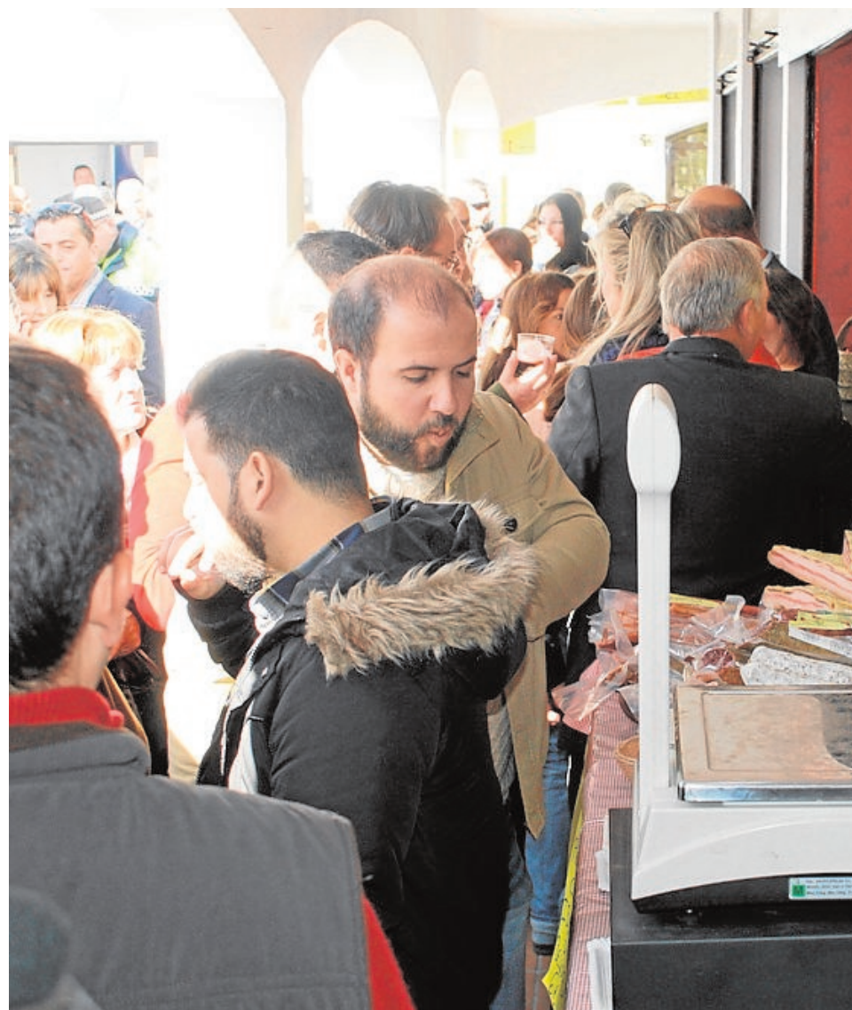
La XXI Feria de Muestras contará con 135 expositores de la Sierra Norte y otros pu...

En la muestra destacan la exposición gastronómica, compuesta esencialmente de productos cinegéticos, embutidos, setas, quesos, miel, o anisados y la exposición de artesanía, con trabajos de alfarería, manualidades, bordados, trabajos de mimbre y esparto, baldosa hidráulica y piel. La mayoría de los expositores proceden de la Sierra Norte, aunque también de otros