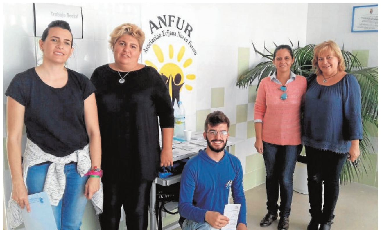
La asociación Anfur informa de sus servicios de apoyo en el nuevo centro de salud de Fuentes de Andalucía

Gracias al trabajo voluntario de padres y profesionales, Anfur está ampliando su sede para disponer de un espacio en el que los menores puedan realizar talleres creativos y relacionarse entre ellos.