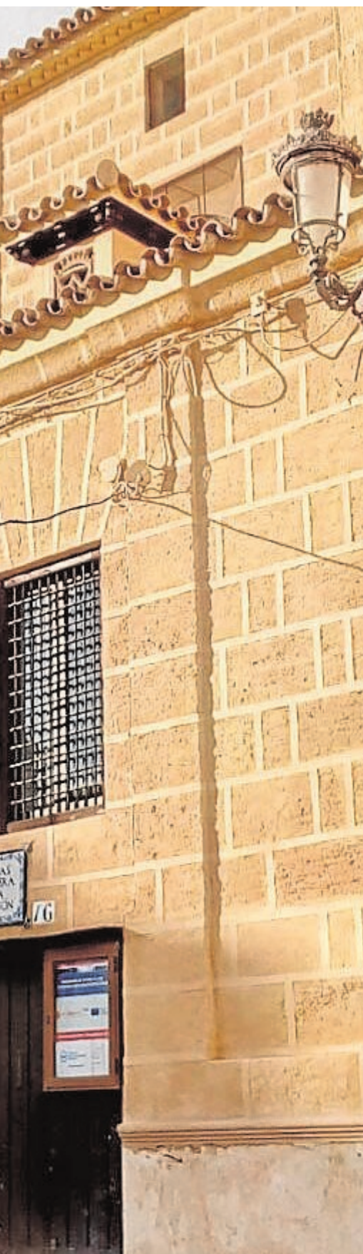
Centro de Osuna

canciones navideñas ofrecido por el coro rociero El Rebutito, de la localidad vecina de Herrera. También intervendrán el coro Veracruz y el grupo Rarezas. El concierto comenzará a las 20.30 horas, y su recaudación se destinará a Manos unidas. B.M.