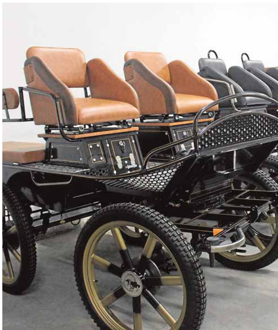
Los más vendidos son los tradicionales Marathon y Jardinera. En el círculo de la derecha

Noviembre es un mes tranquilo para Carruajes La Luisiana, pero con el comienzo del año, poco a poco empezarán a llegar los clientes que quieren estrenar o mejorar su carruaje de cara a la próxima primavera para la