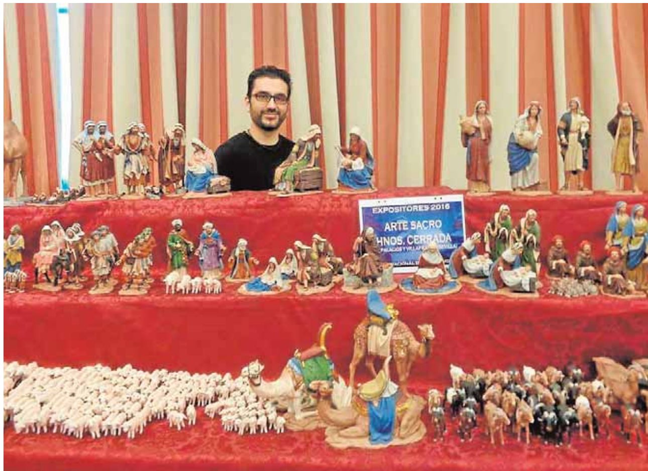
La empresa palaciega ha conseguido mucho prestigio en pocos años en el mundo belenista

Se trata de una obra dirigida a todos los públicos y que será interpretada a cargo de la Asociación Cultural de Teatro Escanpolo. Ésta dará comienzo a las 20:00 horas en el Salón de Actos del Ayuntamiento cigarrero. F.R.M.