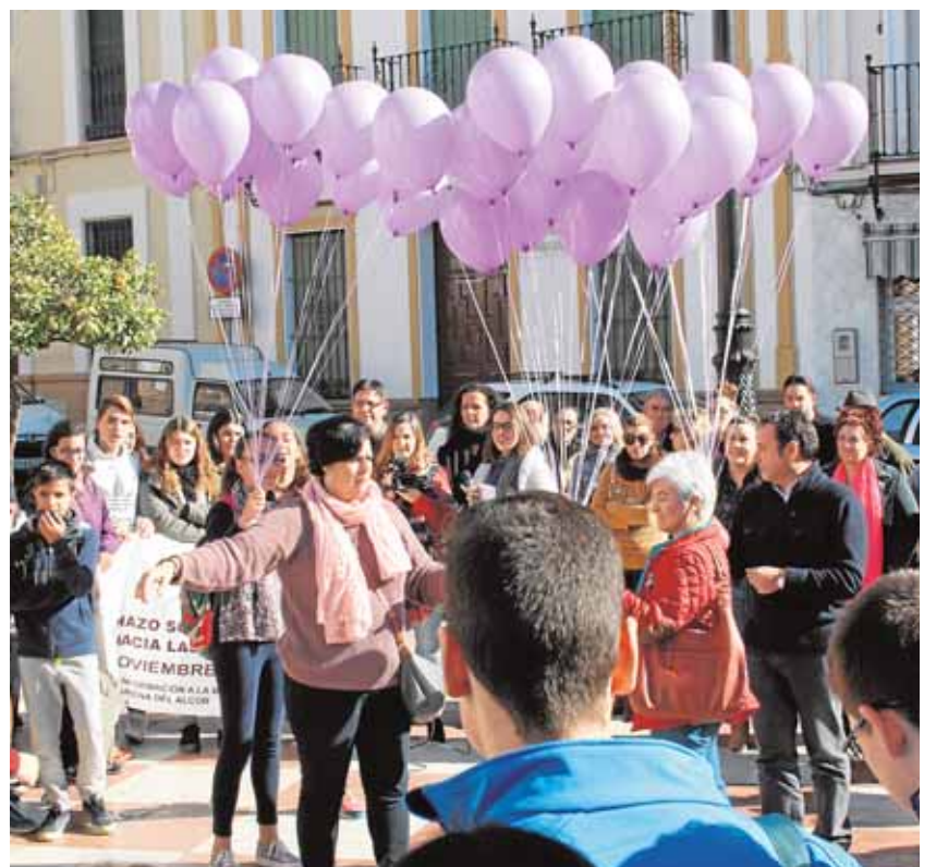
Mairena y Viso suman sendos programas contra la violencia machista ABC