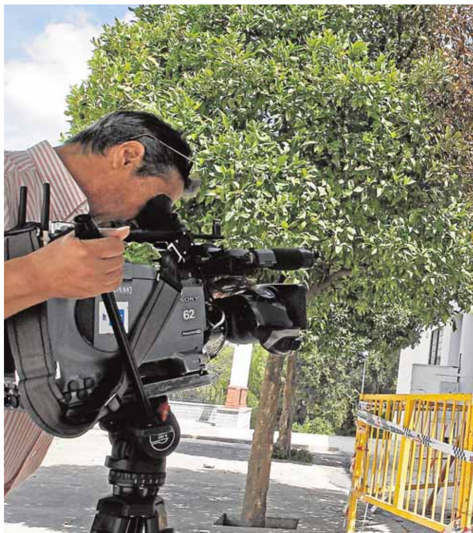
De las dos casas que ardieron en 2014 una (en la imagen) permanece tapiada. Los v

Inseguridad garantizada La familia acumula casi 300 denuncias por robos, tráfico de drogas y tiroteos con otro clan de Marinaleda