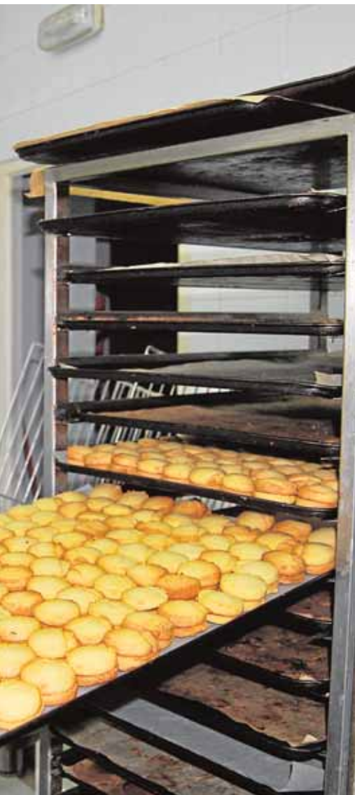
de España, Finlandia, Alemania y Austria A.M.

Sevilla. La cita, que debía inaugurarse en Morón de la Frontera el próximo día 26, ha modificado la fecha al 10 de diciembre, con lo que Mairena inaugurará el calendario la mañana del próximo día 3 de diciembre en el Pinar Espeso.