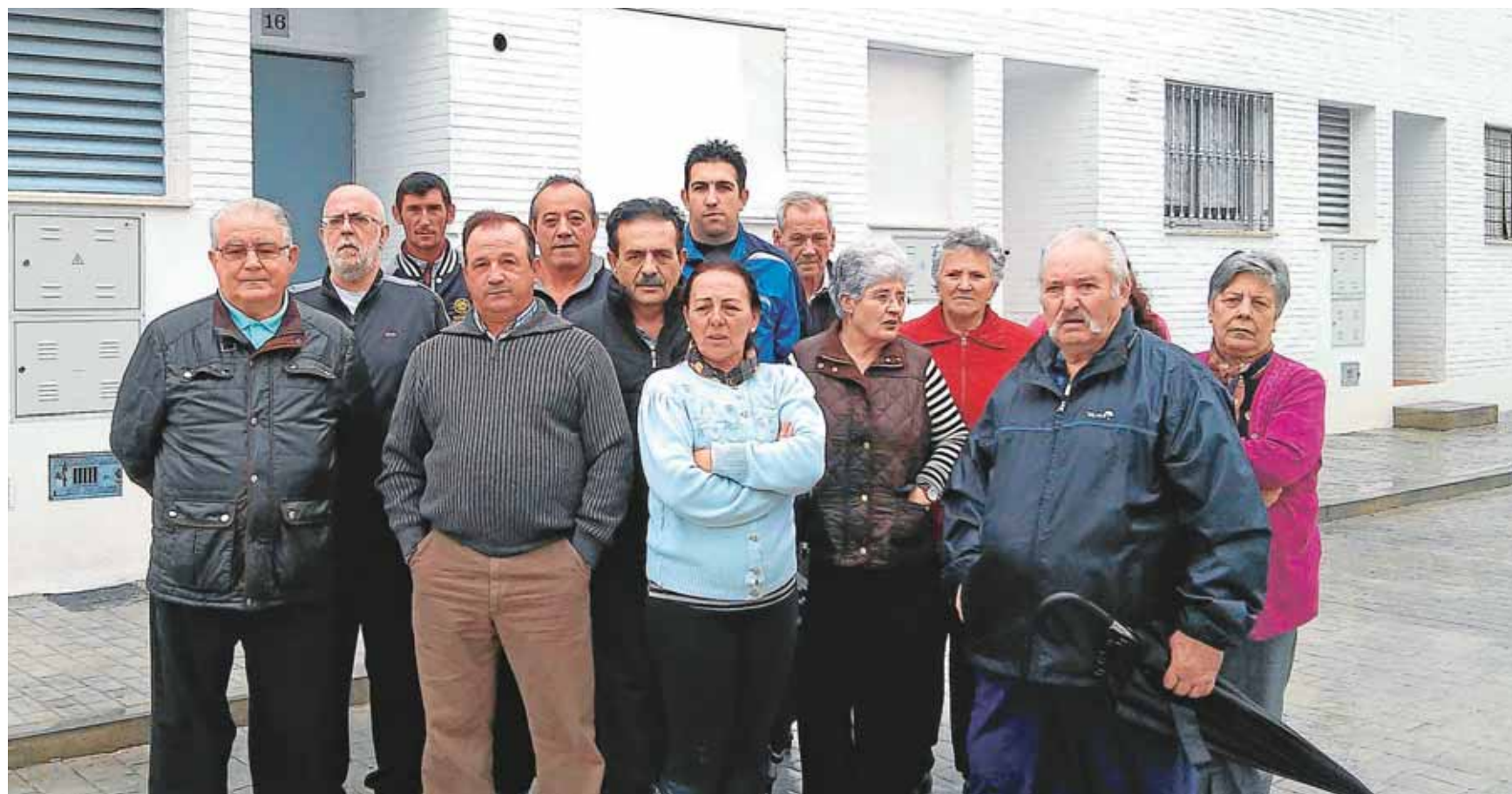
Vecinos de la barriada de los Poetas, en Estepa, frente a las casas que ardieron en 2014 y que ahora vuelven a ocupar las familias del clan de «los Chorizos»