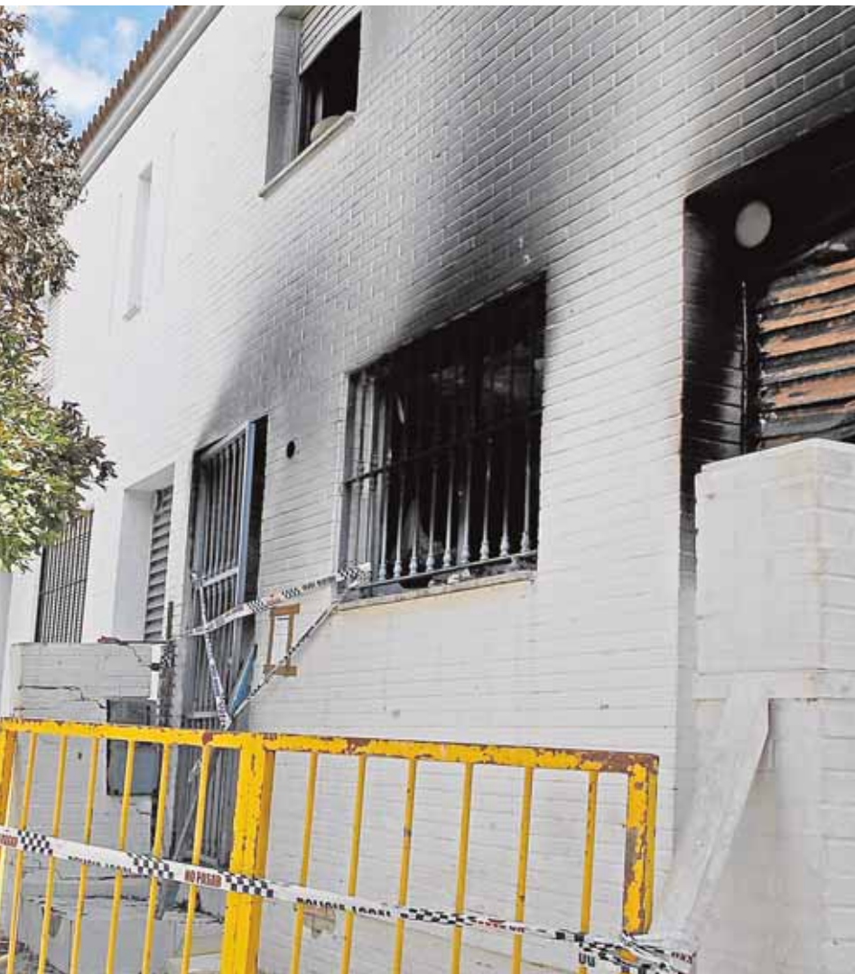
Vecinos están preocupados porque las llaves de la otra ya han sido entregadas

vecinos en los comercios de la localidad. Mañana a las 16.00 horas habrá una conferencia en el Teatro municipal Alberquilla en la que podrán participar todos los comerciantes interesados para decidir las actuaciones que se realizarán. B.M.