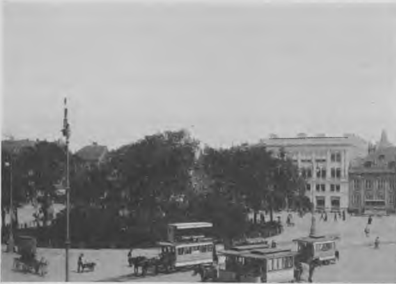
Kongens Nytorv i 1890'erne. I forgrunden to vogne fra Sølvgadens Sporvejselskab samt en af Korsgadeliniens vogne (den bageste). Den toetages »Ø-vogn« kører på stamlinien fra Trianglen til Frederiksberg Runddel. Den anden toetages-vogn, som ses til højre i baggrunden, hører til »Slukefter«-linien, der gik ad St. Kongensgade. Endelig skimtes til venstre bag beplantningen en af Frederiksberg Sporvejselskabs »røde omnibusser« (fra Strøgruten)

Scandiafabrikken i Randers. Til sammenligning tjener, at købesummen for sporvejenes nye »Düsseldorf-vogne« andrager op imod 500.000 kr. pr. vogn.