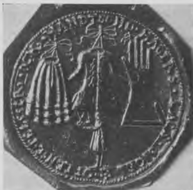
Odense pelsner- og handskemagerlaugs segl. Grandjean tavle 9 a