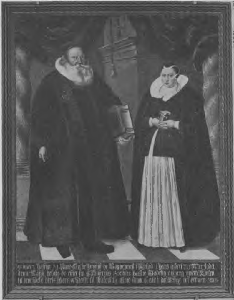
Provst Knud Lerches epitafium i Nysted kirke.