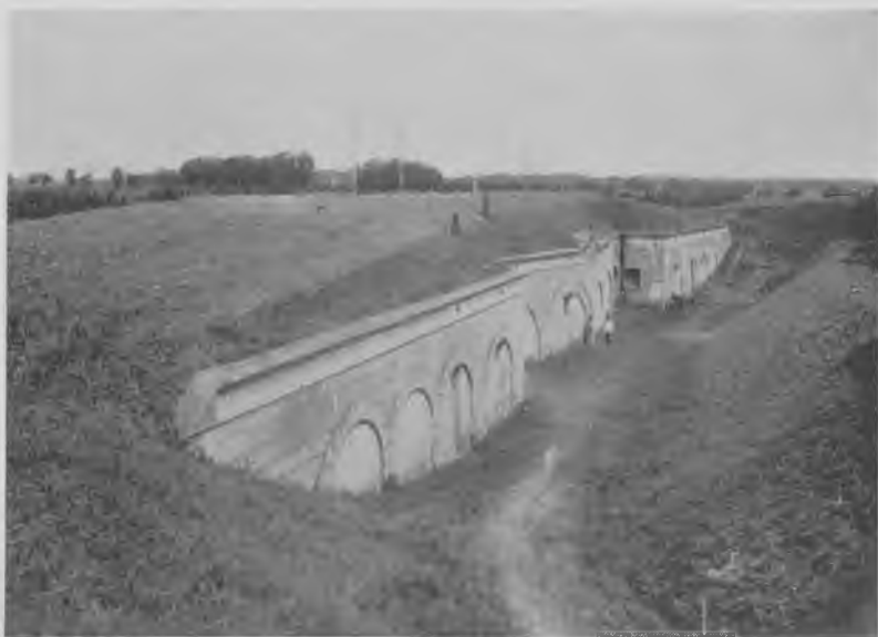
Vangede Batteri 1920. Batteriets hovedbestykning var anbragt bag volde på højre og venstre fløj af den her viste betonkerne, der rummer ammunitions- og mandskabsrum samt maskinskyts i forsvindingstårne til batteriets nærforsvar.

foretagende i forbindelse med et flådeangreb på København gennem Sundet, til også at kunne deltage i nordfrontens forsvar, specielt i Dyrehaven, og kom således til at udgøre det 6. fort i nordfronten, selv om det først blev opført i 1913-15, altså 20 år efter de fem andre.