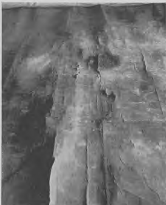
Kortets tilstand efter endt smidiggørelse i plasticposen og oprulning

umiddelbart før den nu i 1964 foretagne restaurering var dækket af et skjoldet og meget ujævnt fernislag.