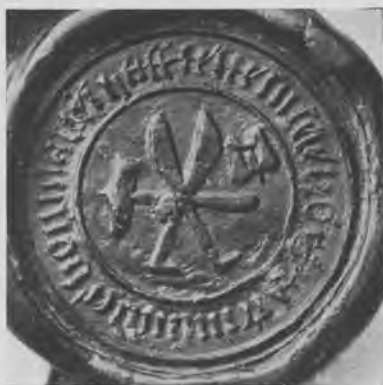
Segl brugt af Københavns remsnider- laug i 1525. Grandjean tavle 13 k