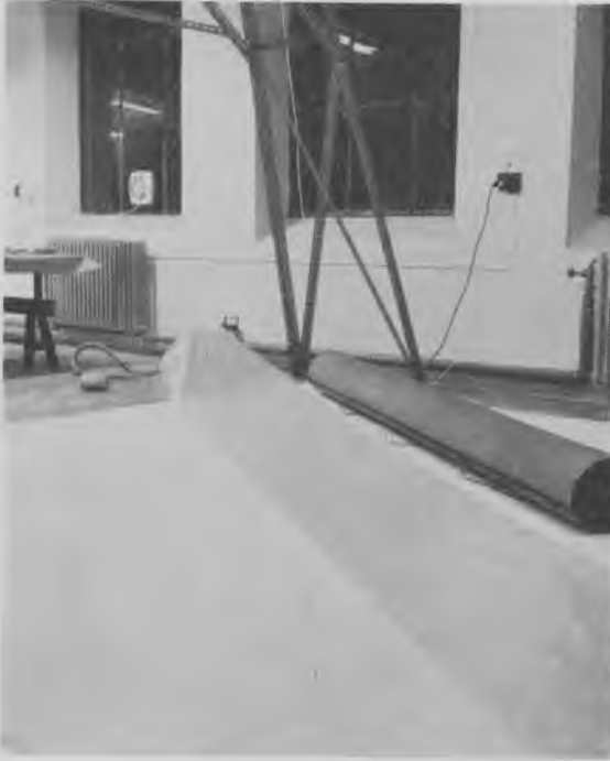
Kortet i sammenrullet tilstand, liggende ved siden af den til behandlingen konstruerede plasticpose

lang Aarrække, ligesom det efter den grundige Rensning igen er bleven tydeligt og brugbart. Men Fotograferingen lykkedes ikke, hverken for Generalstaben eller for Xylograf Hendriksen, som derefter eksperimenterede med det, og Udførelsen af en haandtegnet Kopi af Kortet viste sig at ville blive saa bekostelig, at den i hvert Fald for Øjeblikket maatte opgives. Trangen til en saadan er ej heller saa stærk nu, da det originale Kort efter Restaureringen atter er blevet stærkt og brugbart«.