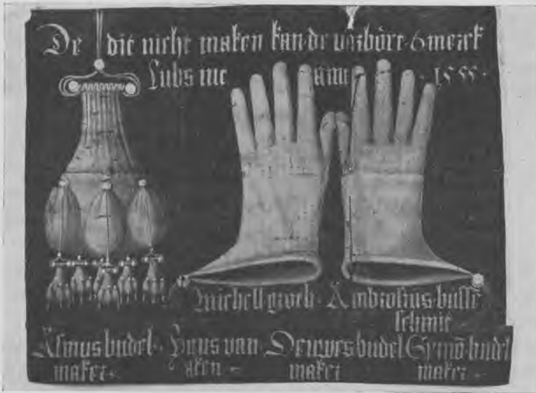
Assens handskemageres vedtægt 1555. Viser mesterstykket: en pung og et par handsker. Den plattyske inskription foroven betyder: Hvo som ikke kan lave dette, har forbrudt 6 mark lybsk til lauet. Pergamentblad i Nationalmuseets 3. afd.

tids dragter ikke havde lommer. Hvad man ønskede at have på sig, måtte man bære i en pung eller pose, som var fastgjort til bæltet. Det er først ind i det 16. århundrede, at lommer bliver almindelige, og pungmagerne dermed i nogen grad gøres overflødige. I løbet af det 17. århundrede forsvinder betegnelsen pungmager, og de håndværkere, som tidligere også havde lavet punge, fremstiller derefter kun handsker.