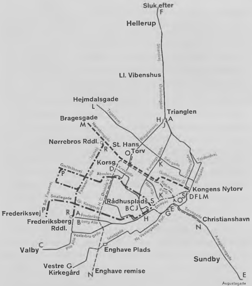
Oversigtskort over linienettet ved århundredskiftet, de fedt optrukne stiplede eller punkterede linier angiver elektrisk drift