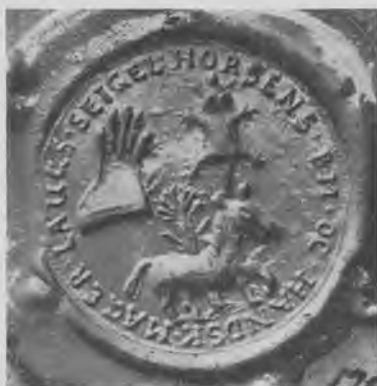
Horsens buntmager- og handskemager- laugs segl. Grandjean tavle 8 i