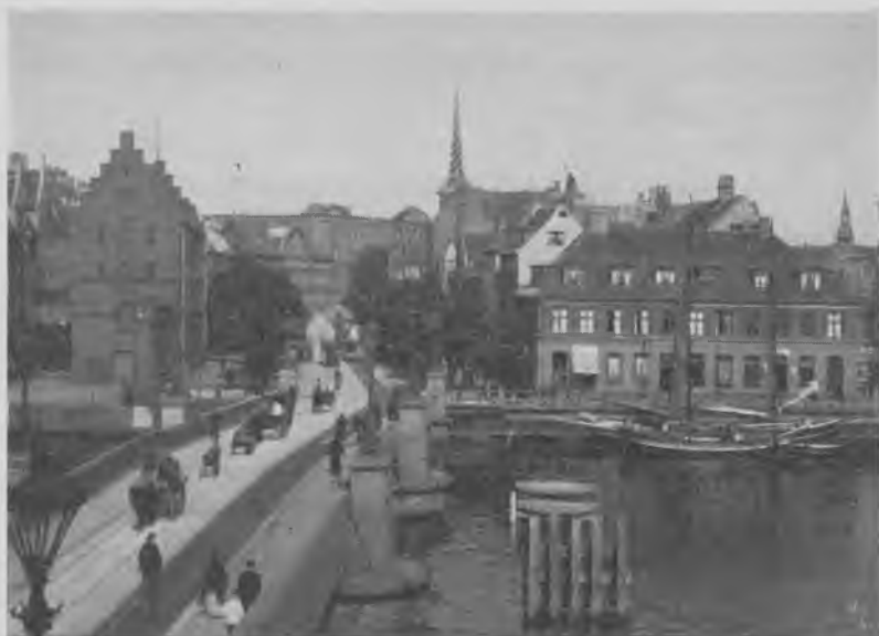
Vogne fra Christianshavn-Sundbylinien i Slotsholmsgade (bemærk den gamle Knippelsbro)

vejsdrift, at selv de længste linier kun havde een udgangsposition. Som følge deraf kom første afgang fra liniens andet endepunkt til at ligge meget sent. Medens der fra Frederiksberg Runddel som nævnt kørtes fra ca. kl. 7, henholdsvis til Trianglen og Sundbyerne, måtte Østerbros beboere vente til kl. 8, før driften kom i gang, og Sundbyernes til kl. 7 50 .