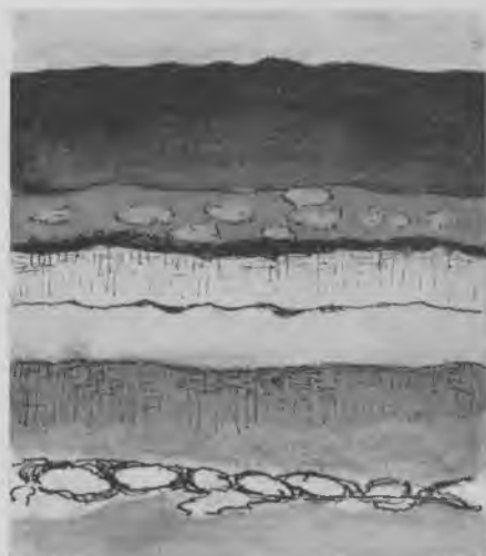
Foto af mikrosnit der viser kortets papirlag (forstørrelse 100 gange). Snit nr. A. 25