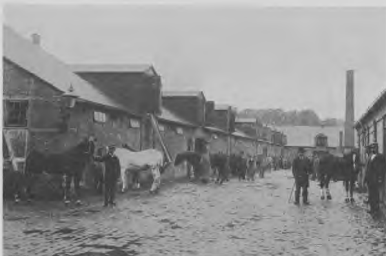
Det københavnske sporvejselskabs stalde i Allégade. Sporvejsdirektøren inspicerer hestebestanden

syge eller »behøvet skånsel«. Dagspræstationen for de tjenstdygtige heste opgøres til 2,4 mil. Det lyder ikke af meget, men af de foran omtalte grunde var tjenesten særdeles krævende (selv om der var i hvert fald 5 eller 10 minutters hvilepause ved endestationerne).