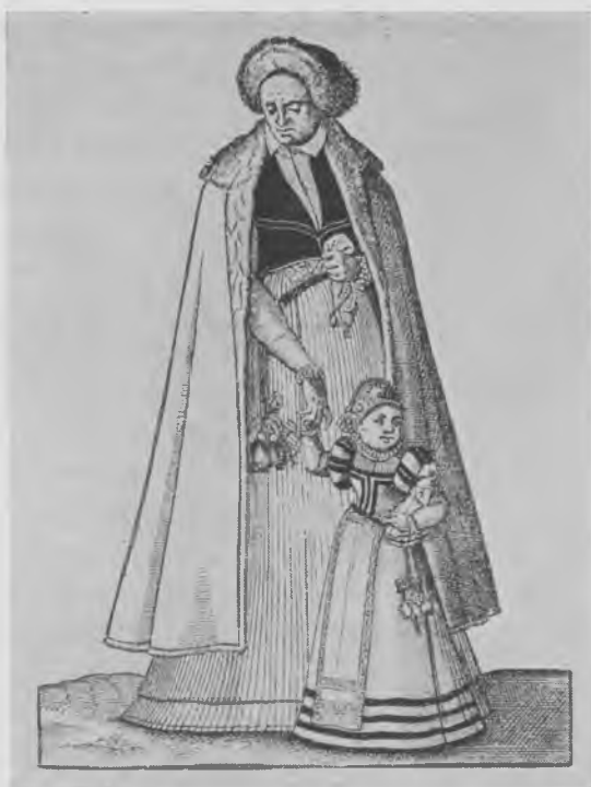
Kvinde- og pigedragt fra 1570'erne. Pungen ses hængende i bæltet. Træsnit af Jost Amman i Hans Weigel: Trachtenbuch. Nürnberg 1577. Her efter Gustav Bang i Europas Kulturhistorie bd. II, 1899, s. 50

da syet handsker. Deres egentlige arbejde har dog været at sy kjortler og klædninger, hvilket fremgår af bestemmelserne vedrørende deres mesterstykke, f.eks. i artiklerne af 1495.