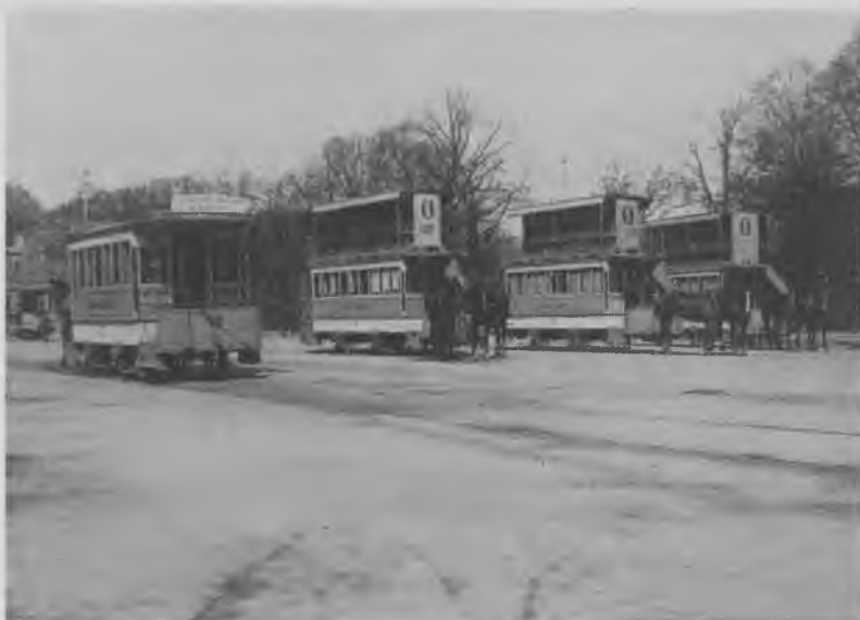
Sporvogne på Frederiksberg Runddel i slutningen af 1890'erne. Den lille eenspændervogn i forgrunden til venstre kørte ad Pilealleen og Vesterbrogade, som det ses på skiltet. I baggrunden ses en af de frederiksbergske elektriske sporvogne, der kørte til Nørrebros Runddel ad »Tværlinien«, som ruten hed

dredtusinder skal befordres af en dertil svarende stor funktionærstab (selv om der trods alt er reminiscenser af gamle dages mere personlige omgangsformer). Som det hedder i en gammel beretning fra det københavnske selskab, havde sporvejspersonalet mange velyndere, der påskønnede de hyggelige køreture og ikke var bange for at yde en skærv, når sporvejsfolkernes understøttelsesforeninger holdt fester i velgørende øjemed og appellerede til stampassage-erne.