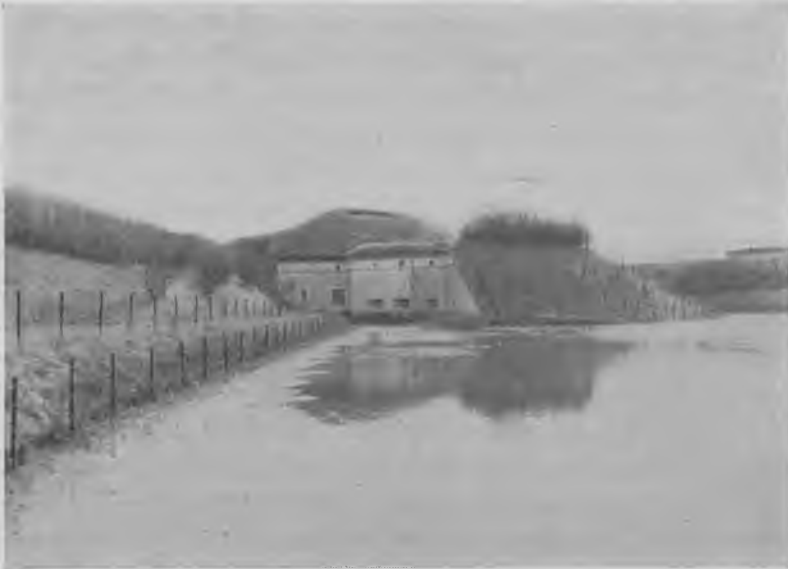
Enkeltkaponière i Vestenceinten 1918. Pigtrådshegnene træder tydeligt frem og fortæller, at enceinten endnu er fuldt armeret. Bevoksningen på voldskråningerne udgøres af vildtjørne, der blev plantet, før pigtrådshegnet blev udformet, som militært hindringsmiddel

på den side af graven, der vendte mod fjenden, men uset af denne. Dette var af betydning, dels for vagttjenesten i forterrainet, dels i tilfælde af udfald fra forsvarernes side. Færdselen over graven foregik dels gennem de permanente gennemskæringer med tilhørende broer, således for de eksisterende hovedlandeveje, Vest- og Frederikssundsbanens og nogle mindre amtsveje vedkommende, dels ad nogle mindre broer, udelukkende for fæstningspersonellet, enten i forbindelse med mindre voldgennemskæringer eller gennem såkaldte poterner, tunneller gennem volden, som især anvendtes i forbindelse med adgangen til dobbeltkaponièrerne.