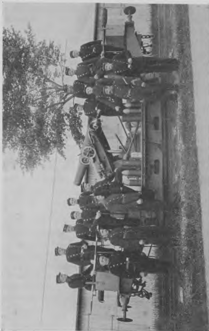
Batteritogsvojn med 15 cm kort kanon, bejjeningsmandskab og kanonkommandør (sergent), ca. 1904. Billedet er taget foran batteritogs-magasinet, en bølgebliskremise bag Vestenceinten noget nord for Roskildevej. Batteritoget bestod af seks sådanne kanonvogne, trukket af damplokomotiv