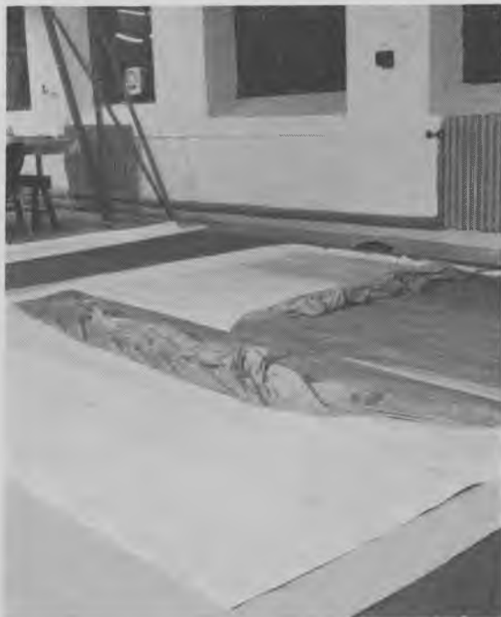
Kortets bagside under fjernelse af bagsidelærredet, der, som det fremgår, var påsat i to stykker

flere steder og meget mørkebrunt«. Da det jo hermed syntes at være umuligt at restaurere kortet forsvarligt, lod man yderligere Stadsarkivets fotograf M. Falk-Sørensen i 1943 affotografere kortet for at sikre det for eftertiden. Denne fotografering var uhyre vanskelig og måtte foretages på særlige, infrarødt sensibiliserede plader, og i små partier på nøjagtig 17×23 cm, hvilket ialt nødvendiggjorde 196 optagelser.