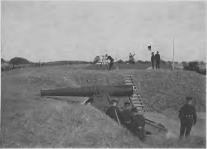
Batteristandplads (Harrestrup Bateria) på Vestenccinten ca. 1905. I forgrunden ses en af batteriets fire 15 cm kanoner i »høj voldlavet«. I baggrunden Husum mølle og Frederikssundsvejens træer. På traversen batteriets officerer, en ved kikkertobservation

udgravet plads til oppe på selve volden på forskellige punkter af denne, hvor der for fleres vedkommende i forvejen var indbygget skudsikre ammunitionsmagasiner med fornødne ophejsningslad til granater og ladninger. I voldens profil indgik iøvrigt, regnet fra den mod byen vendende side først jernbanesporet, så voldgaden, den »landevej«, der fulgte hele stillingen. Derpå nogle ramper op til »voldgangen«, hvor man kunne færdes uden at blive set udefra, og hvorfra der igen førte ramper op til batterierne, hvor kanonerne stod fire og fire, notabene, når fæstningen eller afsnittet klargjordes, for til daglig stod de nede i de såkaldte skytsmagasiner bag hovedvolden for at være beskyttet mod vejrliget.