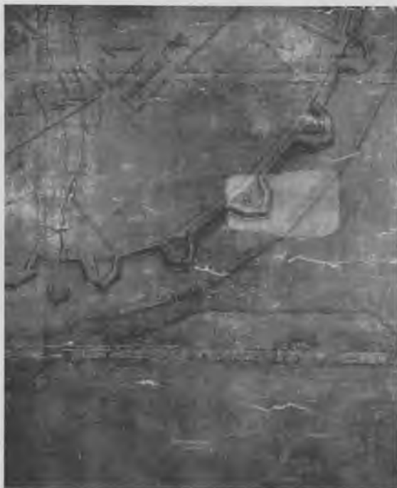
Den første rensprøve af kortet efter opdamning af de værste partier blændet fernis

Bindingen var god for den udtagne prøves vedkommende og syntes at være stabil for hele kortet. Umiddelbart under kartonen fandtes det lærred, hvorpå papirlagene var opklæbede, og som er kortets bagside. Bindingen var her, i modsætning til de andre lag, yderst slet. Lærredet var meget tyndt og i en dårlig bevaringstilstand, d.v.s. mørnet, stift og nedbrudt som følge af for limstærk imprægnering, hvilket igen har været medvirkende årsag til de store knæk i kortet, forårsaget netop af dets store stivhed. Sandsynligvis er, under en gennemgribende restaurering af kortet i forrige århun-