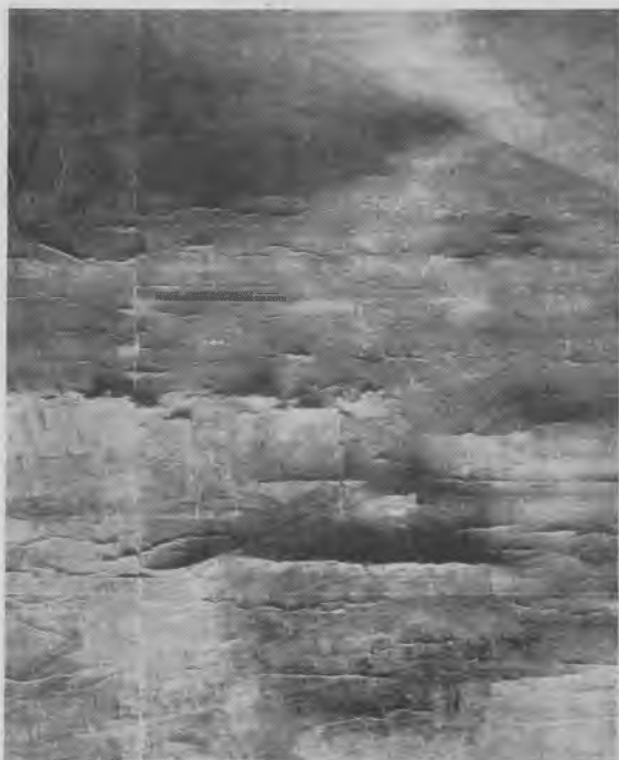
Kortets revnede og opskallede tilstand før fastlægning og vacuumbehandling. I venstre side ses en lodret revnedannelse, der strakte sig fra over- til underkant af kortet