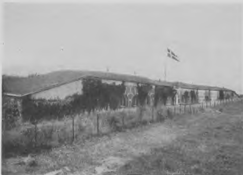
Bagsværd Fort 1920. Fortets bestykning ses ikke (den kan allerede være fjernet). Den var fire 12 cm kanoner i tårn plus fire tilsvarende i kaponiérerne såvel til gravforsvar som til mellemskydning (mellem forterne).

bestod af 15 cm og 12 cm og 75 mm kanoner, til nærforsvaret 75 mm og mindre kanoner samt maskinskyts (se i øvrigt side 127). Besætningerne udgjordes i forterne, som på nordfrontens øvrige værker, af Fæstningsartilleriregimentets 2. bataljon og dertil de før-omtalte frivillige maskinister og rekylskytter.