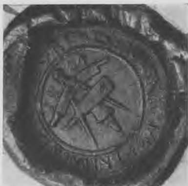
Københavns remsniderlaugs segl 1584. Grandjean tavle 13 l