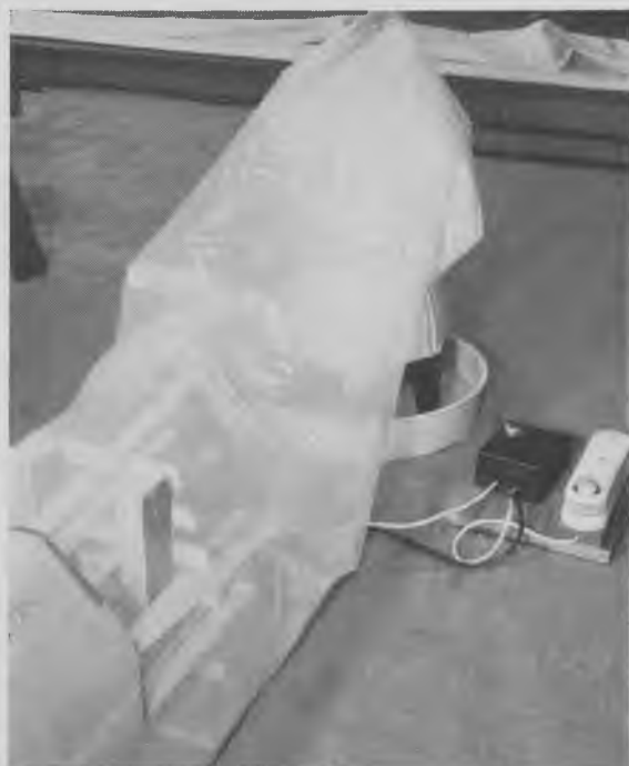
Kortet i plasticposen under tilførsel af fugtmættet luft. For enden af posen ses det tilkoblede luftfugtningsapparat, på gulvet de regulerende apparater