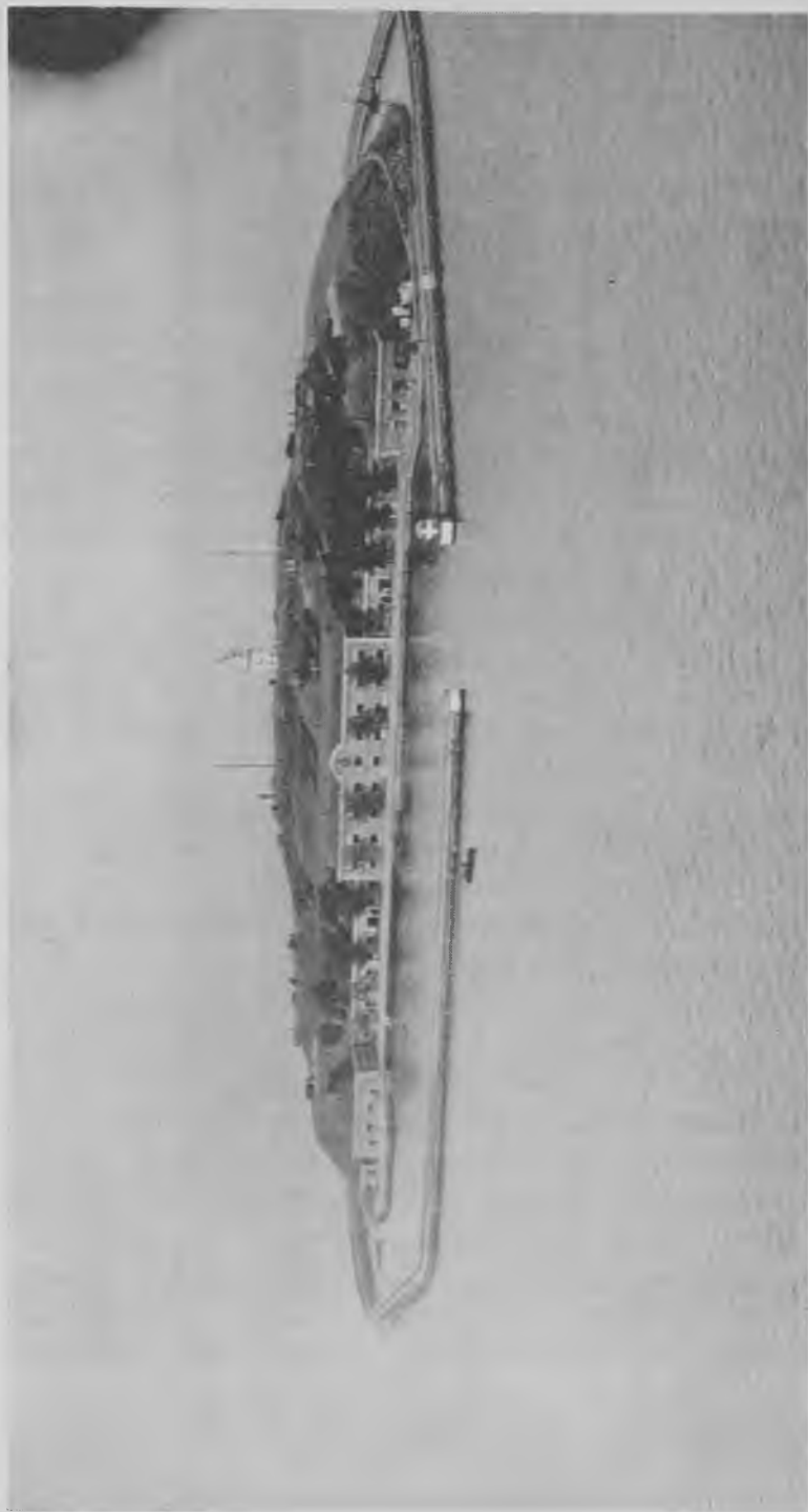
Middelgrund's Fort ca. 1930. Fortet opførtes 1890-95 som en kunstig ø på 7 à 8 m vanddybde lidt nord for den egentlige Middelgrund. Fortets areal indenfor bølgebryderne er 7 ha, selve fortoen 4 ha. Bestykningen bestod i 1918 af 36 kanoner. Krigsbesætning ca. 800 mand