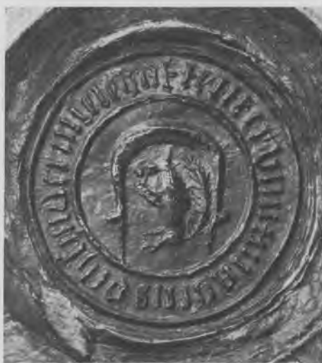
Segl brugt af Københavns buntmager- laug i 1525. Grandjean tavle 4 f