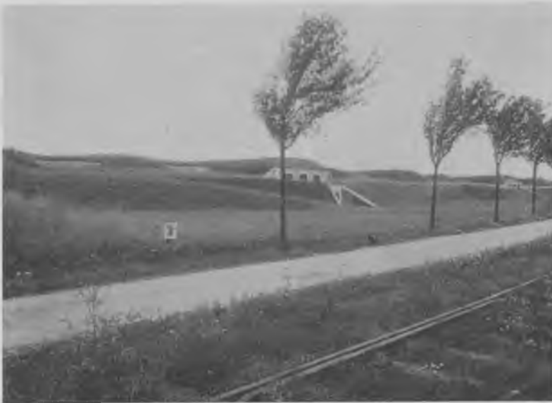
Parti af Vestenceinten 1920 (Hvissinge Batteri). Man ser enceintespoet, voldgaden og ramperne op til voldgangen samt de mure (»formure«) i brystværnet, bag hvilke kanonerne var anbragt. Foto i Art. Bibliotek

grundridset var den regelmæssigt brudte frontlinie med i alt 23 »fronter«, der hver kunne flankeres (beskydes på tværs af angrebsretningen) langs gravens vandspejl fra særlige betonkonstruktioner (kaponièrer), der var indbygget i brudpunkterne. Bag hele den sammenhængende vold gik der en kørevej, og langs hovedparten af den et jernbanespor, der var i forbindelse med Vestbanen, og som muliggjorde dels personel- og materieltransport langs fronten, dels anvendelsen af et batteritog. Batteritoget bestod af flade blokvogne med kanoner på, det hele forspændt et lokomotiv, der let kunne flytte batteritogets seks kanoner til det punkt på fronten, hvor man måtte ønske særlig kraftig artilleristøtte.