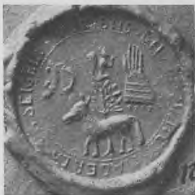
Horsens buntmager- og handskemager- laugs segl. Grandjean tavle 8 h