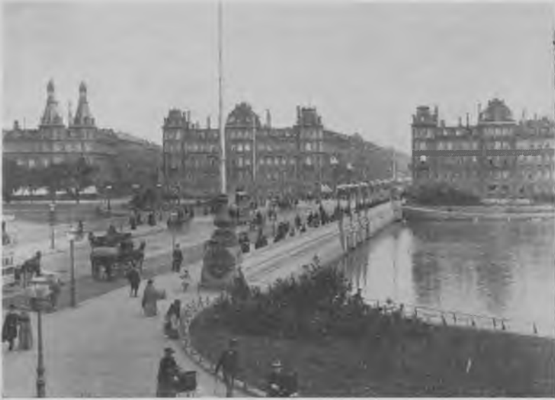
Sporvogne fra Nørrebroes Sporvejselskab på Dronning Louises Bro

som stamlinie, svarende i hovedsagen til den nuværende linie 1, men af det i 1867 stiftede »Nørrebroes Sporvejselskab«, der trafikerede Nørrebrogade, Frederiksborggade og Gothersgade med Kongens Nytorv som endepunkt. Her indsattes der akkumulator-drevne vogne, der vel frembød betydelige driftsmæssige fordele, men som led af den skavank, at de udviklede en ubehagelig syrelugt.