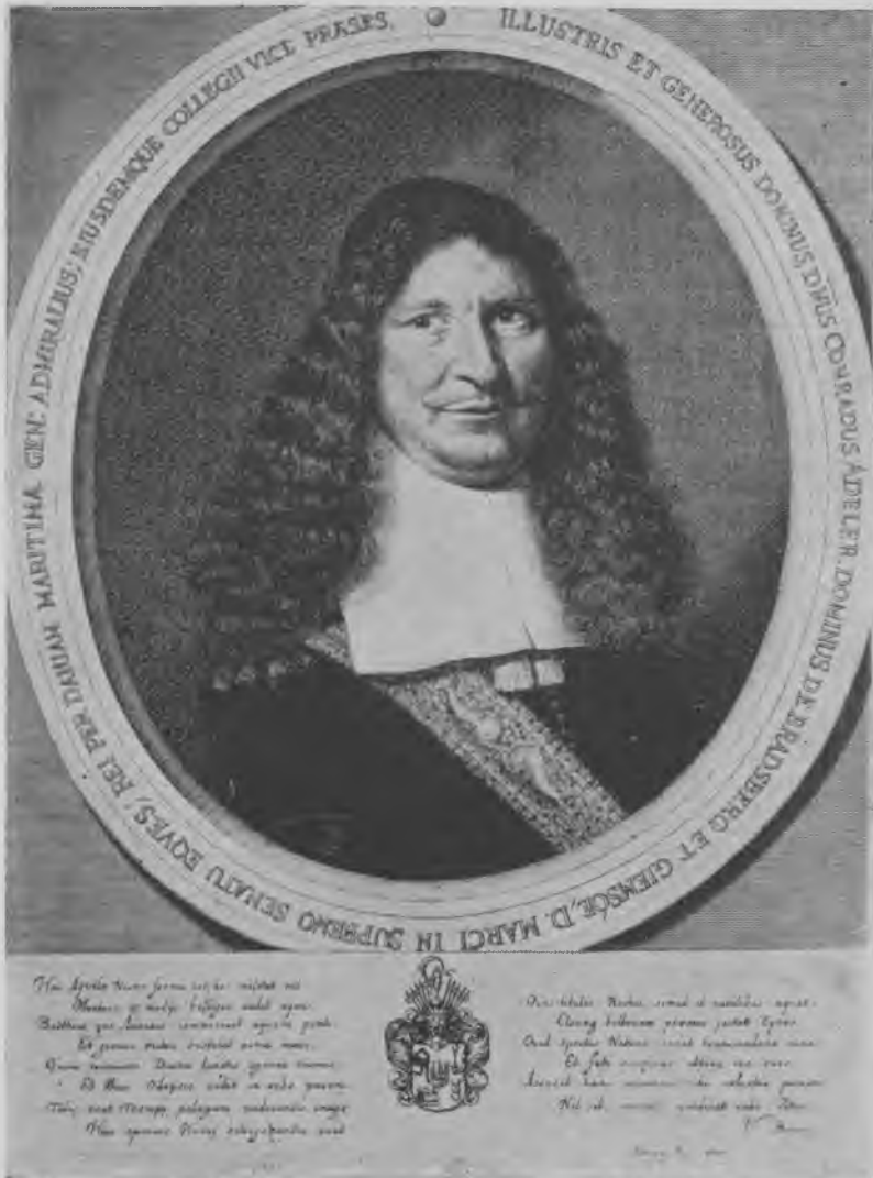
Cort Adeler. Stik af Alb. Haelwegh. Kobberstiksamlngen