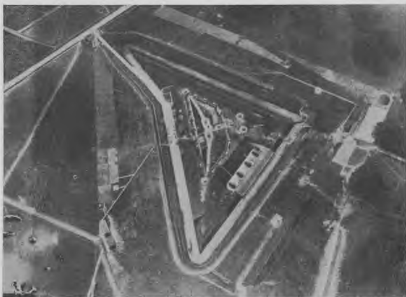
Tårnbæk Fort 1917. Flyvebilledet viser inden for den trekantede fortkerne »kystelementet«, d.v.s. de fire 29 cm stålhaubitser, og bag dem det betonmurede skyttegravssystem nedskåret i fortdækket. De to 120 mm tårnhaubitser ses også foran skyttegravene. Man skimter observationstårnet mellem fortets »strube« og bageste skyttegravsline. I billedets øverste kant ses højre fløj af den skyttegravsline, der gik tværs over Dyrehaven til Fortun Fort