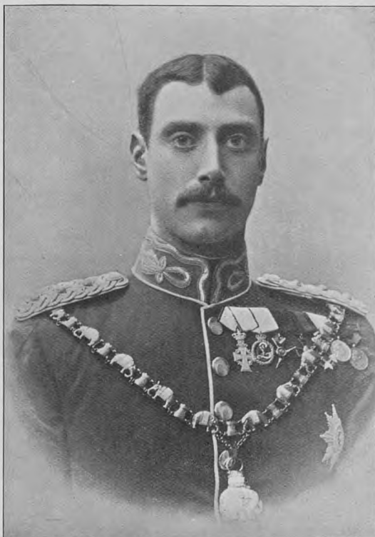
Hs. Kgl. Højhed PRINDS CHRISTIAN TIL DANMARK.

Protektor for »Selskabet De danske Forsvarsbrødre« i Kjøbenhavn.